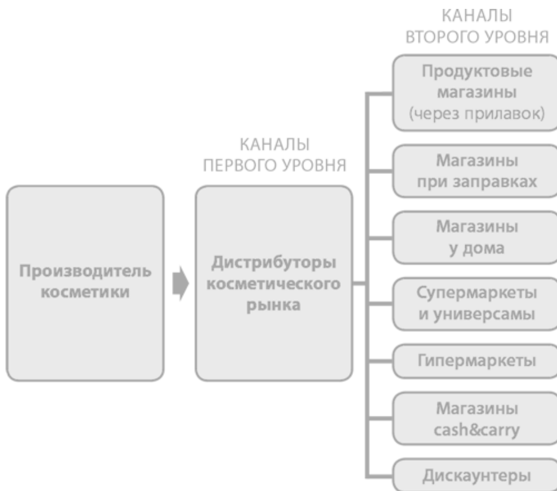
Рис. 1. Каналы дистрибуции производителя косметики

Приведу еще один пример. Рассмотрим каналы, с которыми работает торговый дом – эксклюзивный представитель производителя кондитерских изделий (за основу типологии розничных точек взяты данные исследовательской компании «Бизнес Аналитика»):