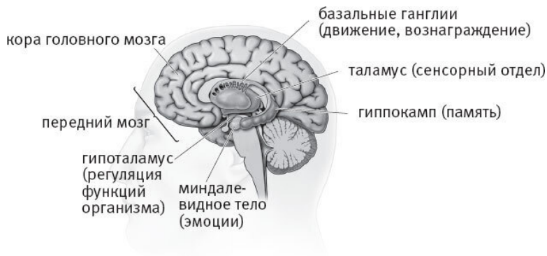
Рис. 2.3. Подкорковые структуры головного мозга

казали, что повреждение гиппокампа неизбежно приводит к потере памяти, особенно к нарушению способности узнавать и запоминать новую информацию в повседневной жизни. Тот, кто помог нам многое узнать о гиппокампе – и о негативных последствиях его повреждения, – был известен большинству нейробиологов только по инициалам Х. М.