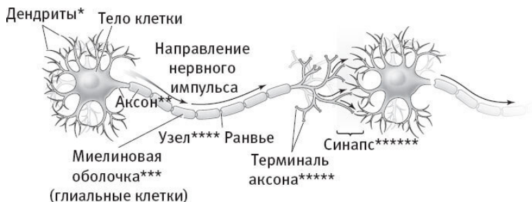
Рис. 2.1. Структура нейрона

гих нейронов, чтобы помочь улучшить взаимодействие этих клеток друг с другом. Они также растут и адаптируются на протяжении всей жизни. Известно, что некоторые виды деятельности, включая интеллектуальное развитие, приводят к появлению новых дендритов, что, по-видимому, вызывает усиление перекрестных связей между нейронами по всему мозгу.