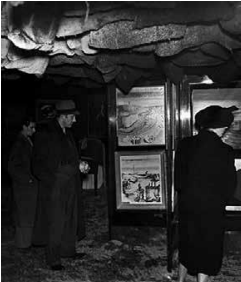
6 Международная сюрреалистическая выставка. Галерея изящных искусств. Париж. Январь – февраль 1938