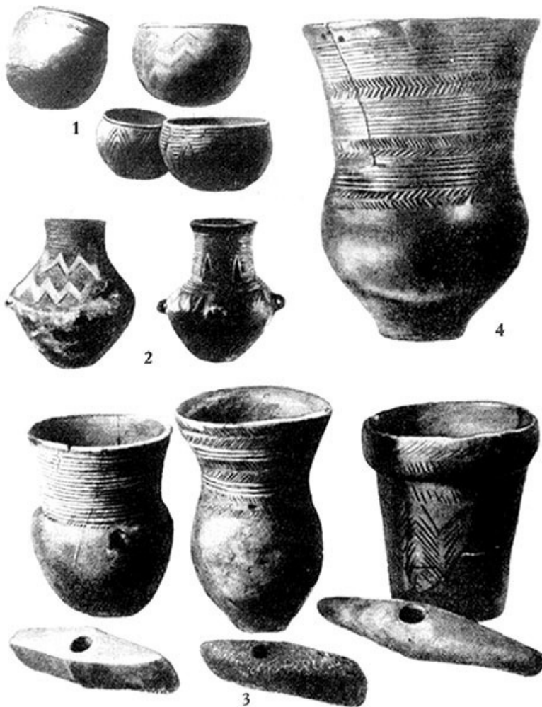
Орудия и посуда «культуры Боевых Топоров»