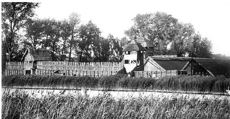
Реконструкция городища лужицкой культуры

По этому поводу Б.А. Рыбаков сделал очень странный комментарий, связав переход от земляных могил к погребальным кострам с переходом от веры в переселение душ к вере в мир иной, куда уходят покойники. Очень, очень странная мысль – ведь страна, в которой по сию пору большинство населения свято верит в переселение душ (помните – «хорошую религию придумали индусы»?), и сейчас сжигает покойников на кострах, а христианская культура, напрочь отрицающая переселение душ, столь же решительно выступает и против кремации, а мертвых именно хоронит.