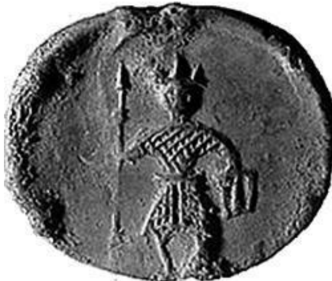
Символ Людинского конца

Лет десять-пятнадцать назад в редкой книжке про Киевскую Русь нельзя было прочесть, что скандинавы называли Русь Гардарик – Страна Городов. Пишут об этом и нынче, но редко кто преминет заметить, что-де слово «гард» в скандинавских наречьях обозначало вовсе не город, а просто огороженное поселение, хутор.