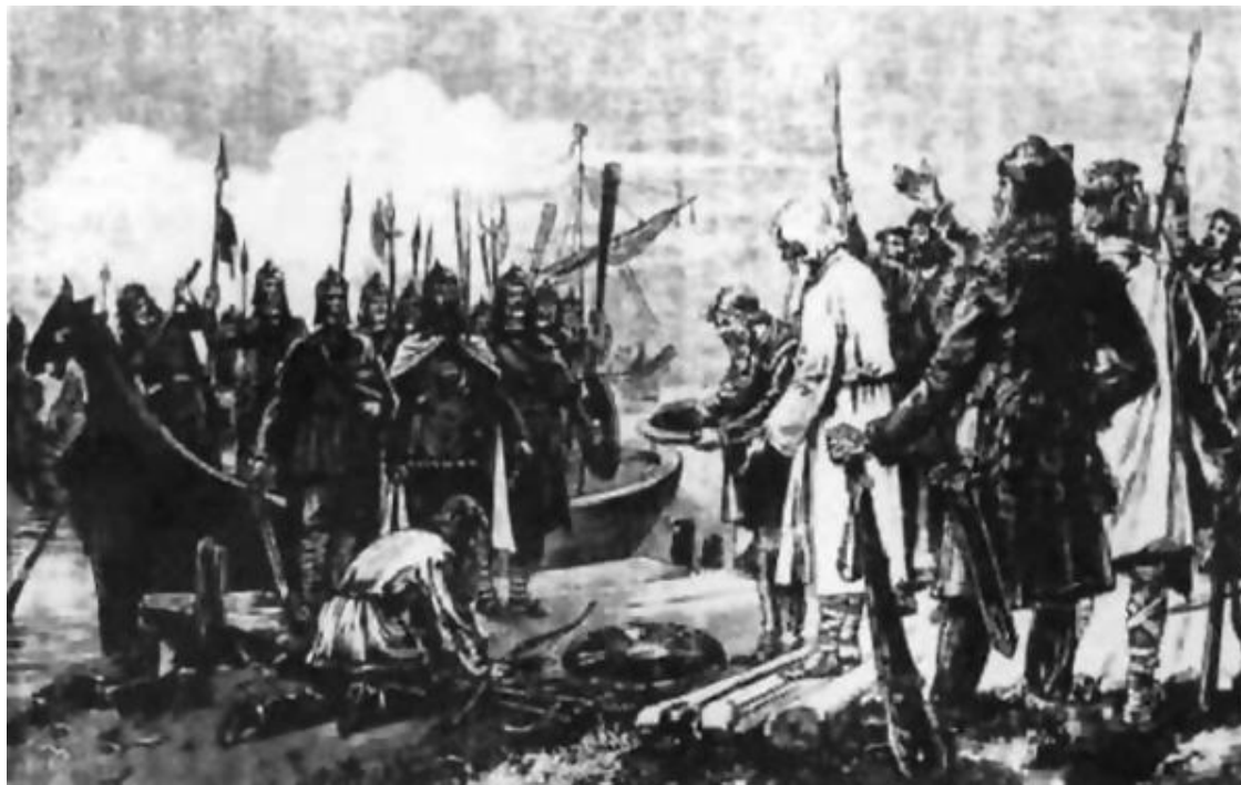
Рисунок XIX века. Вот так это тогда представляли – «норманнская» русь в железных доспехах (скопированных с вооружения русских же воинов эпохи... Московской Руси), и лесовики-славяне – в медвежьих шкурах, с дрекольем и дубинками

чительно уступали. Но воинов в «железных нагрудниках» и шлемах с забралами, сходящих с многомачтовых кораблей к испуганным лесовикам в звериных шкурах, что мерещилось современникам Шлецера, конечно, не было.