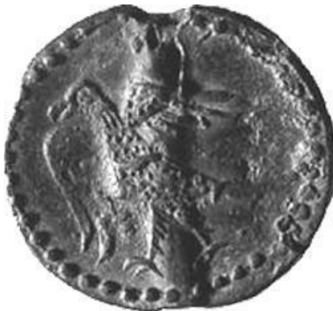
Вислая печать Великого Новгорода с изображением эмблемы – орла. XV в.

Константинополь, мегаполис раннего Средневековья, Восточный Рим, который его жители называли попросту Городом, не признавая других во Вселенной, – хутор?!