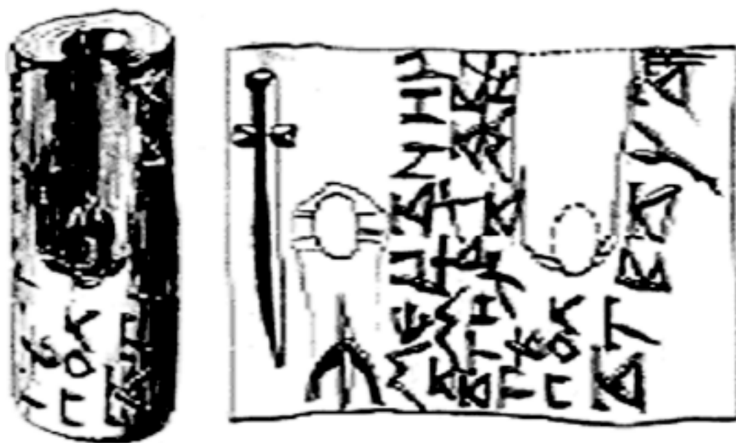
«Пломба» мечника Полтвеца