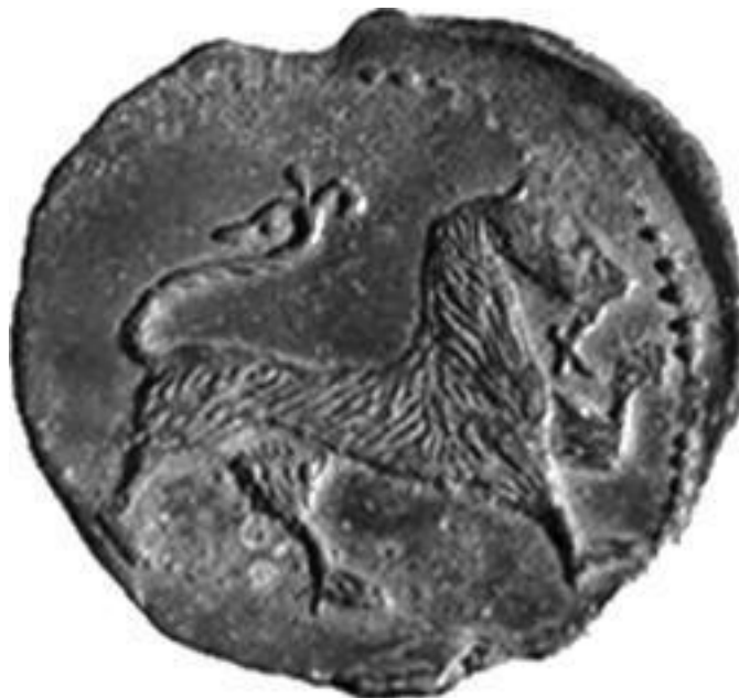
Вислая печать с изображением зверя. XV в.

Белоозеро за свою историю вообще побывал едва ли не на всех четырех берегах давшего ему имя водоема. Не всякий решался строиться на месте города, уничтоженного пожаром, войной или моровым поветрием. Некоторые ученые считают, что первоначальным Новгородом было Рюриково Городище чуть выше по течению Волхова. Другие выдвигают любопытное предположение – будто бы речь в древнейших статьях летописи шла не о Новгороде, а о Невгороде – том, что мы сейчас зовем Ладогой. Ладожское озеро называлось в Средневековье Нево-морем. Тем более что Константин Багрянородный называет в X веке на севере Руси некий город Немогард, обычно в нем и видят Новгород. Другое дело, что Ладога под этим самым именем известна русским летописям с самого начала, и в сагах скандинавов она зовется Альдегой – явная перделка славянского названия.