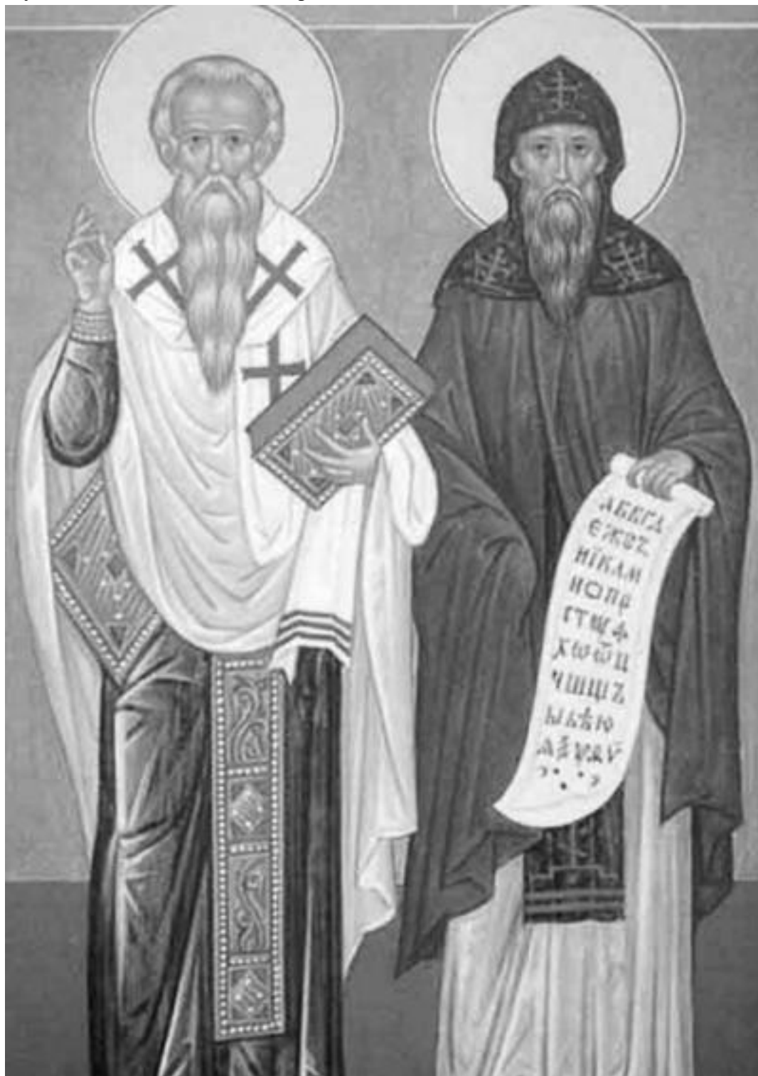
Кирилл и Мефодий. «Просветители» – и вдохновители геноцида... Фреска в Зографском монастыре на Афоне

сто лет спустя о славянах Мореи вспоминают в прошедшем времени. Что с ними стряслось? «Закон судный людям». И святой Мефодий.