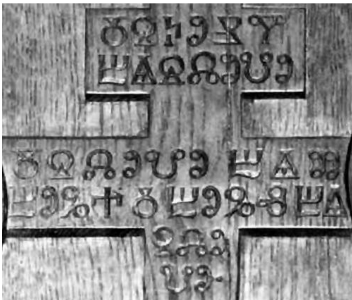
Надпись глаголицей. Именно эту «славянскую письменность», судя по всему, изобрел Кирилл. Очень похоже на наши буквы?