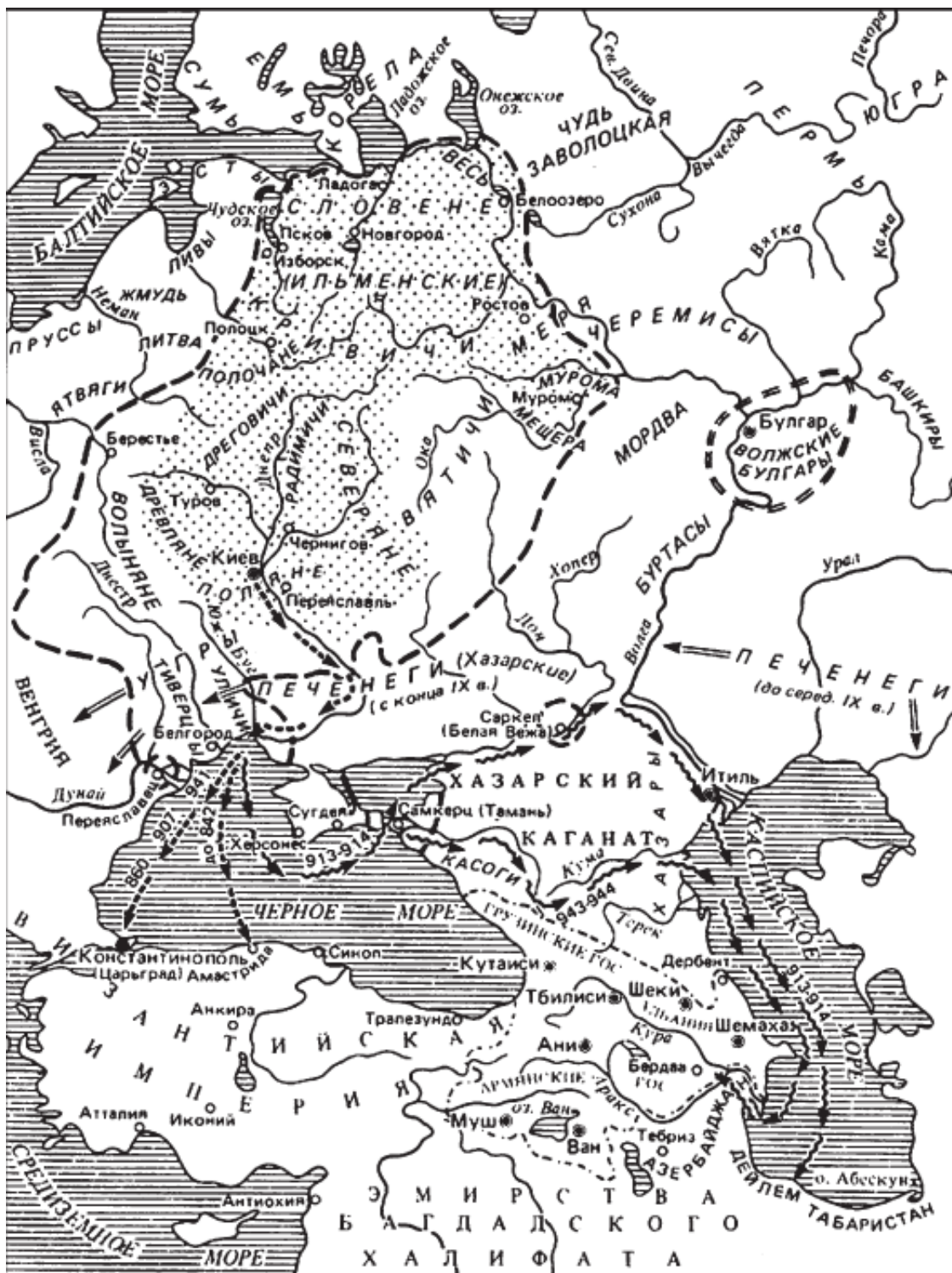
Киевская Русь в IX–X веках

никам: «Вы до 1700 г. (!) были кочевниками, а потом пришли викинги и дали вам государственность». Судя по дате, к викингам парень отнес Петра I. С такими «пособиями» скоро и русские школьники будут смотреть на языческую Русь как на какую-то первобытную орду диких «племен».