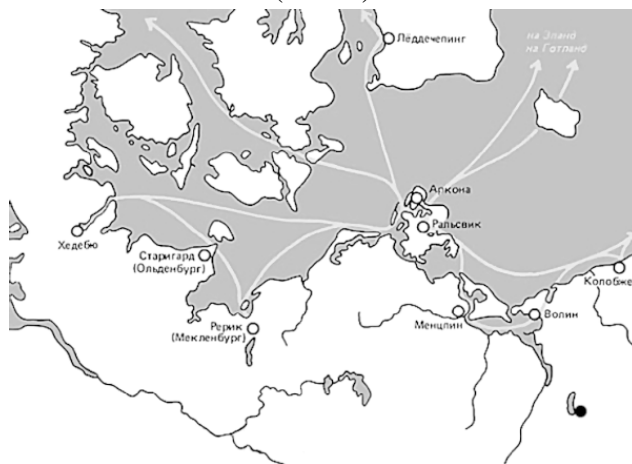
Торговые пути балтийских славян – по крайней мере, их часть

Господство славян-вендов в балтийской торговле оставило след и в скандинавских языках. Е. Мельникова насчитывает 12 славянских заимствований в них (напомним, что скандинавских в древнерусском – меньше). И большинство из них относится к торговле. Славянские купцы приезжали на торг (torgh) на лодьях (lodhia). Любопытно, что ни одно слово из богатейшего морского словаря норманнов в славянские языки не попало. У славян были свои слова для морского дела, появившиеся до эпохи викингов, в те времена, когда плавание легендарного конунга Хрольва Жердинки из Дании в Швецию было для скандинавов странствием на край света. Суда Олега Вещего летопись называет не «драккарами» или «кноррами», а «кораблями», от вендского koḡab . Впрочем, славянские купцы могли приехать и верхами, в седлах ( sadul ) с высокими луками ( loka ), везя товар в седельных мешках – кош ( katse ). Приехав, они устраивались на лавах ( lava ) и извлекали безмены ( besman ) и товар: шелка ( silki ), вместе с арабским серебром приходящими с Востока, и соболей ( sobel ) из русских лесов. Их путь, тяжелый и опасный, пролегал через множество границ ( graens ), и купцы были рады после торга отдохнуть и закрепить сделку ковшом пива с хмелем ( humle ).