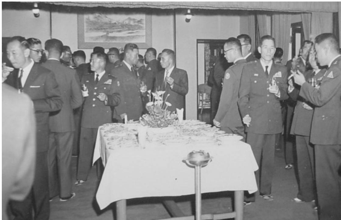
1961 год. Генерал Чой (в военной форме, вдалеке слева) на вечеринке с Паком Чон Хи (в центре кадра, в штатском).

операциями во многих странах, входивших в ООН. 116 Ким прекрасно говорил по-английски, финансировал залы тхэквондо, проводил мероприятия в Англии и США, а также содействовал спецоперациям как минимум с 1963 по 1971 год. В целом миссии ЦРУК включали в себя давление на корейских американцев и подкуп американских политиков, не поддерживающих южнокорейскую диктатуру.