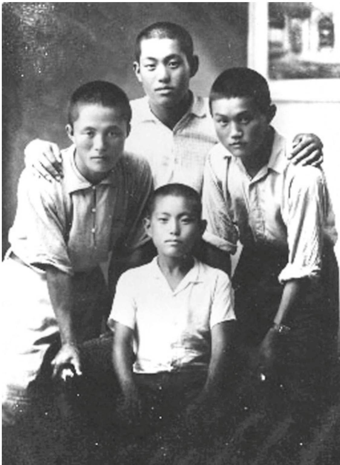
Чой Хон Хи на фото слева.

Чой бежал домой и спрашивал себя: убил ли он человека? Столько крови! Что сделают его родители? Он, его брат и сестра всегда слушались отца, изучавшего труды Конфуция, и ещё до открытия пивоварни ставшего доктором китайской медицины. Их умы были так перегружены обязательствами, и традициями, а «домашнее» конфуцианство так искажено, что бабушка Чоя хранила свои отрезанные ногти, потому, что уважение к родителям означало уважение к каждой части своего тела.