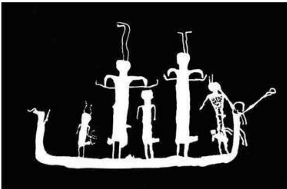
Египетский наскальный рисунок, на котором изображены «восточные захватчики» на азиатской лодке (по Винклеру)