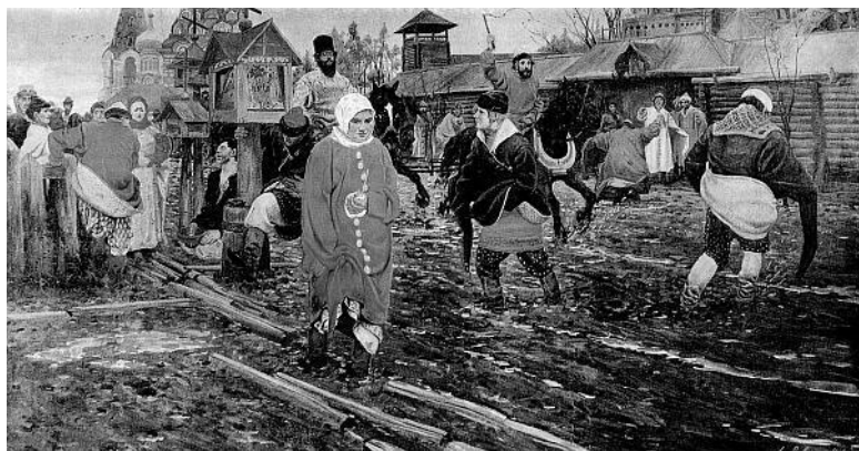
Московская улица. XVII в. Художник А.П. Рябушкин

В XVII в. на подворье к гонцам блюда посылались зачастую даже не с кухни царя, а «с яму» (из трактира), хотя и от имени царя.