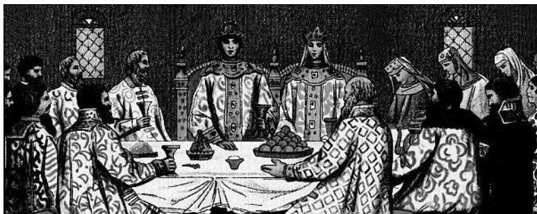
Царская трапеза. С рисунка В. Васнецова (фрагмент)