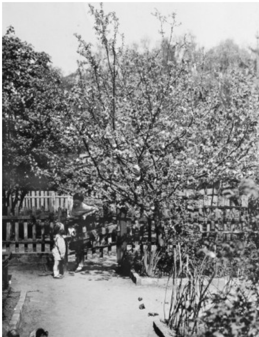
Сад во дворе дома. 1930 г.

Продавец черпал керосин из бака мерными кружками на длинных ручках. Для денату- рата были кружки поменьше. Его обычно брали в бутылки, а керосин – в баклажки. В керо- синовой лавке продавались еще мыло и свечи. Свечами у нас дома пользовались редко, а вот керосиновые лампы всегда были наготове из-за перебоев с электричеством.