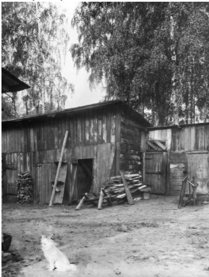
Сарай с курятником и свинарником на краю участка. 1930-е гг.

дельфиниумы разной формы и расцветок, шток-роза, настурции, громадные георгины, ночные фиалки или маттиола (любимые мамины цветы). Оставалось место и для огорода: ревень, огурцы, свекла, редиска – всего понемногу. Сажали и картошку, но это уже не в саду, а на пустыре за домом с северной стороны.