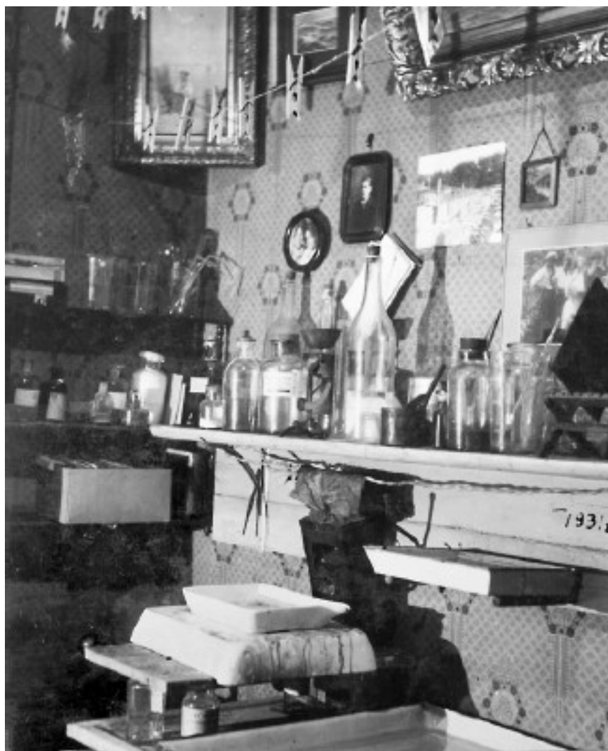
Отцовская фотолаборатория. 1931 г.

Из прихожей налево был проход в коридор и в кухню. По коридору находились еще три комнаты меньшего размера, где жили соседи: две рабочие семьи по три человека и одна одинокая женщина. Я их почти не помню. Больших скандалов с соседями, по-видимому, не происходило. Как я уже упоминал, до революции дед занимал всю квартиру целиком. Полагаю, что в «соседских» комнатах, выходивших окнами к сараю, в ту пору жила прислуга или наемные работники.