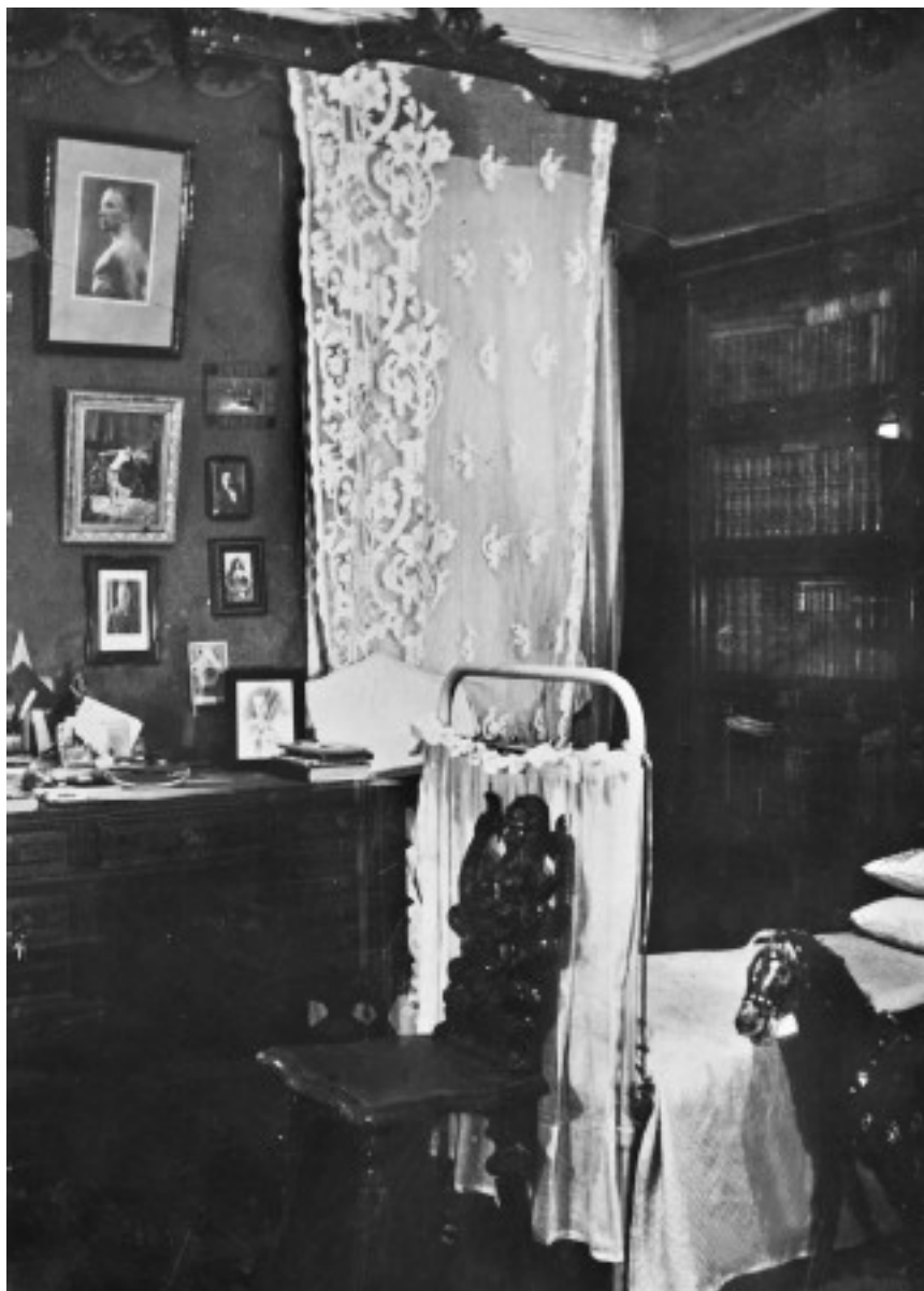
Спальня. 1930-е гг.