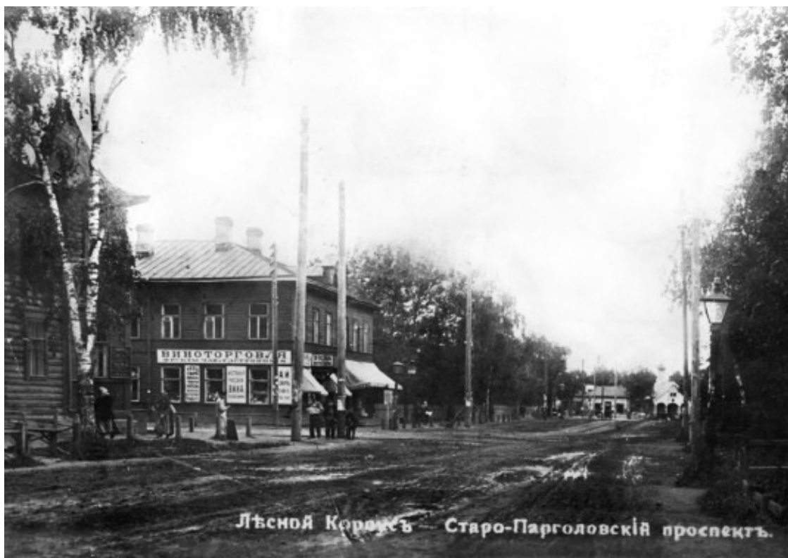
Лесной. Старо-Парголово́вский пр. Открытка начала XX в.