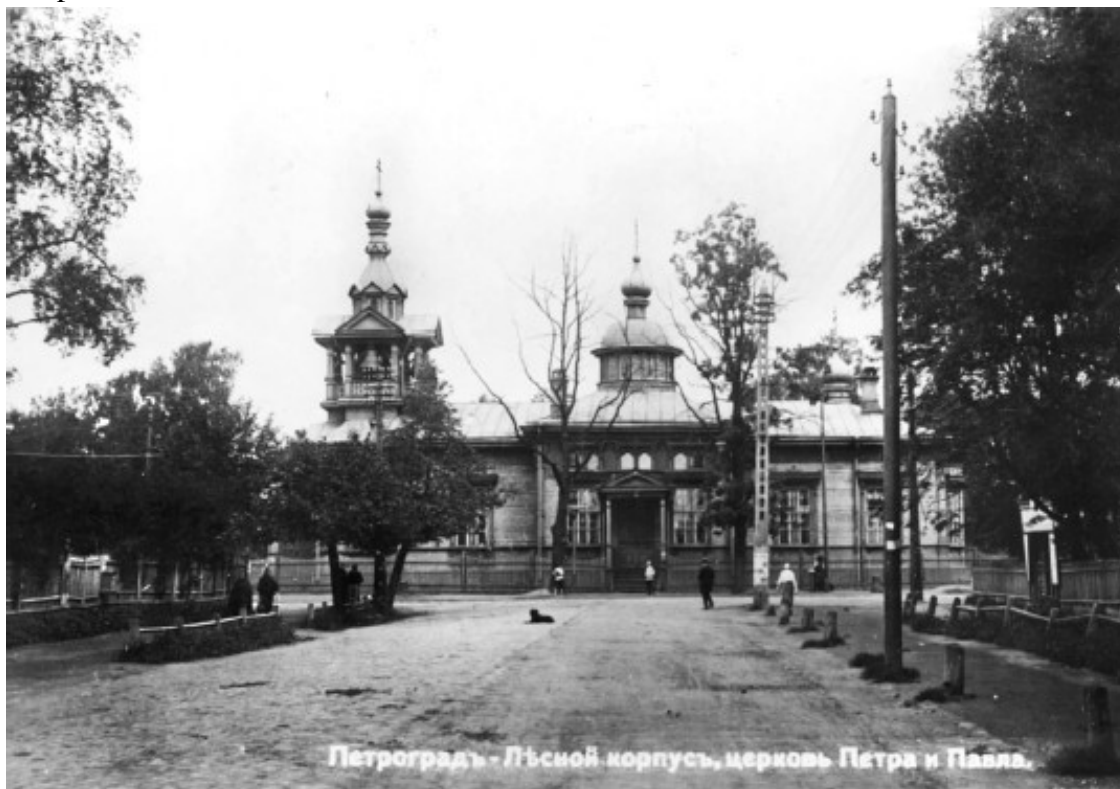
Лесной. Церковь Петра и Павла. Открытка начала XX в.