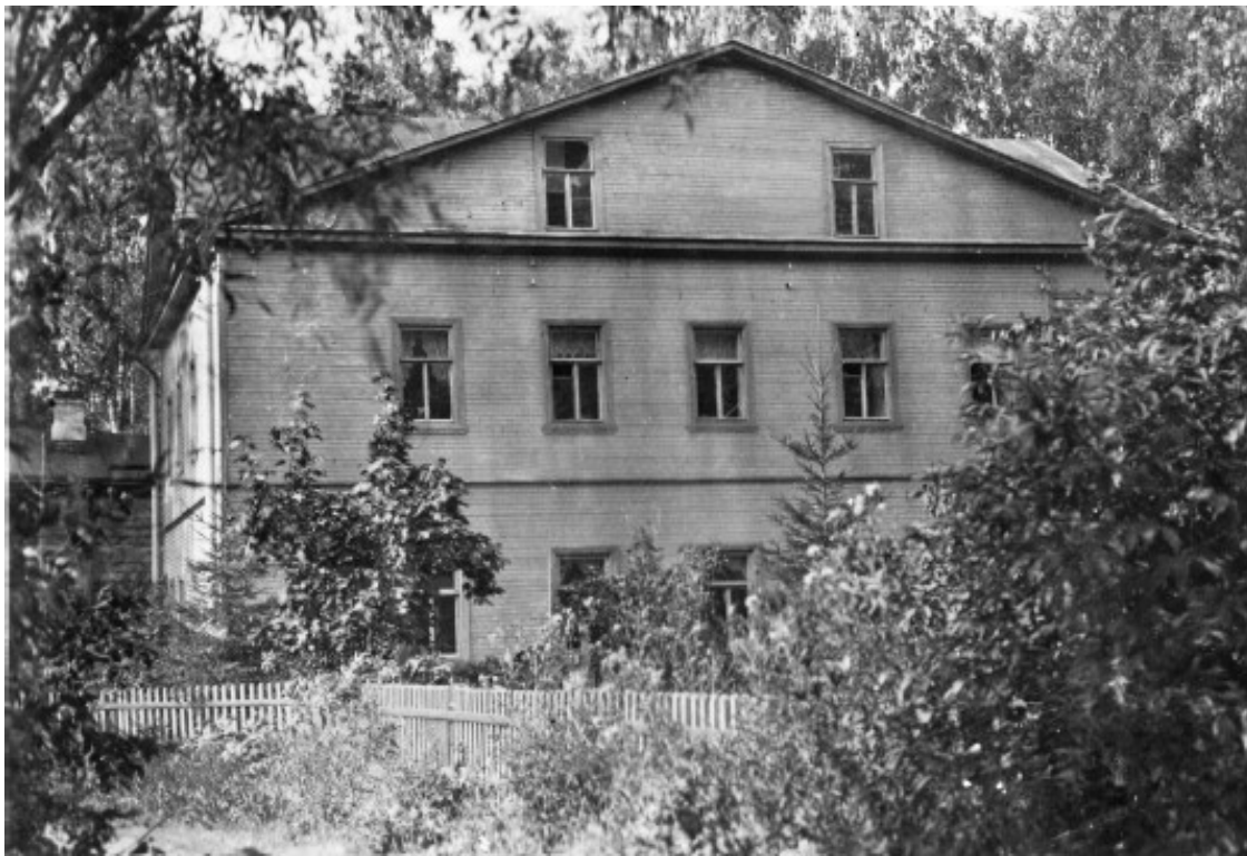
Институтский пр., 18-2. 1910-е гг.

Но это все было позже, а сейчас вернусь к дому моего детства. Адрес был такой: Лесной, Институтский пр., д. 18, кв. 4. Под № 18 числилось четыре дома. В первом, каменном двухэтажном особняке с зеркальными окнами, выходящем фасадом на Институтский проспект, было три квартиры. Наш дом стоял за особняком и левее. Счет квартир был во всех домах общий.