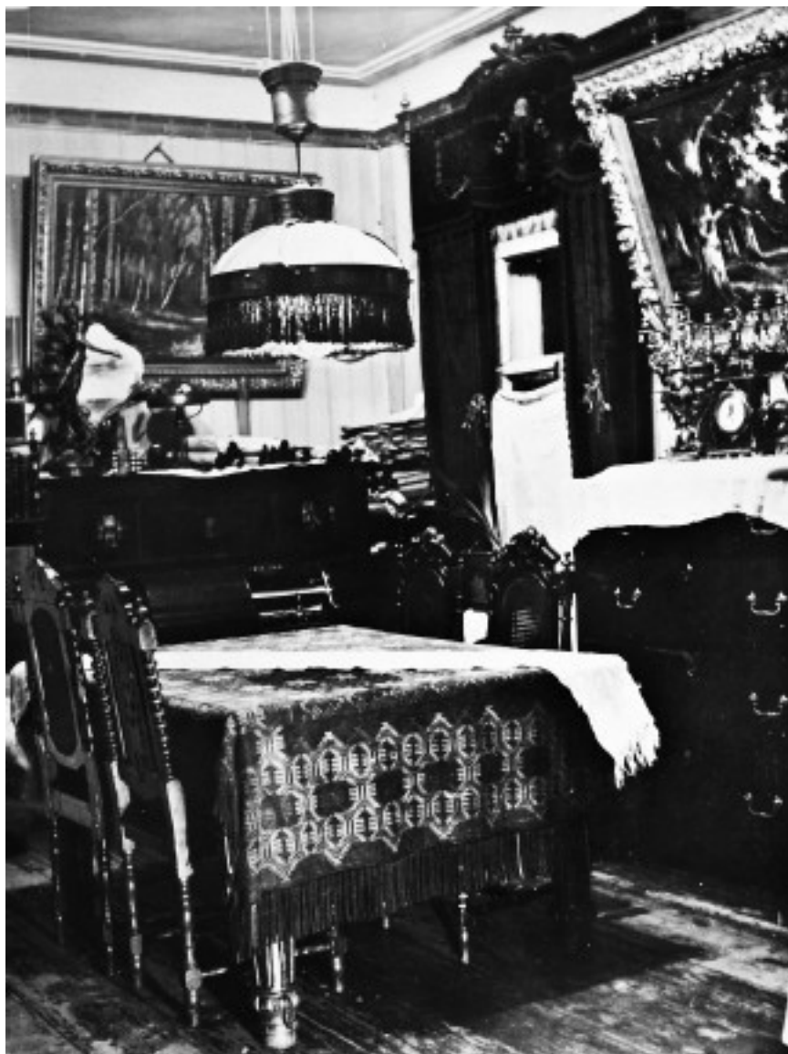
Столовая. 1930-е гг.

Был еще странный инструмент под названием «Pianola». Этот пневматический механизм с молоточками по числу клавиш пианино приставлялся к клавиатуре и заменял собой пианиста. Своего рода программируемый робот. В него вставлялись программы в виде широких бумажных перфолент (рулонов). Робот играл записанную на перфолентах музыку, ударяя молоточками по клавишам пианино. Правда, для игры требовалось, чтобы человек непрерывно подкачивал воздух педалью и выполнял еще кое-какие несложные операции управления. Мне казалось, что робот играл очень хорошо. Рулонов было много с самой разнообразной музыкой. Сиди и качай. Что касается пианино, то на одном из снимков, где за пианино сажу я, можно различить клеймо R&H Fibiger.