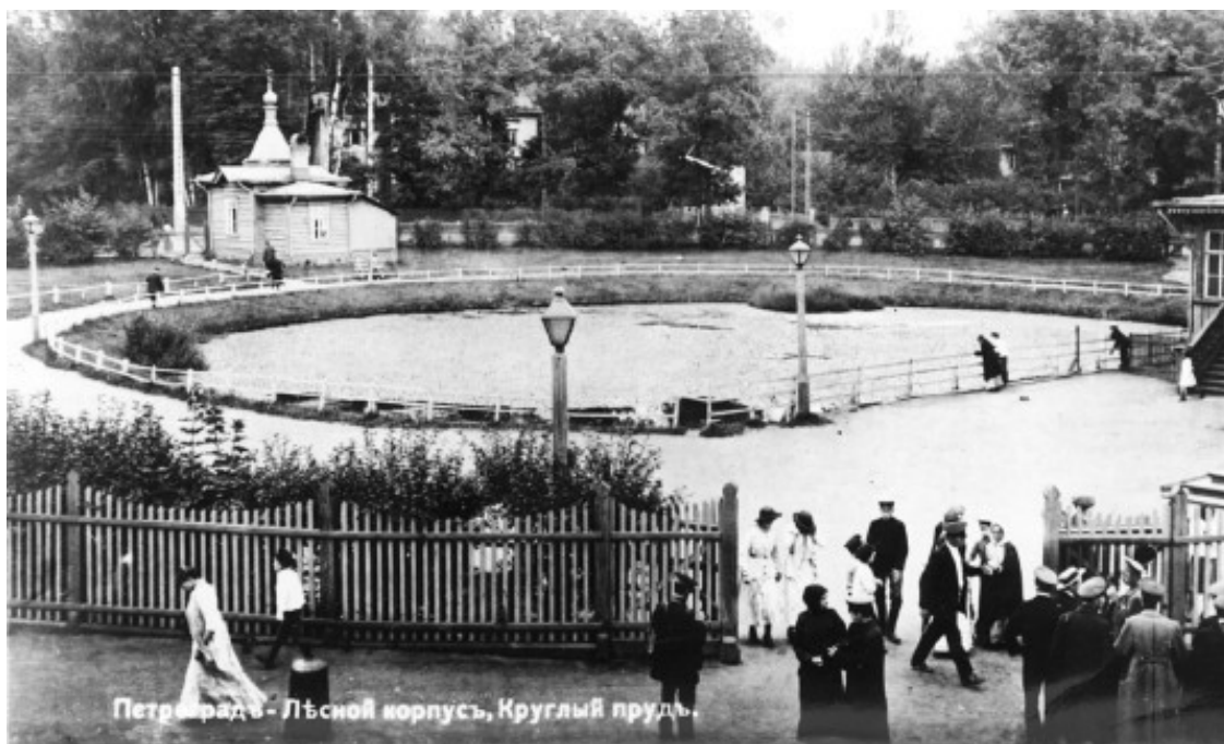
Часовня у Круглого пруда. Фото начала XX в.

...Уже после Октябрьской революции, смотря эйзенштейновского «Потемкина», мы аплодировали красному флагу, поднимавшемуся на броненосце в эпилоге фильма. Флаг был раскрашен вручную.