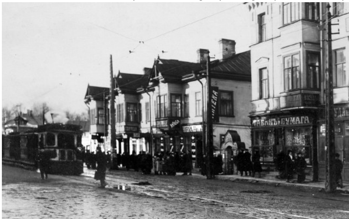
2-й Муринский проспект недалеко от пересечения с Малой Спасской улицей. Фото начала XX в.

Жизнь врача была беспокойной. Отец говорил «Собачья жизнь! Никогда не можешь принадлежать себе ночью, в гостях: если больной – вставай на вызов, пусть и мороз, и слякоть... В полной темноте ищи дом, а потом успокаивай истеричку, поссорившуюся со своим мужем».