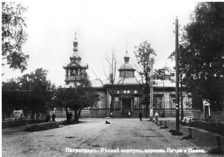
Лесной. Церковь Петра и Павла. Открытка начала XX в.

Впрочем, вернемся к самой книге. Она необычна во многих отношениях, поскольку в ней история местности раскрывается через рассказы ее жителей, причем зачастую не выдающихся деятелей, а самых простых, незначительных людей. Для истории они не менее дороги, чем великие личности.