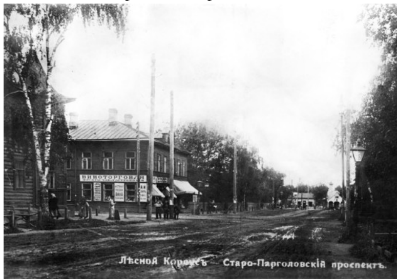
Лесной. Старо-Парголовский пр. Открытка начала XX в.