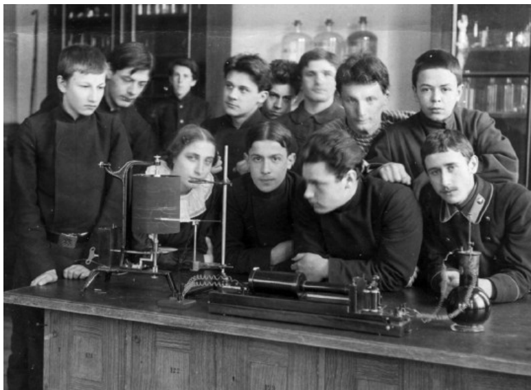
Коммерческое училище в Лесном, фото 1909–1910 гг.

Беседа врача и больного шла спокойно и обстоятельно. Выписанный рецепт скреплялся оттиском собственной печати. Никакой таксы за прием или вызов врача на дом у отца не было. Каждый платил столько, сколько мог, а иногда, наоборот, врач давал неимущему деньги на необходимые лекарства.