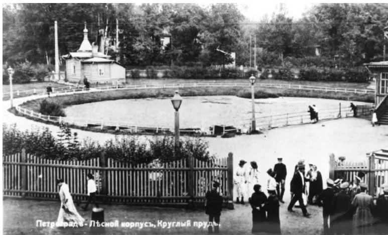
Петроград - Лесной корпус, Круглый пруд.

Часовня у Круглого пруда. Фото начала XX в.