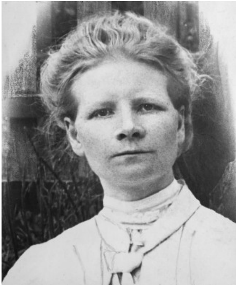
Бабушка М.Г. Кобак. 1902–1904 гг.