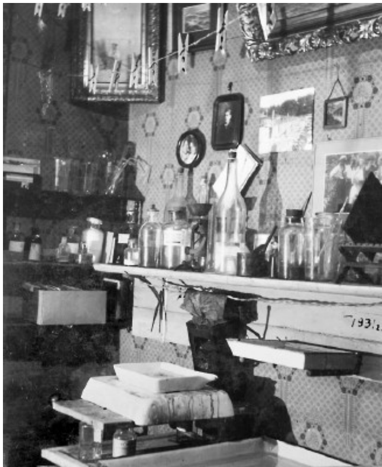
Отцовская фотолаборатория. 1931 г.