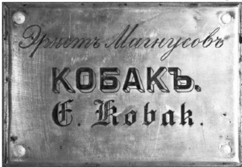
Дверная табличка Кобаков

В начале тридцатых годов дома были коммунальными, но все оборудование сохранилось с дореволюционных времен. Дома были построены очень добротно: хорошие печи прямоугольной формы с обшивкой из гофрированного железа и литыми чугунными дверцами, электричество, водопровод, канализация со свинцовыми трубами (местная, с выгребными ямами), кладовки, подвалы, двойные входные двери.