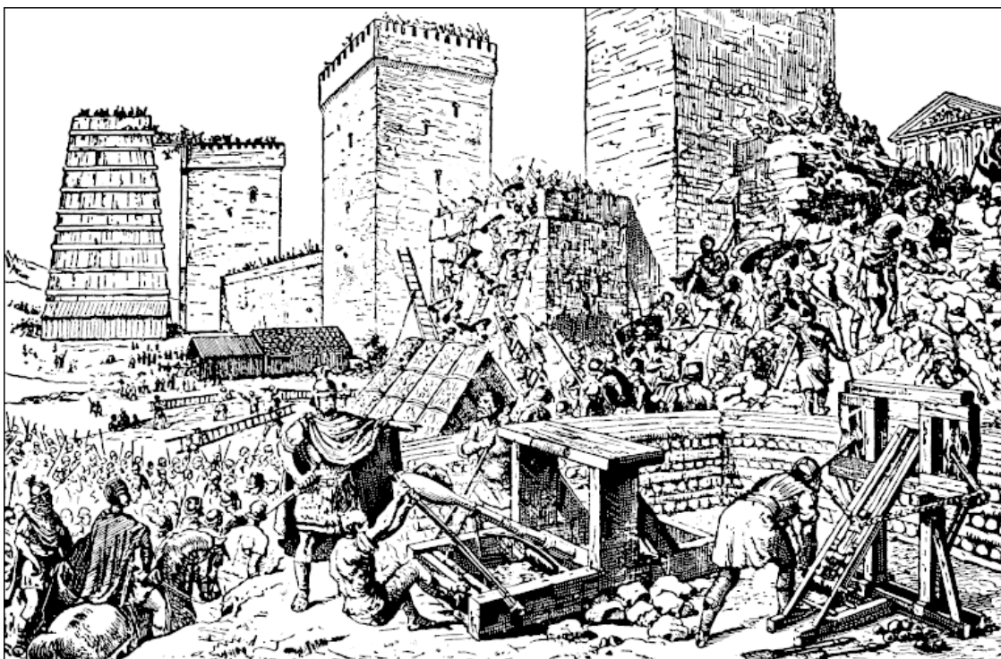
Осада города в древние времена