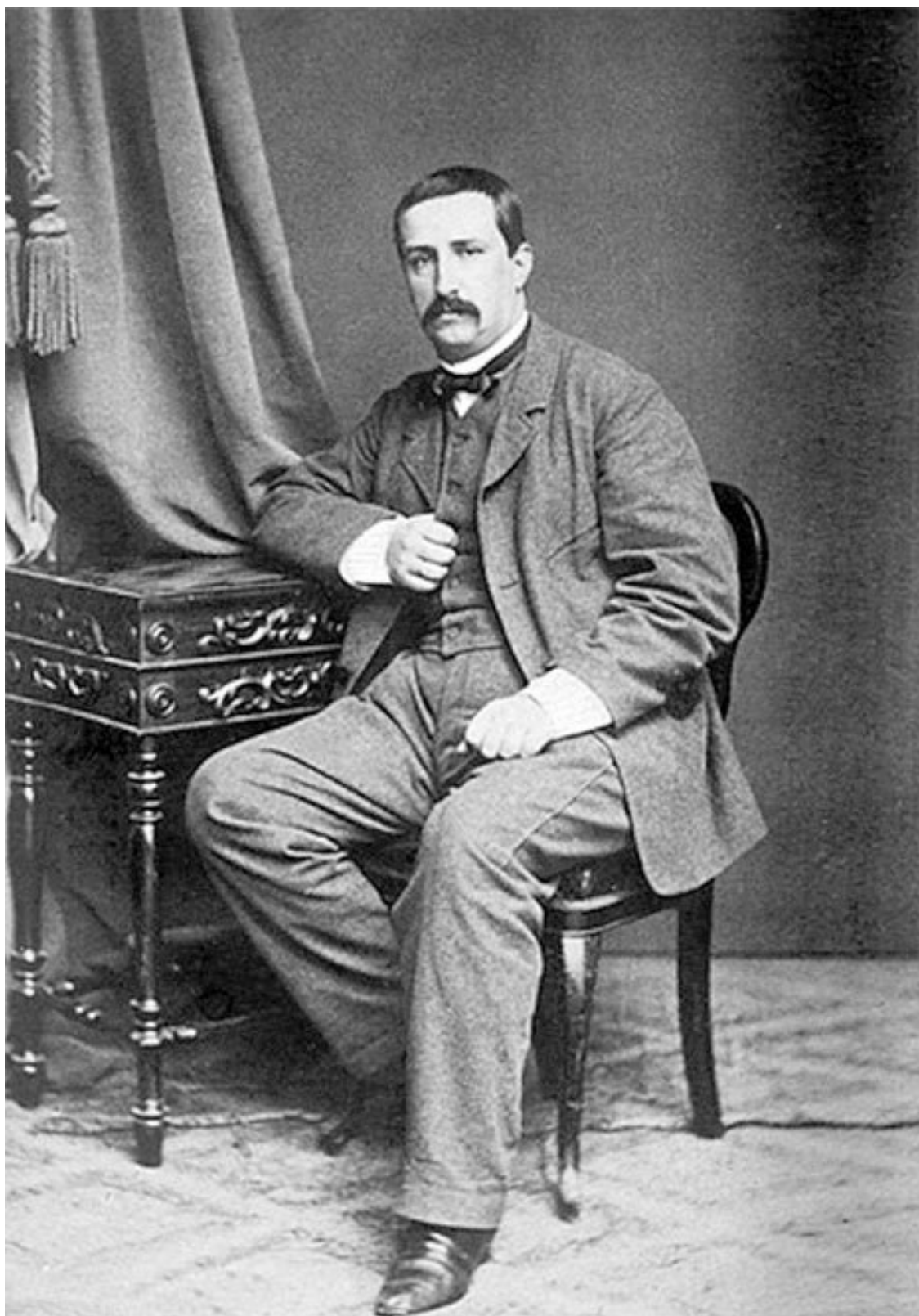
Александр Порфирьевич Бородин

К этому времени Бородин был уже подлинным богатырем русской музыки. Созданная им в числе других замечательных сочинений симфония № 2 (премьера состоялась 2 февраля 1877 года) с легкой руки музыкального критика В. В. Стасова навсегда получила название Богатырской симфонии. Стасов напишет по этому поводу: «Сам Бородин рассказывал мне не раз, что