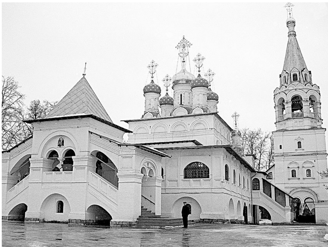
Павловская слобода. Церковь Благовещения Пресвятой Богородицы, перестроена в XIX в. 1662 г.

гельское». Недалеко от Павловской Слободы, у так называемого «Заводского мостика», при впадении речки Рудинки в реку Белянку, в конце XVIII – начале XIX века был расположен хрустальный завод князя Н. Б. Юсупова. Хрустальный завод сильно пострадал в Отечественной войне 1812 года и впоследствии не восстанавливался. В 1935 году Истринский музей провел здесь полномасштабное обследование и раскопки. Обнаруженные слитки и осколки стекла несли на себе юсуповские клейма.