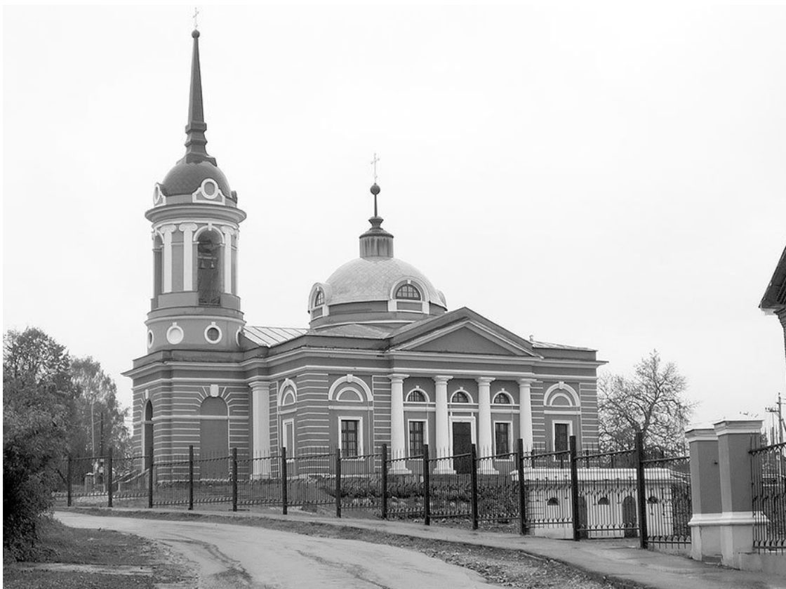
Церковь Рождества Христова.

Интересный факт: эти места были излюбленными для великого русского композитора Александра Порфирьевича Бородина (1833–1887). В 1884 году А. П. Бородин жил и работал на даче в Павловской Слободе и в письмах своих отсюда искренне восхищался природой здешних мест. Сохранилось его письмо от 25 августа 1884 года, в котором композитор не скрывает своего удовольствия: «Местность восхитительная, хорошее купанье, прогулки чудесные и разнообразные».