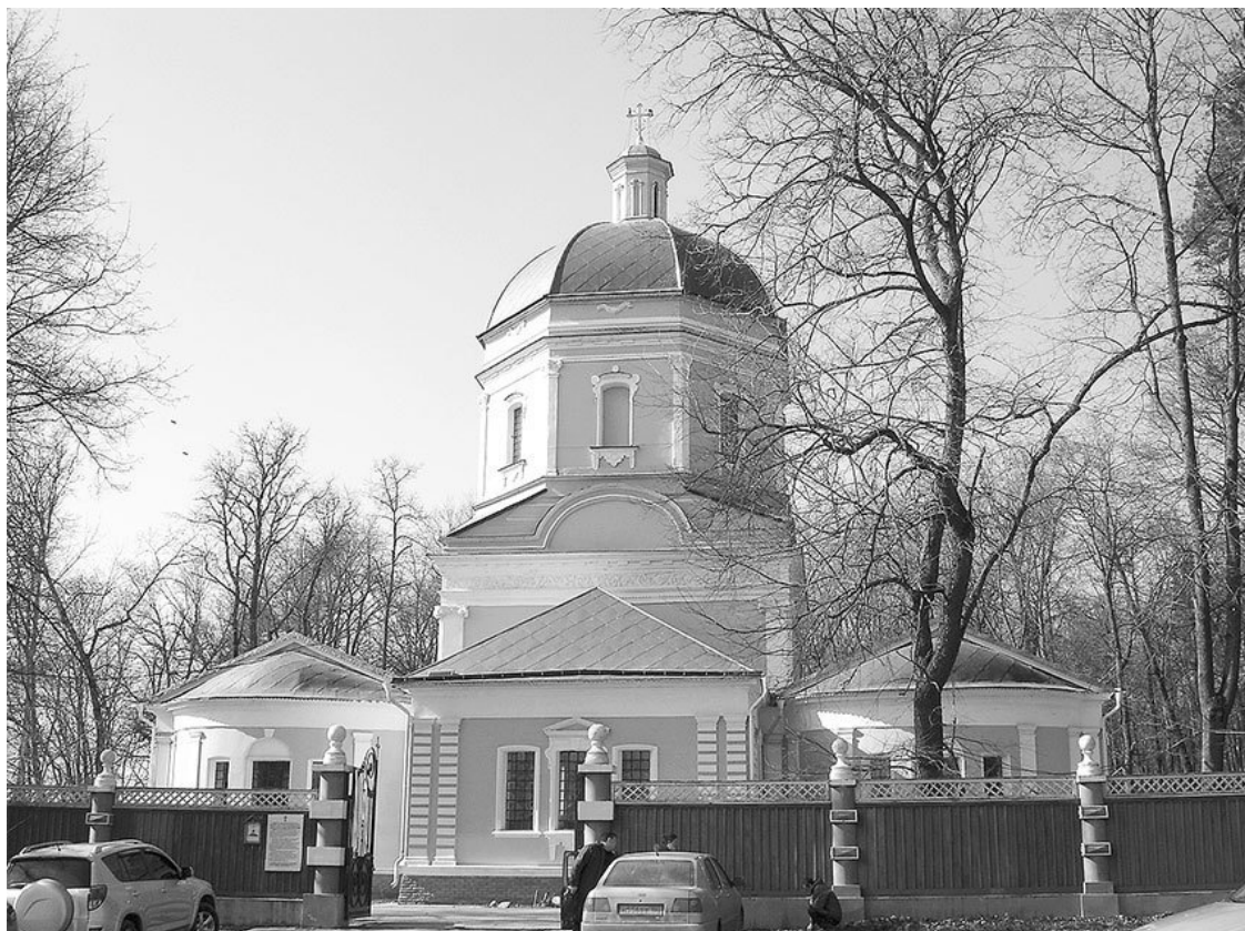
Ильинский храм.

После смерти Сумарокова в 1780 году село Александровка вошло в состав Ильинской вотчины и сделалось, таким образом, деревней. Церковь разобрали, а ее прихожан приписали к расположенному поблизости Ильинскому храму, построенному архитектором А. П. Евлашевым (учеником В. В. Растрелли) в стиле раннего барокко и освященному в 1740 году. В это же время Александровка упоминается как имение помещика Полтева.