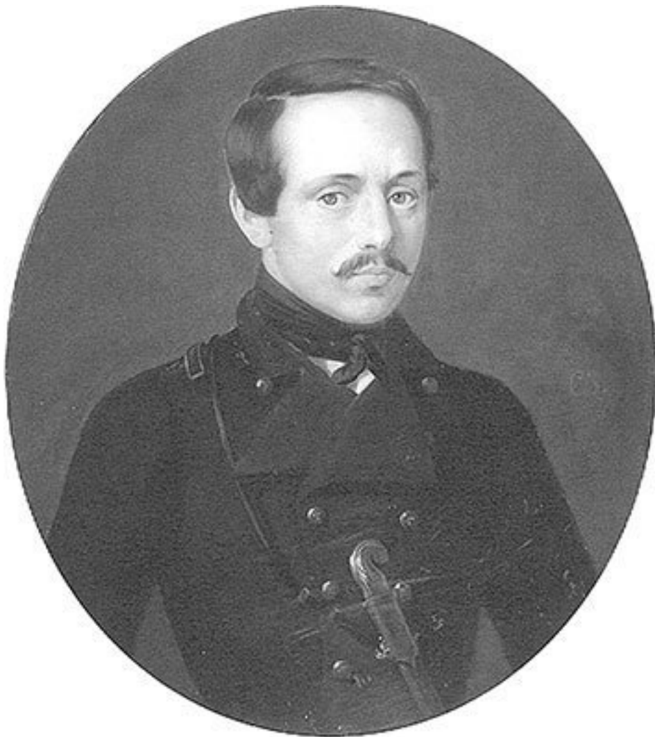
М. Ю. Лермонтов в штатском сюртуке. Художник П. Е. Заболотский

М. Ю. Лермонтов (1814–1841) нисколько не преувеличивал, когда рисовал в стихотворении «Отчизна», говоря о России, «разливы рек ее, подобные морям». Память юного Пушкина (а она всегда поражала современников) жадно впитывала рассказы бабушки и местных старожилов. Живыми образами рисовались в воображении и белокаменная церковь-лебедь со стерегущими ее тридцатью тремя богатырями. Я выскажу здесь смелое предположение, тем не менее имеющее полное право на существование. Через двадцать лет после отъезда из Захарова, уже в Царском Селе, в конце лета 1831 года А. С. Пушкин напишет свою «Сказку о царе Салтане, о сыне его славном и могучем богатыре князе Гвидоне Салтановиче и о прекрасной Царевне Лебеди». В сказке этой оживут детские его воспоминания о посещениях подмосковного храма в Иславском: