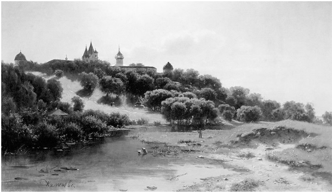
Вид Саввино-Сторожевского монастыря. 1860-е гг. Художник Лев Каменев

Тот факт, что Пушкин отчетливо запомнил эти места с детства, подтверждается его позднейшими сочинениями. Так, например, в «Борисе Годунове» владелица корчмы объясняет Григорию Отрепьеву по его просьбе дорогу: «...а там прямо через болото, на Хлопино, а оттуда в Захарьево...» А в повести «Барышня-крестьянка» из пушкинского цикла «Повести Белкина» горничная Настя рассказывает барышне о сельском празднике: «Были колбинские, захарьевские, приказчица с дочерьми, хлупинские...» Здесь прямо звучат названия этих подмосковных деревень: Хлопино – Хлюпино, Захарьево – Захарово.