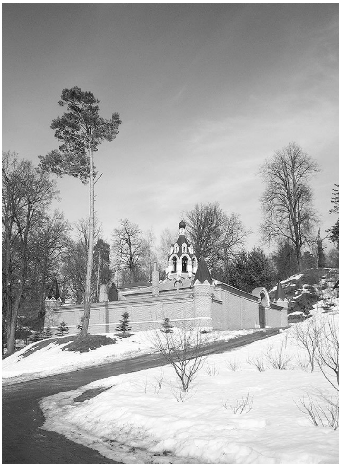
Саввино-Сторожевский скит.

Иславское – одно из древнейших сел Подмосковья, впервые упомянутое в летописях середины XIV века. Здешние курганы переносят нас в еще более давние времена – в середину первого тысячелетия нашей эры. До 1620 года Иславское было дворцовым селом. Уже тогда здесь стояла деревянная церковь Святого Георгия, окруженная 33 липами – по числу лет Христа. Шли годы, менялись владельцы села. Среди них видим бояр Морозовых, графов Апраксиных, дворян Дурново, военного губернатора Москвы И. П. Архарова. Церковь заново была отстроена в белом камне мастерами школы Казакова и освящена во имя Спаса Нерукотвор-