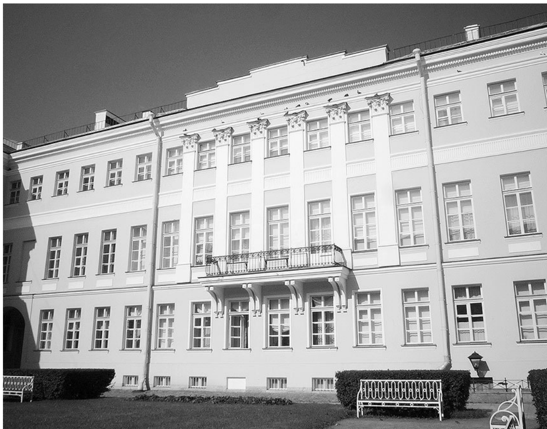
Дом Пушкина на Мойке.