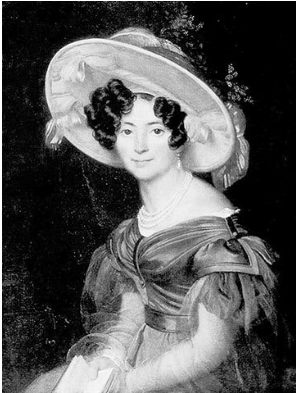
Зинаида Александровна Волконская

В семье выросла дочь князя Белосельского-Белозерского от первого брака Зинаида, впоследствии княгиня Зинаида Александровна Волконская (1789–1862), хозяйка знаменитого литературно-музыкального салона на Тверской. Здесь ныне расположен известный Елисеевский гастроном, а в салоне пушкинской эпохи побывал некогда весь культурный цвет Москвы. У потомков Волконской в Нью-Йорке поныне хранится автограф посвященного ей стихотворения Пушкина «Среди рассеянной Москвы» (1827), а в парке ее виллы в Риме установлен бюст великого поэта. Вот эти стихи, написанные великим поэтом в мае 1827 года и озаглавленные им «Княгине З. А. Волконской при посылке ей поэмы «Цы ганы»: