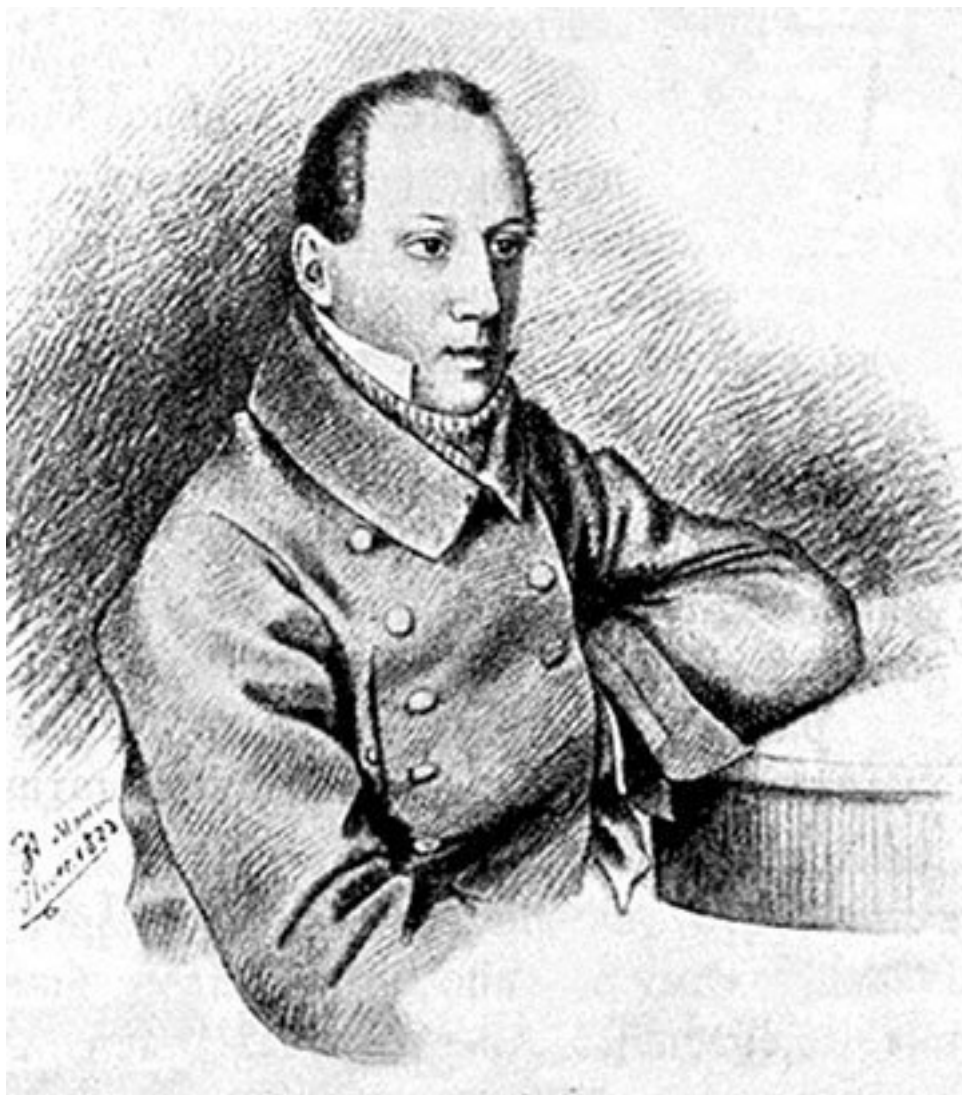
Петр Яковлевич Чаадаев. 1823 г. Рисунок Ж. Вивьена

Писатель-литературовед В. В. Вересаев (1867–1945), работавший неподалеку от Александровки в поселке Николина Гора над своим двухтомным сочинением «Спутники Пушкина», в обширной главе, посвященной другу Пушкина Петру Чаадаеву (1794–1856), возвращает нас в век XIX: