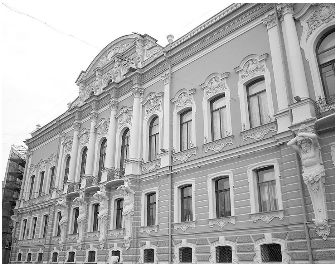
Дворец Белосельских-Белозерских в Петербурге.