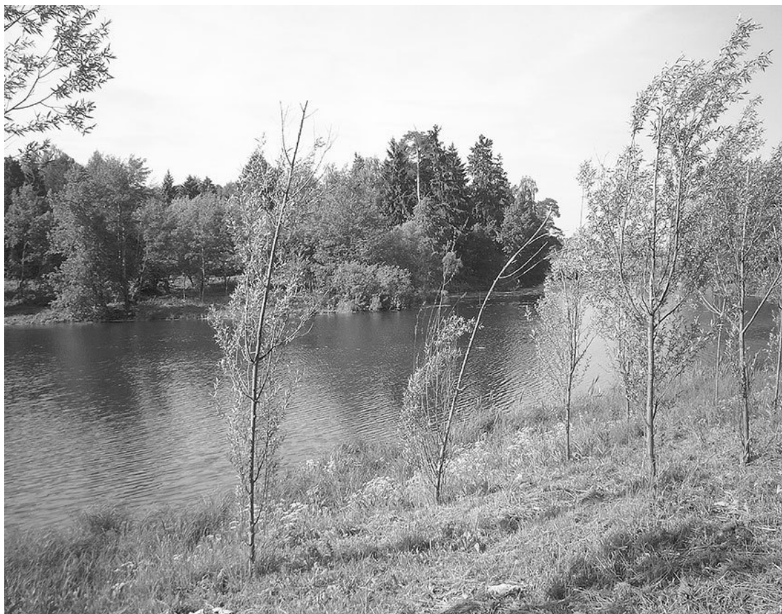
Пруд в Захарове.