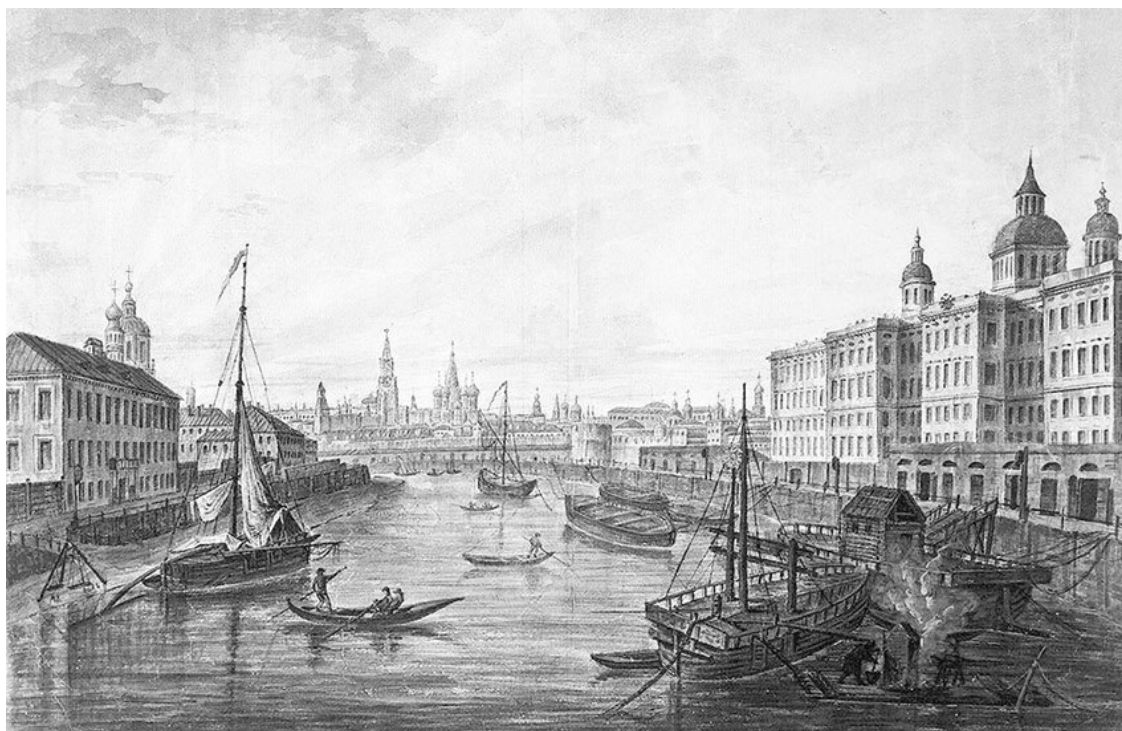
Воспитательный дом. 1800-е гг. Рисунок Ф. Алексеева

25 июня 1852 года приказом тогдашнего министра путей сообщения графа Петра Андреевича Клейнмихеля А. И. Дельвига перевели в Москву и назначили директором московских водопроводов. Кроме того, Дельвиг находился в должности председателя архитектурного совета Комиссии по постройке храма Христа Спасителя, с 1852 по 1861 год.