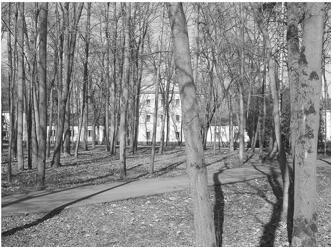
Парк в Ильинском. Флигель.

Рошу затем превратили в усадебный парк. И теперь этот парк сохраняет свою первозданную прелесть, а под прямым углом к Москве-реке его пересекает живописный овраг, именуемый Елизаветинской долиной. Название – в честь жены графа Елизаветы Александровны. Здесь же уцелел Елизаветинский павильон – беседка-ротонда из восьми тосканских колонн начала XIX века. В беседке графиня любила отдыхать. Сам же граф А. И. Остерман-Толстой зачастую и надолго выезжал за границу, и тогда помещения и в Ильинском, и в Александровке сдавались в аренду состоятельным дачникам.