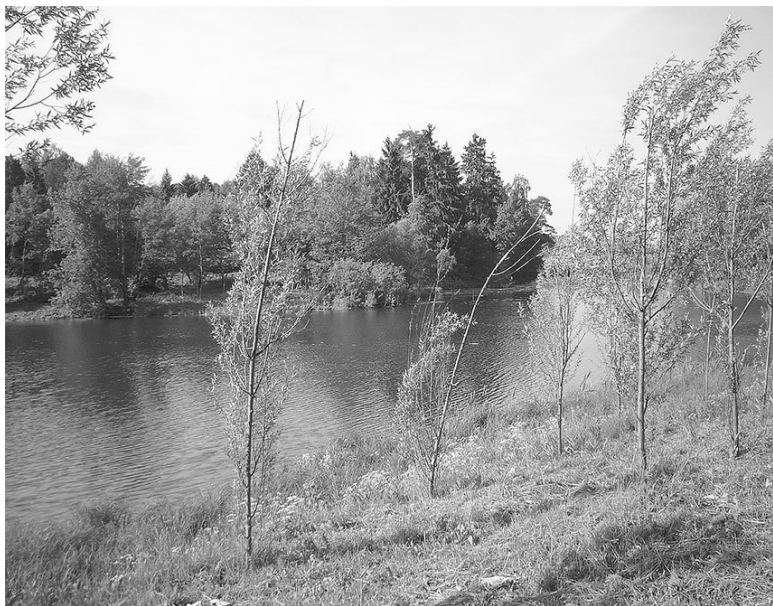
Пруд в Захарове.

«Зерцало вод» представляло собой пруд, образованный благодаря плотине на речке Захаровке. Около воды некогда стояла огромная липа и около нее – полукруглая скамейка. Это и было любимым местом Пушкина-мальчика. Здесь, среди обаятельной подмосковной природы, в деревенской тиши, впервые проявился его могучий гений. Говорят, что березы, окружавшие старую липу, все были исписаны стихами юного поэта...»