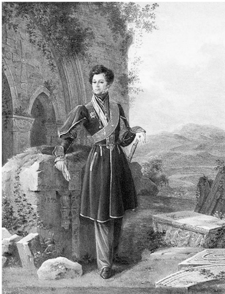
Портрет Павла Кутайсова. Художник Г. Чернецов