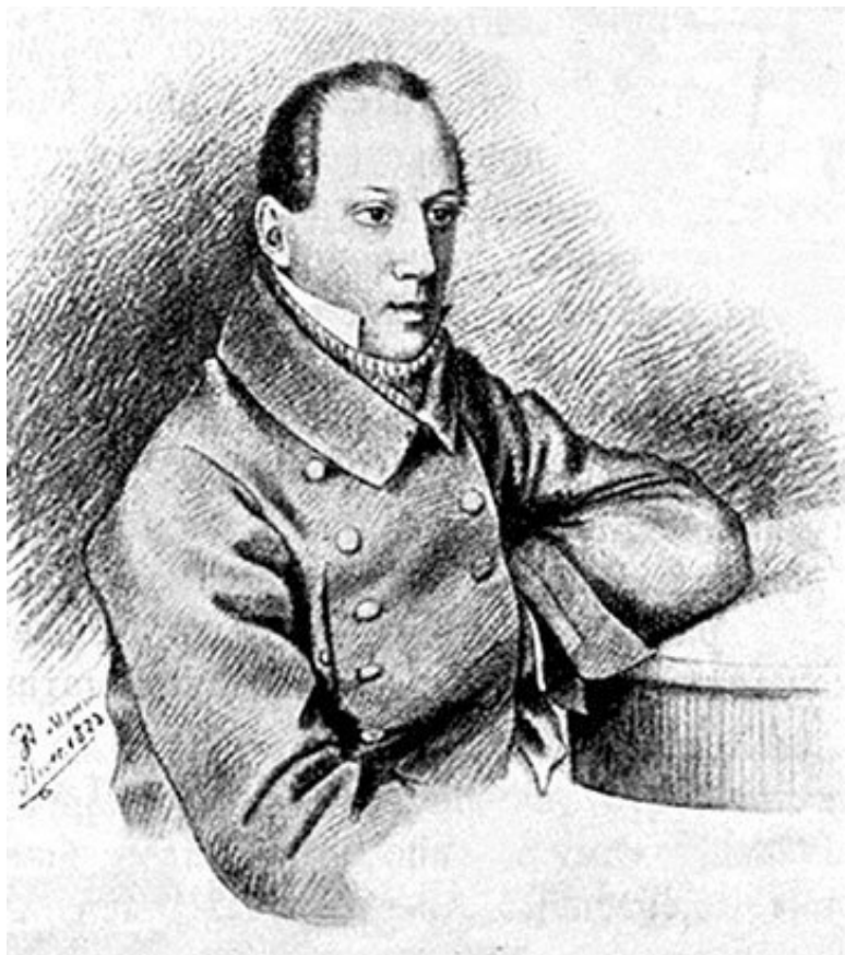
Петр Яковлевич Чаадаев. 1823 г.

Писатель-литературовед В. В. Вересаев (1867–1945), работавший неподалеку от Александровки в поселке Николина