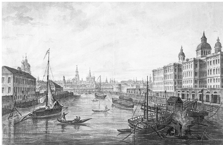
Воспитательный дом. 1800-е гг. Рисунок Ф. Алексеева

тей сообщения графа Петра Андреевича Клейнмихеля А. И. Дельвига перевели в Москву и назначили директором московских водопроводов. Кроме того, Дельвиг находился в должности председателя архитектурного совета Комиссии по постройке храма Христа Спасителя, с 1852 по 1861 год.