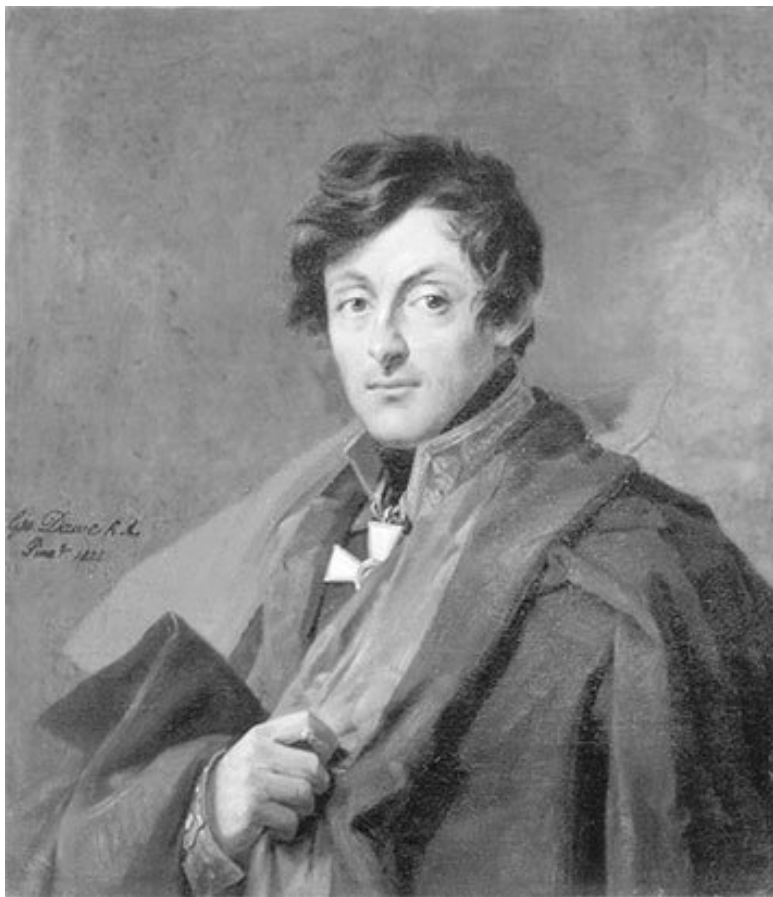
Александр Иванович Остерман-Толстой. 1825 г. Художник Дж. Доу

Затем хозяевами Александровки стали князя Голицыны