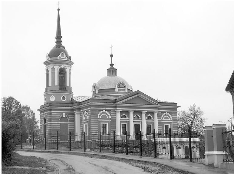
Церковь Рождества Христова.

Интересный факт: эти места были излюбленными для великого русского композитора Александра Порфирьевича Бородина (1833–1887). В 1884 году А. П. Бородин жил и работал на даче в Павловской Слободе и в письмах своих отсюда искренне восхищался природой здешних мест. Сохранилось его письмо от 25 августа 1884 года, в котором композитор не скрывает своего удовольствия: «Местность восхитительная, хорошее купанье, прогулки чудесные и разнообразные».