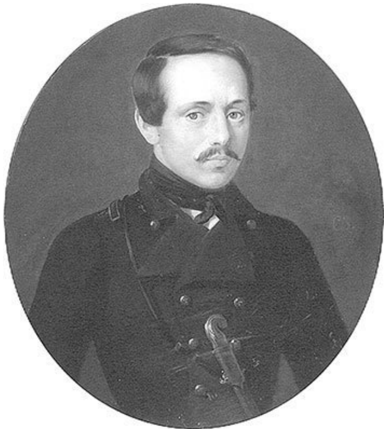
М. Ю. Лермонтов в штатском сюртуке. Художник П. Е. Заболотский

М. Ю. Лермонтов (1814–1841) нисколько не преувели-