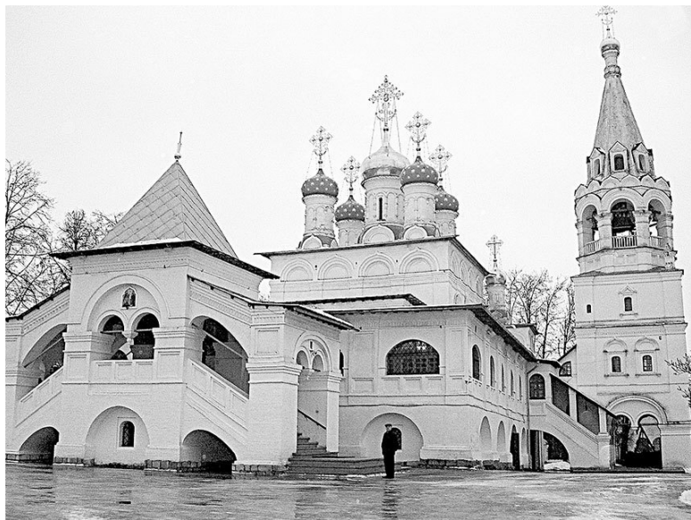
Павловская слобода. Церковь Благовещения Пресвятой Богородицы, перестроена в XIX в. 1662 г.

водского мостика», при впадении речки Рудинки в реку Белянку, в конце XVIII – начале XIX века был расположен хрустальный завод князя Н. Б. Юсупова. Хрустальный завод сильно пострадал в Отечественной войне 1812 года и впоследствии не восстанавливался. В 1935 году Истринский музей провел здесь полномасштабное обследование и раскопки. Обнаруженные слитки и осколки стекла несли на себе юсуповские клейма.