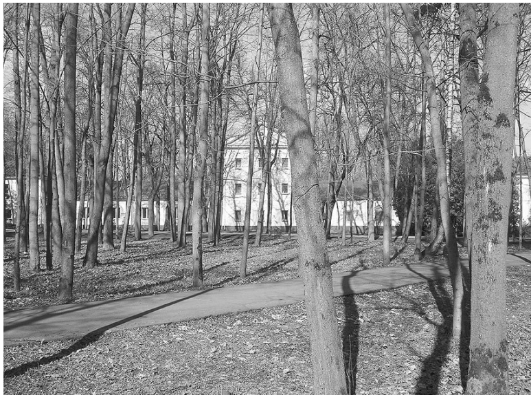
Парк в Ильинском. Флигель.

Рощу затем превратили в усадебный парк. И теперь этот парк сохраняет свою первозданную прелесть, а под прямым углом к Москве-реке его пересекает живописный овраг, именуемый Елизаветинской долиной. Название – в честь жены графа Елизаветы Александровны. Здесь же уцелел Елизаветинский павильон – беседка-ротонда из восьми тосканских колонн начала XIX века. В беседке графиня любила отдыхать. Сам же граф А. И. Остерман-Толстой зачастую и надолго выезжал за границу, и тогда помещения и в Ильинском, и