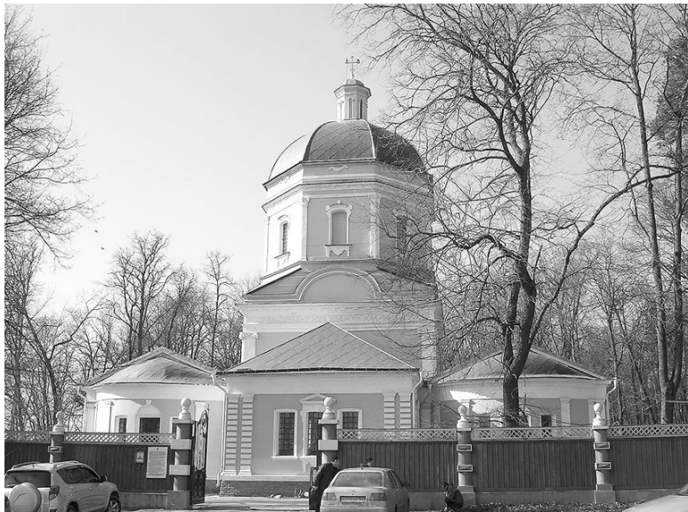
Ильинский храм.