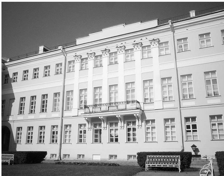
Дом Пушкина на Мойке.