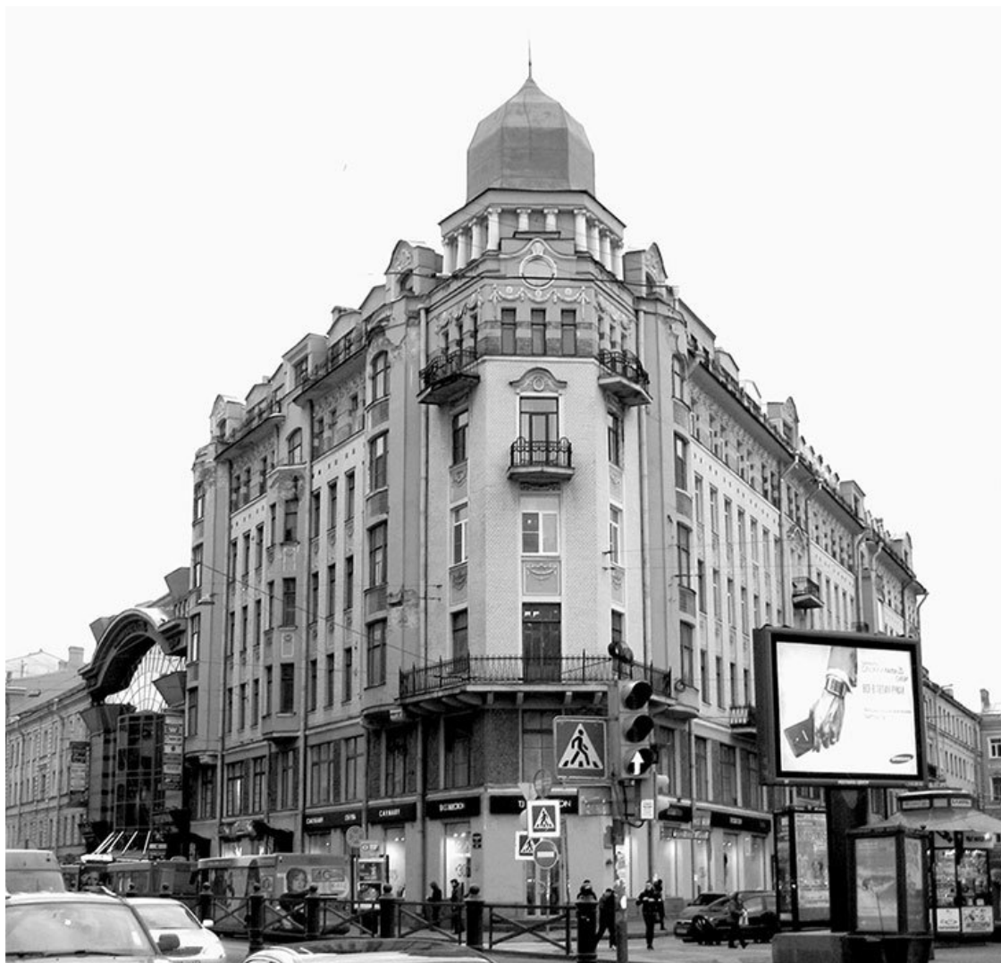
Московский проспект, 1. Фото 2013 г.

В. Д. Лермонтов (1845–1909) – литератор (печатался под псевдонимом Озерков ), автор романа «Неслужащий дворянин». В соавторстве с В. Н. Соколовым ( Колосовым ) опубликовал «Очерк истории ребуса» (СПб., 1885).