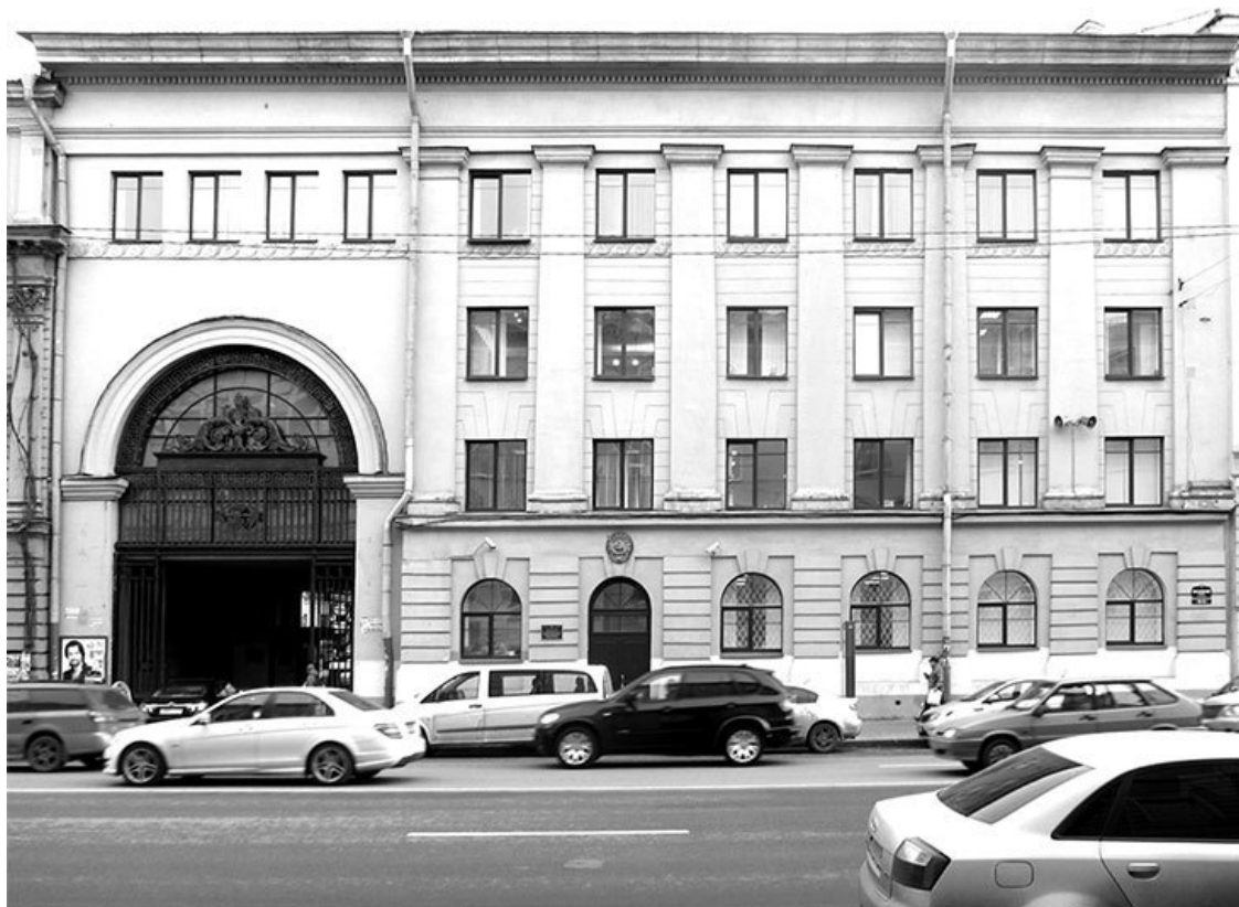
Московский проспект, 10–12, правая часть. Фото 2013 г.