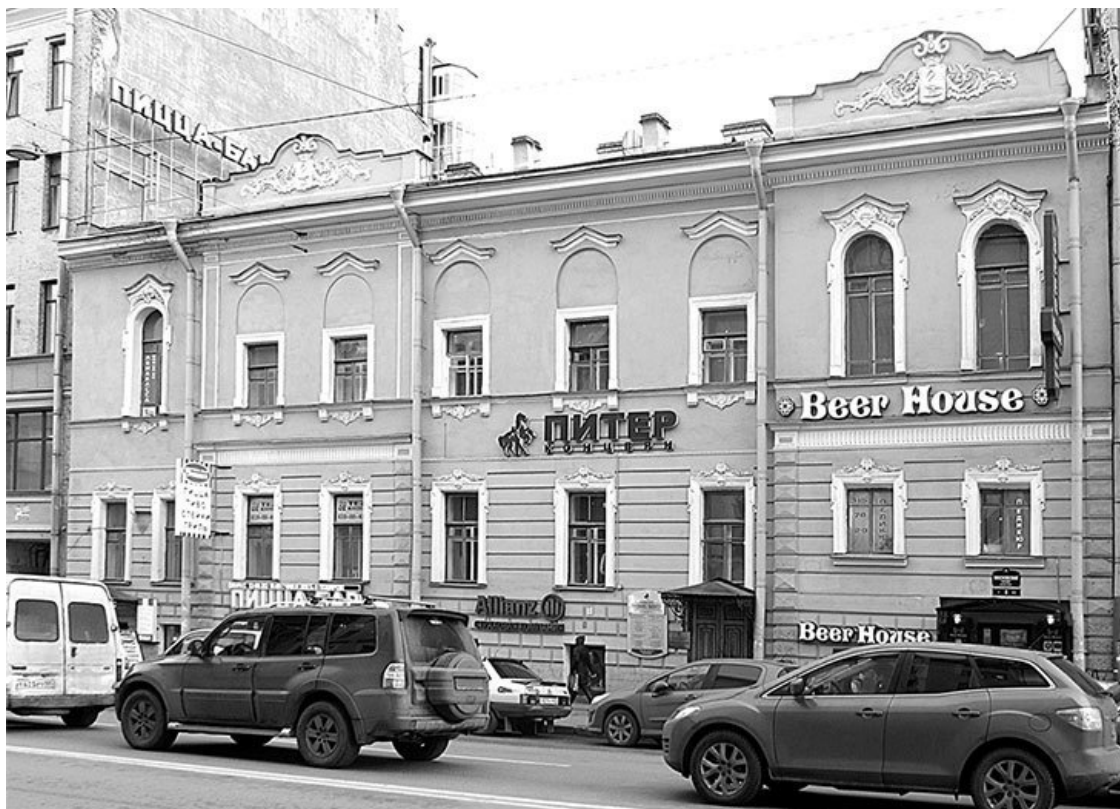
Московский проспект, 8. Фото 2013 г.