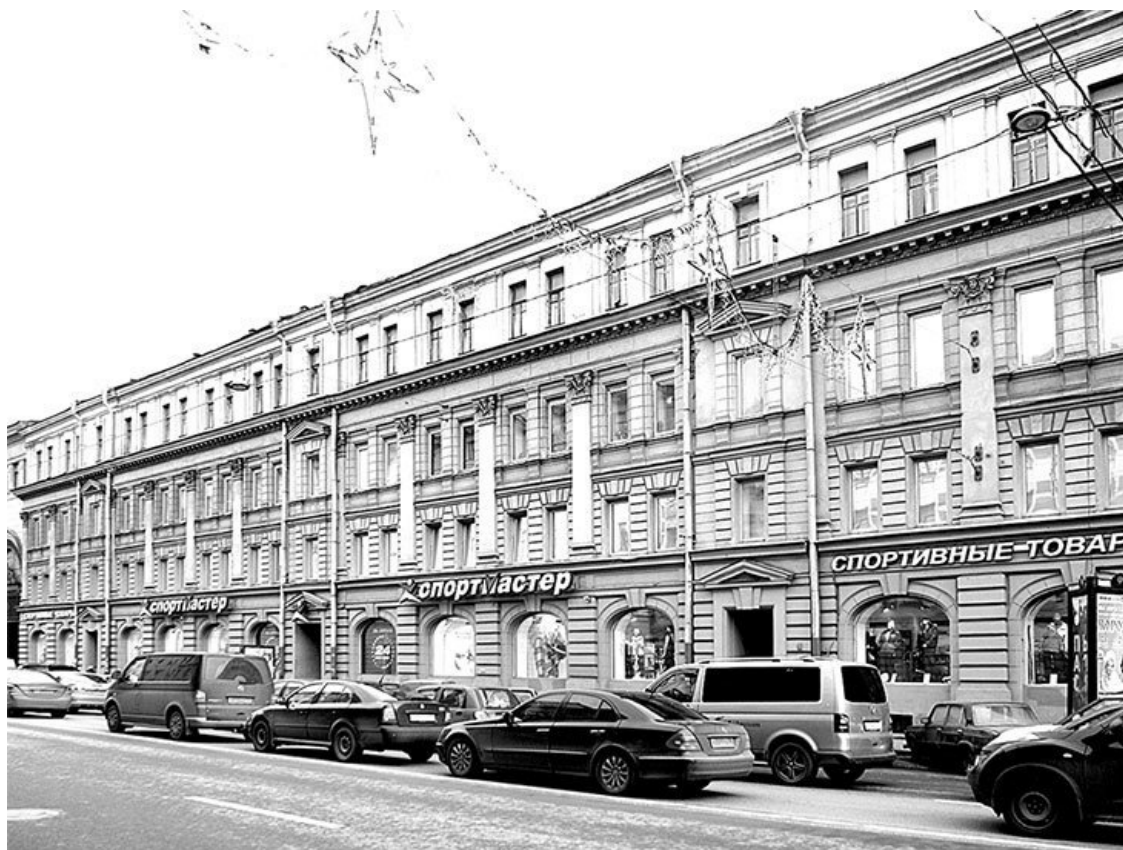
Московский проспект, 10–12, центральная часть. Фото 2013 г.