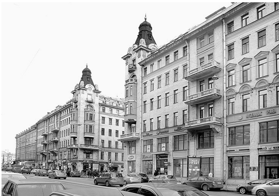
Московский проспект, 4, 6. Фото 2013 г.

Сегодня с трудом можно представить размеры этой городской трущобы. В немыслимом лабиринте домов, бараков, сооружений иной пришелец не отважился появиться не только в вечерние часы, но и днем. В «лавре» были бани, рынок подержанных вещей, трактир, где Достоевский «устроил» встречу Раскольникова со Свидригайловым: Раскольников «находился на – ском проспекте, шагах в тридцати или в сорока от Сенной, которую прошел. Весь второй этаж дома налево был занят трактиром. Все окна были отворены настежь, трактир, судя по двигавшимся фигурам в окнах, был набит битком. В зале разливались песенники, звенели кларнет, скрипка и гремел турецкий барабан. Слышны были женские взвизги. Он было хотел пойти назад, недоумевая, зачем он повернул на – ский проспект, как вдруг, в одном из крайних отворенных окон трактира, увидел сидевшего у самого окна, за чайным столом, с трубкою в зубах, Свидригайлова» («Преступление и наказание», гл. 3).