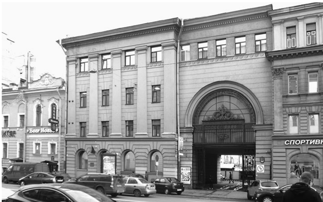
Московский проспект, 10–12, левая часть. Фото 2013 г.

Комплекс зданий торговцев Рыбного рынка состоял из протяженной центральной и двух одинаковых боковых трехэтажных секций, построенных в архитектурном стиле неоклассики (позже все секции надстроены четвертым этажом). Нижний торговый этаж всех секций выделен рустовкой и полуциркульными оконными проемами, одиночными в боковых и сдвоенными в центральной секции. Прямоугольные оконные проемы верхних этажей разделены плоскими пилястрами коринфского ордера (на крайних секциях капители упрощены при надстройке здания). Входы в торговые помещения центральной секции и окно третьего этажа над ними украшены треугольными сандриками. Впечатляют арочные въезды во двор, расположенные между центральной и боковыми секциями, украшенные решетками художественного литья.