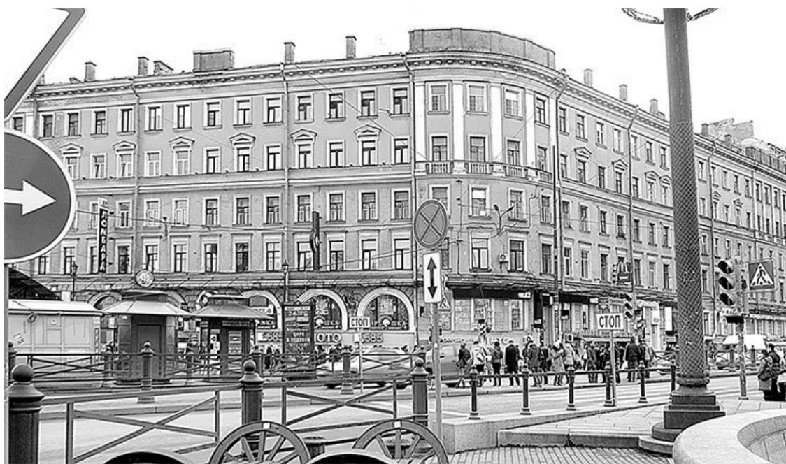
Московский проспект, 2 / Сенная площадь, 6. Фото 2013 г.

После смерти С. Я. Яковлева его наследники разделили территорию на участки для раздельной продажи. Участки от Сенной пл. по Саркосельской перспективе стали собственностью Агафоклеи Марковны Сухаревой (1776–1840), дочери директора Певческой капеллы М. Ф. Полторацкого. Муж ее, Александр Дмитриевич Сухарев, был видный государственный чиновник, тайный советник, а сама она – весьма серьезная и уважаемая общественная деятельница, благотворительница, председательница Женского попечительного совета о тюрьмах, Петербургского женского патриотического общества. Во владениях Сухаревой находились значительные по площади участки на р. Охте, она была полновластной хозяйкой и на Уткиной даче, подаренной ее отцу, постоянно жившему в Тверской губ.