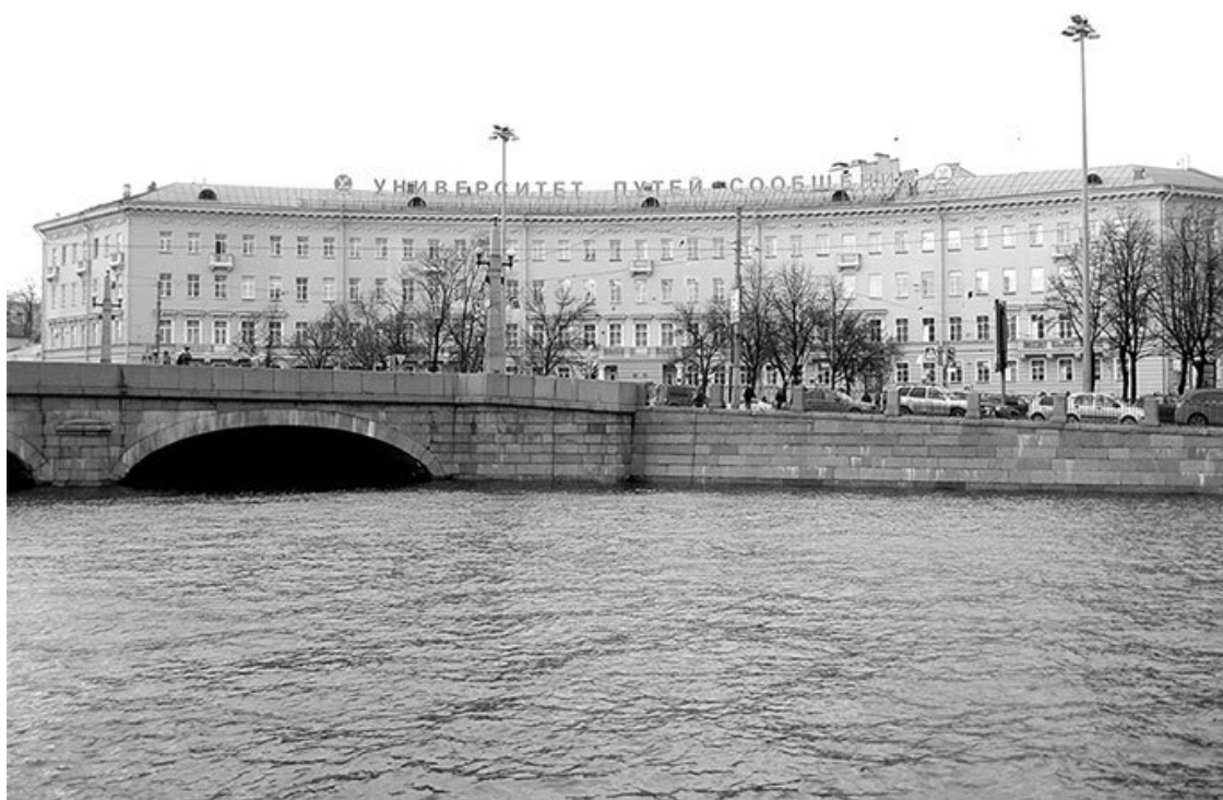
Московский проспект, 13–15. Фото 2013 г.