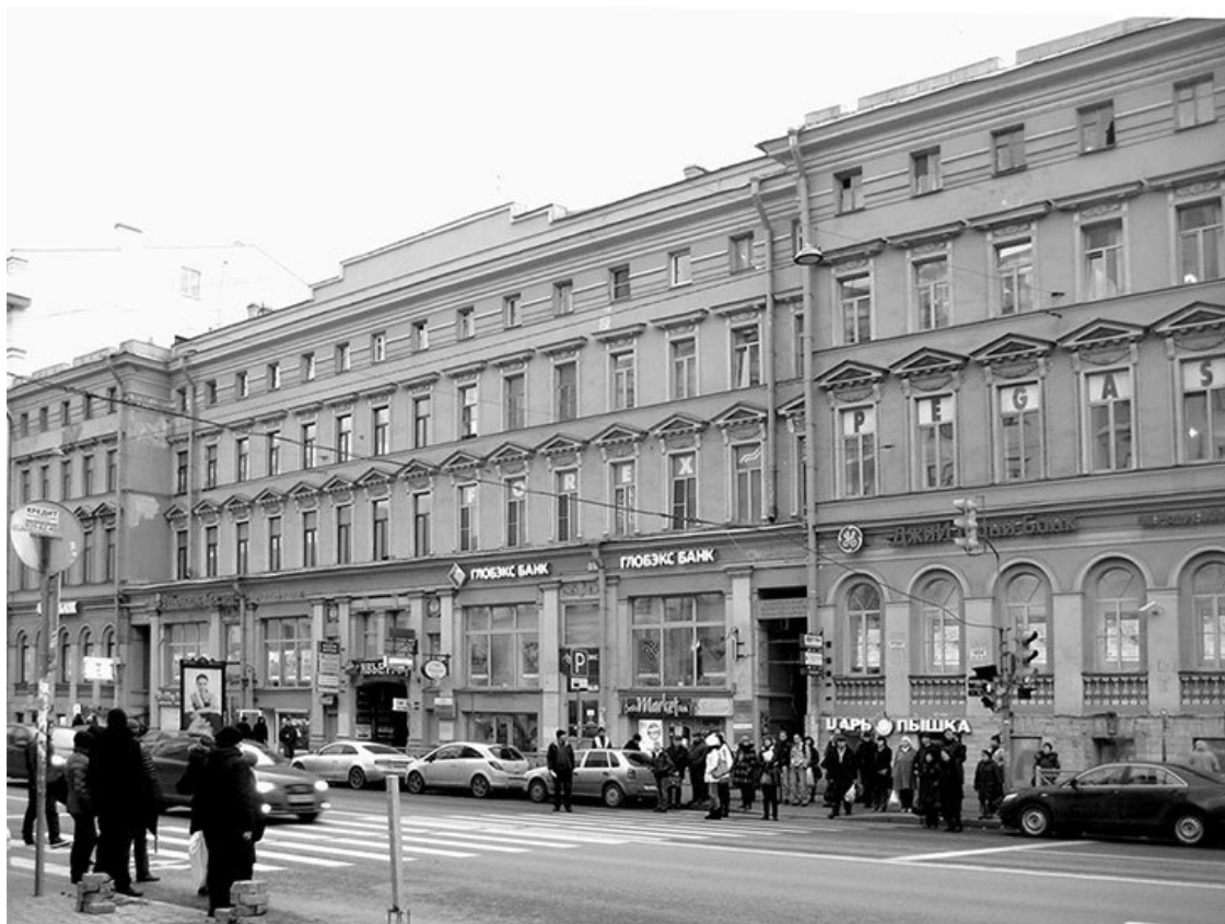
Московский проспект, 7. Фото 2013 г.

Шольц первым из врачей осматривал А. С. Пушкина после его смертельного ранения и составил записку о болезни и смерти поэта 27 . «В. Б. Шольц после осмотра раны и перевязки имел беседу с раненым наедине. Александр Сергеевич спросил: „Скажите мне откровенно, как вы рану находили?“, на что Шольц ответил: „Не могу вам скрывать, что рана ваша опасная“. На следующий вопрос Пушкина, смертельна ли рана, Шольц отвечал прямо: „Считаю долгом вам это не скрывать, но услышим мнение Арендта и Саломона, за которыми послано“. Пушкин произнес: „Благодарю вас, что вы сказали мне правду как честный человек... Теперь займусь делами моими“» 28 .