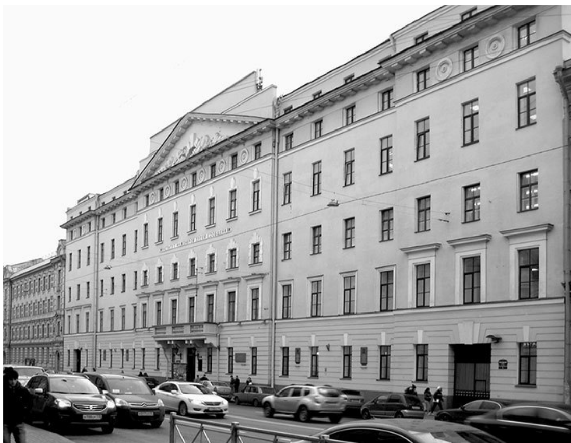
Московский проспект, 9. Фото 2013 г.

Первое из зданий, специально построенных для Института Корпуса инженеров путей сообщения, возведено на Обуховском проспекте в 1823 г. архитектором А. Д. Готманом.