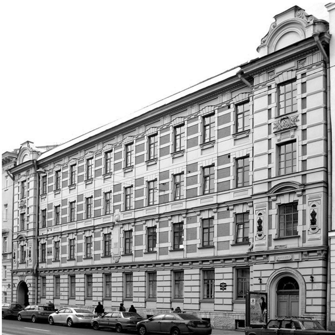
Московский проспект, 11. Фото 2013 г.

«Табачная» история бывшего участка Жукова на Обуховском, теперь уже Забалканском, проспекте связана с именем другого табачного фабриканта.