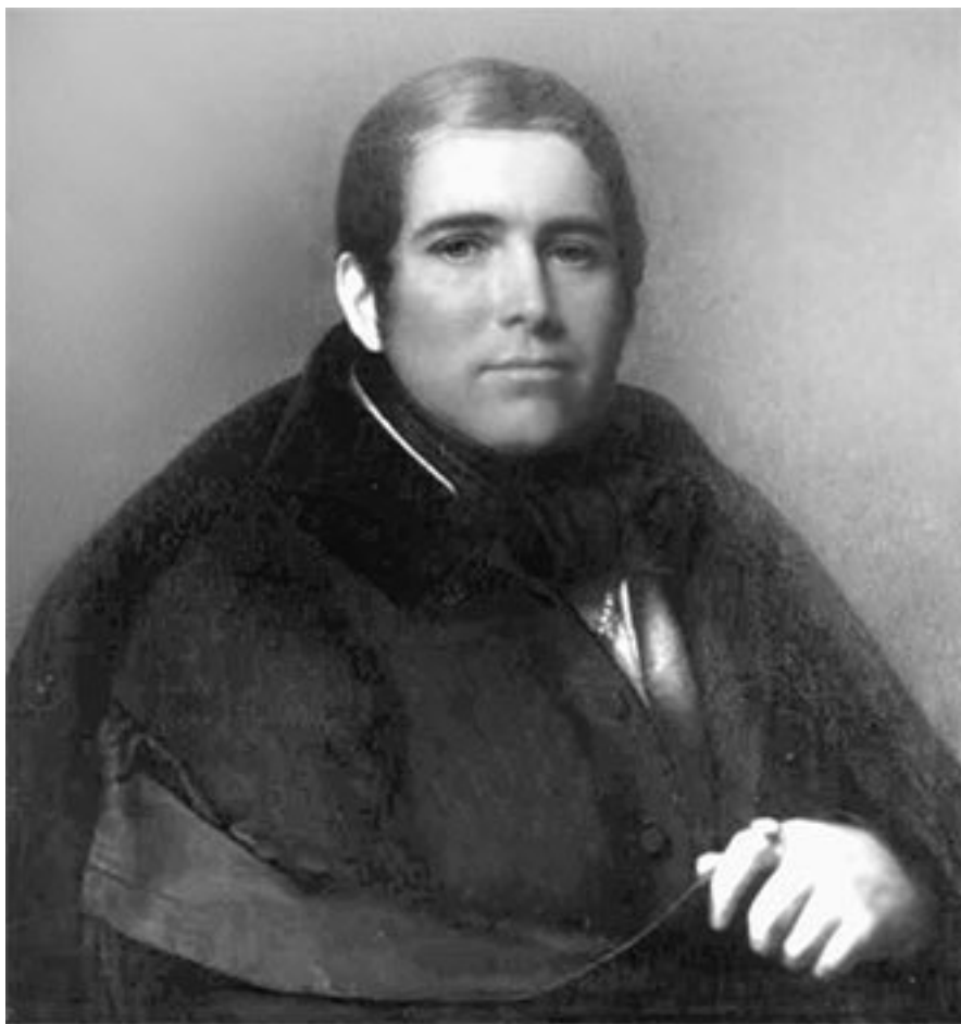
П. А. Плетнев

Учитель русского языка и литературы (1814–1829 гг.), инспектор классов (1829–1839 гг.) в различных гимназиях и училищах. С 1828 г. преподавал литературу наследнику престола, будущему императору Александру II, и великим князям. В 1832 г. занял кафедру русской словесности в Санкт-Петербургском университете, в котором с 1840 до 1861 г. состоял ректором. Профессор русской словесности (1832–1849 гг.), академик Петербургской АН (1841 г.). Член Вольного общества любителей российской словесности (1819 г.), сотрудник альманаха «Северные цветы». Один из ведущих критиков пушкинского круга в 1820-х гг. В память А. А. Дельвига устраивал у себя литературные среды. Принимал большое участие в издательских делах А. С. Пушкина (ему посвящен роман «Евгений Онегин») и Н. В. Гоголя. Издатель «Современника» (1838–1846 гг.) и пушкинских рукописей, тайный советник (1856 г.) 106 . Похоронен П. А. Плетнев на Тихвинском кладбище Александро-Невской лавры.