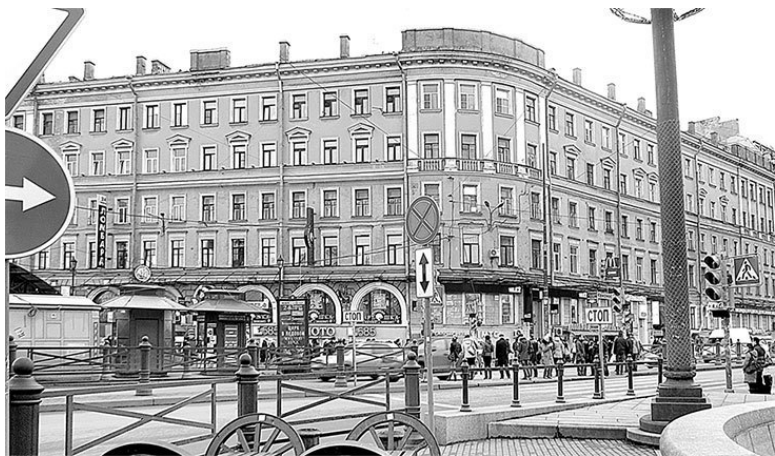
Московский проспект, 2 / Сенная площадь, 6. Фото 2013 г.