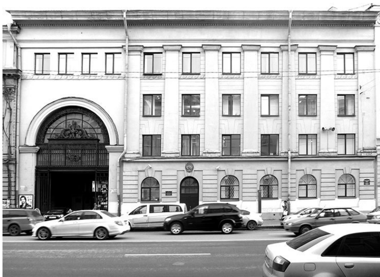
Московский проспект, 10–12, правая часть. Фото 2013 г.