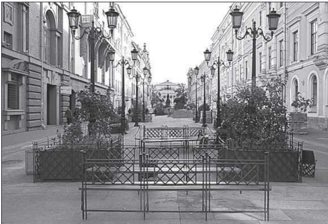
Малая Садовая улица

Названия по природным объектам – это, наверно, исторически самый первый вид топонимов. Что может быть естественней: если улица идет вдоль реки, назвать ее Речной , Береговой или Набережной , вдоль поля – Полевой , вдоль леса – Лесной . И чуть не в каждой слободе или селении, вошедшем в состав Петербурга, такие имена были. Как с ними ни боролись, как ни переименовывали улицы, чтобы не было одинаковых названий, все равно их осталось довольно много.