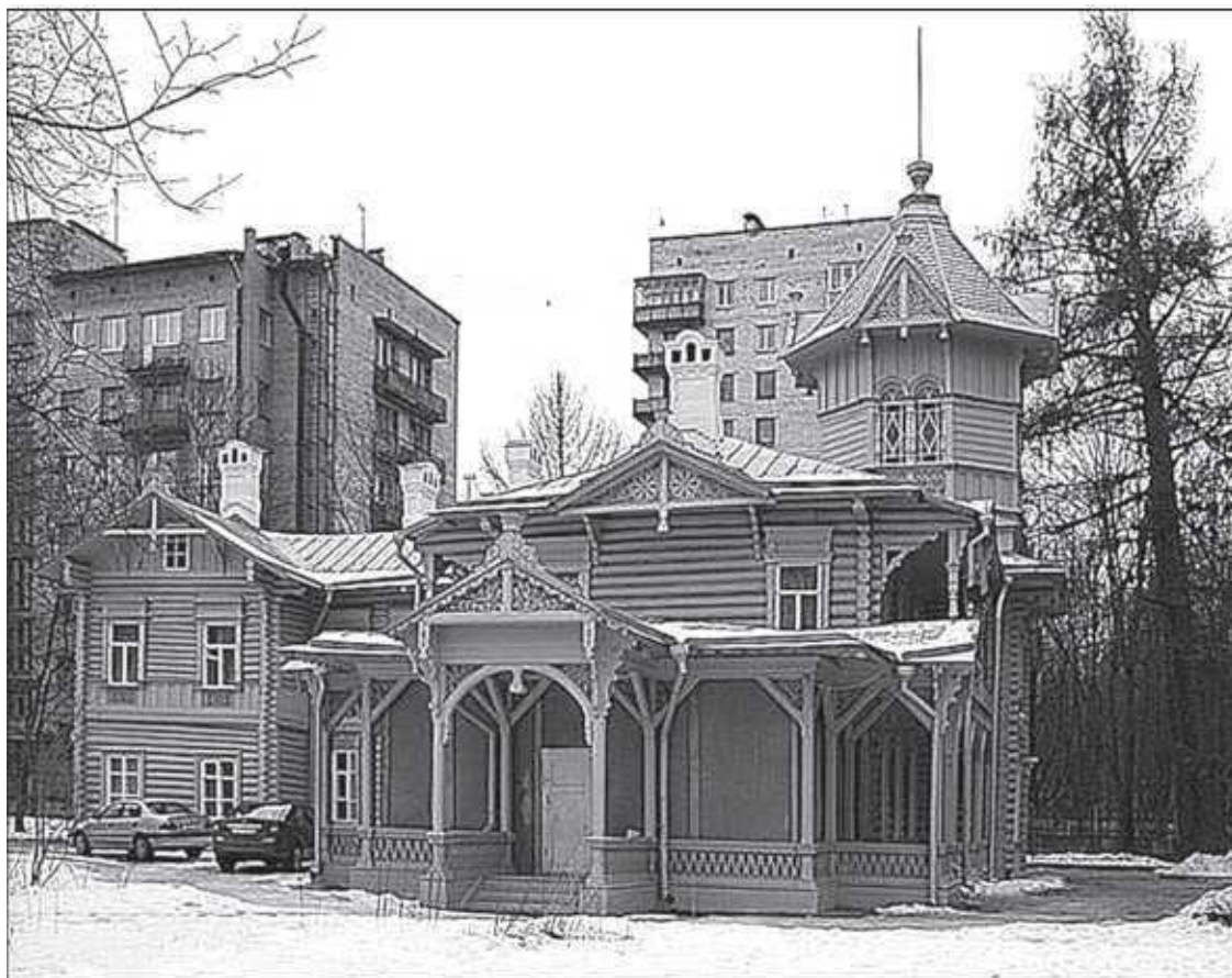
Болотная ул., 13

Этот особняк, построенный в начале XX века, принадлежал жене германского подданного Бертлинга, занимавшегося производством минеральных, растительных и смазочных масел. Дом использовался как дача. В 1914-м, сразу после начала войны с Германией, хозяева покинули Петроград. Дача пустовала до февраля 1917-го, когда сюда пришли новые хозяева – Выборгский Совет рабочих и солдатских депутатов.