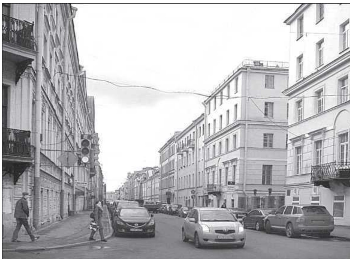
Большая Подьяческая улица

Большая Подьяческая была изначально Морской Мастерской, поскольку по плану здесь предполагалось построить дома для мастеровых людей Адмиралтейской верфи, а Средняя получила название Приказной Адмиралтейской по находившемуся поблизости Приказу Адмиралтейской верфи. Однако, по-видимому, эти наименования не употреблялись, а первыми реальными названиями стали 1-я и 2-я Подьяческие, к которым в первый год царствования Павла I прибавилась и 3-я Подьяческая. Она, правда, дважды примеряла на себя другие названия. В 1798 году стала Наличной, поскольку являлась ближайшей, лицевой к Екатерининскому каналу, а с 1804 года называлась Банным переулком по баням, находившимся на территории дома № 1, там, где сейчас располагается детский садик.