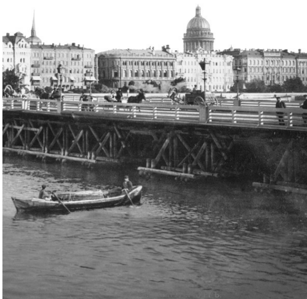
Петербургские улицы, набережные, площади от аннинских указов до постановлений губернатора Полтавченко