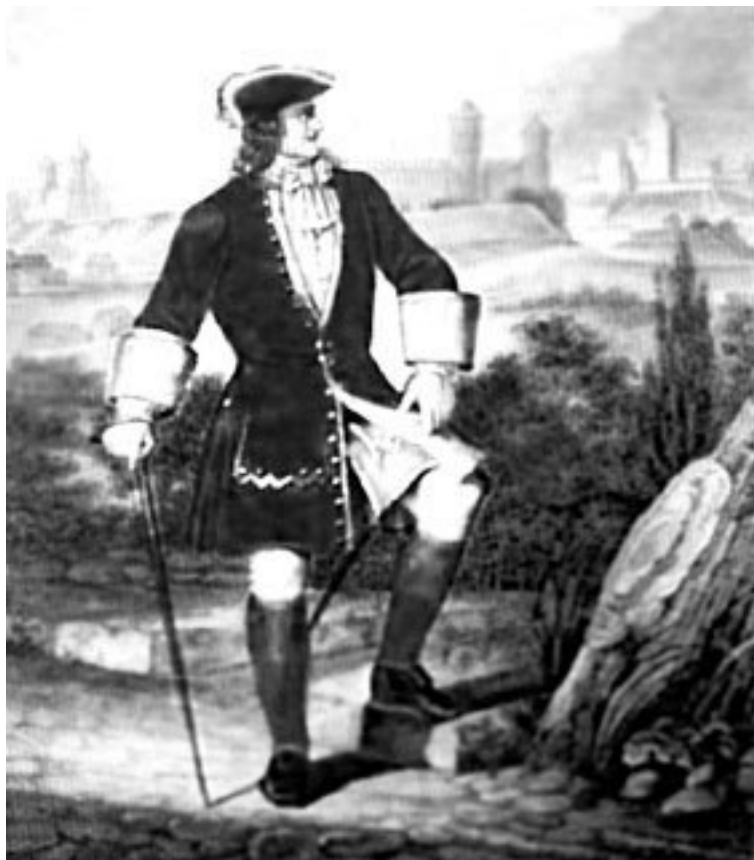
Офицер-семеновец в мундире петровских времен

В кампанию 1813 г. участвовал в сражениях при Лютцене, Баутцене, Кульме и Лейпциге, в кампанию 1814 г. дошел до Парижа.