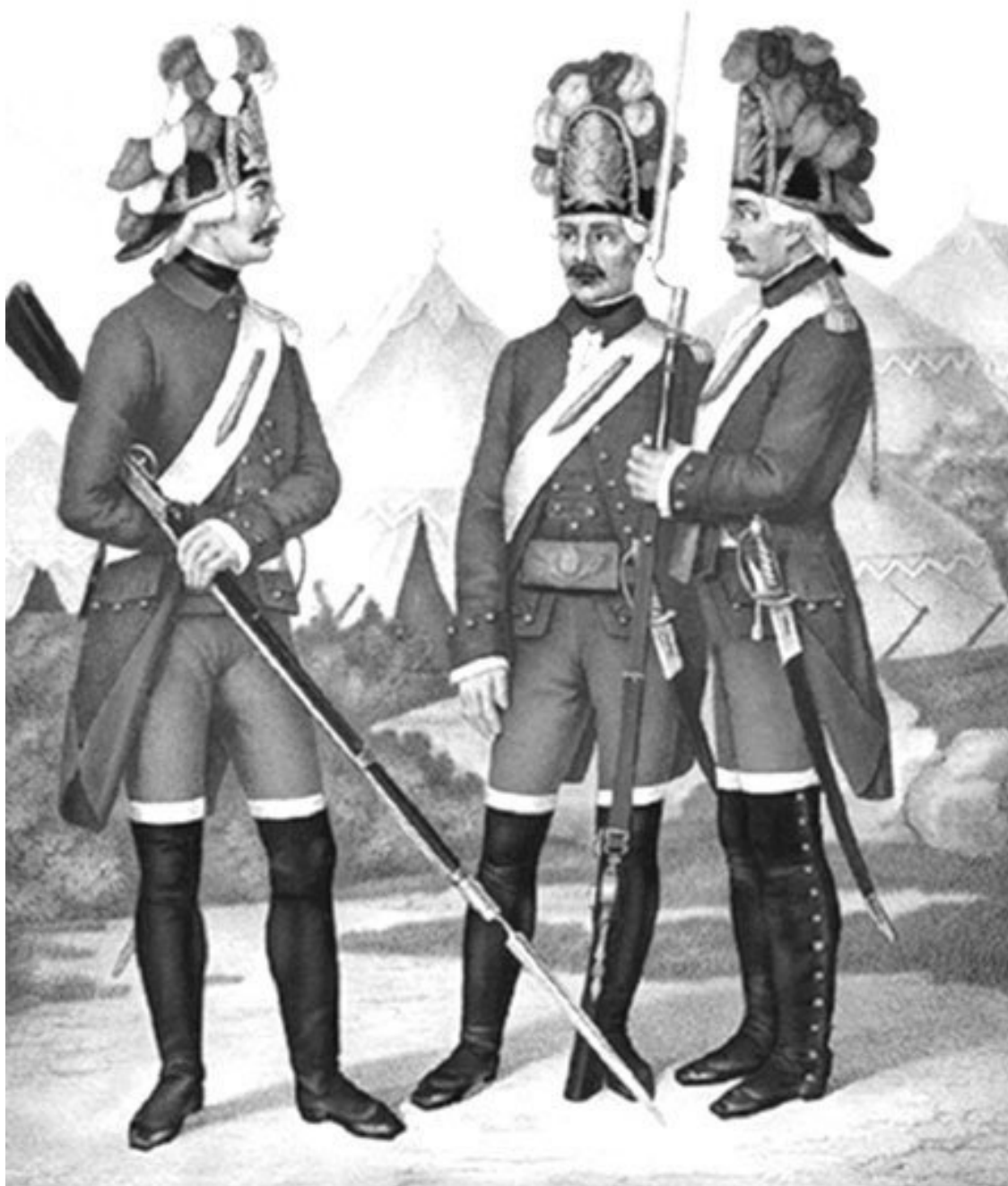
Гренадеры полков лейб-гвардии: Преображенского, Семеновского, Измайловского с 1763–1786 гг.

По старшинству – третий пехотный полк Императорской гвардии. Обязан своим учреждением императрице Анне Иоанновне, которая преображенцев и семеновцев не без основания опасалась и хотела иметь надежную личную гвардию.