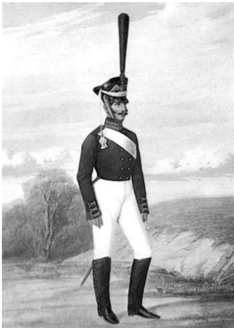
Рядовой семеновец, 1812 г.

В лейб-гвардии Семеновском полку служили многие снискавшие впоследствии всенародную и даже всемирную славу люди: поэт Баратынский, философ Чаадаев, декабристы Бестужев-Рюмин, Муравьев-Апостол, маршал Тухачевский, дипломат Чичерин, но самым знаменитым русским военачальником, начинавшим службу в старейшем гвардейском пехотном полку, был Александр Васильевич Суворов.