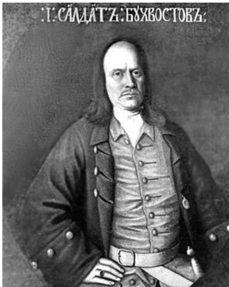
С. Л. Бухвостов

Петр I высоко ценил заслуги Бухвостова и для увековечения его образа в 1721 г. заказал Карлу Растрелли бронзовый бюст «Первого российского солдата». Это был не только первый скульптурный памятник, но и первый прижизненный памятник в России. К сожалению, скульптура не сохранилась, но в свое время именно с этого бюста портрет Бухвостова нарисовал и отгравировал петербургский художник Михаил Махаев. Нынешний памятник работы В. М. Клыкова сделан по гравюре М. И. Махаева. Имя Бухвостовых (1-я, 2-я и 3-я Бухвостовы улицы – название в старомосковской притяжательной форме (чьи – Бухвостовы, а не кого – Бухвостова) дано Комиссией Сытина в 1922 г.) носят три улицы Москвы, расположенные в Преображенском.