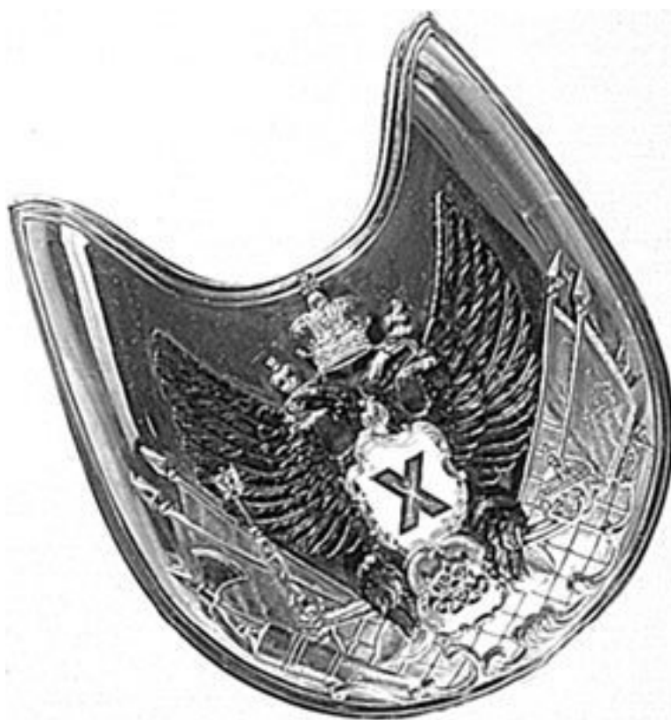
Горжет (нагрудный знак) офицера лейб-гвардии Измайловского полка об. 1912 г.

26 августа (7 сентября) 1812 г. полк участвовал в Бородинском сражении. «Полк под убийственным огнем неприятельских батарей, сменяемым решительными атаками отборной кавалерии, не дрогнул и, хваля Бога, не дав восторжествовать врагу, покрыл себя бессмертной славой». Безвозвратные потери полка, убито: 4 офицера; 176 нижних чинов, без вести пропавших 73. Ранено: командир полка, 13 офицеров, 528 нижних чинов.