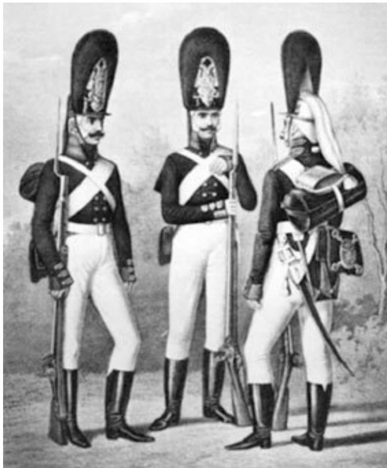
Рядовые полков лейб-гвардии Преображенского, Семеновского, Измайловского. 1802–1805 гг.

льевич Непейцын (1771–1848), потерявший ногу еще под Очаковым и воевавший на «искусственной» ноге конструкции знаменитого механика Кулибина.