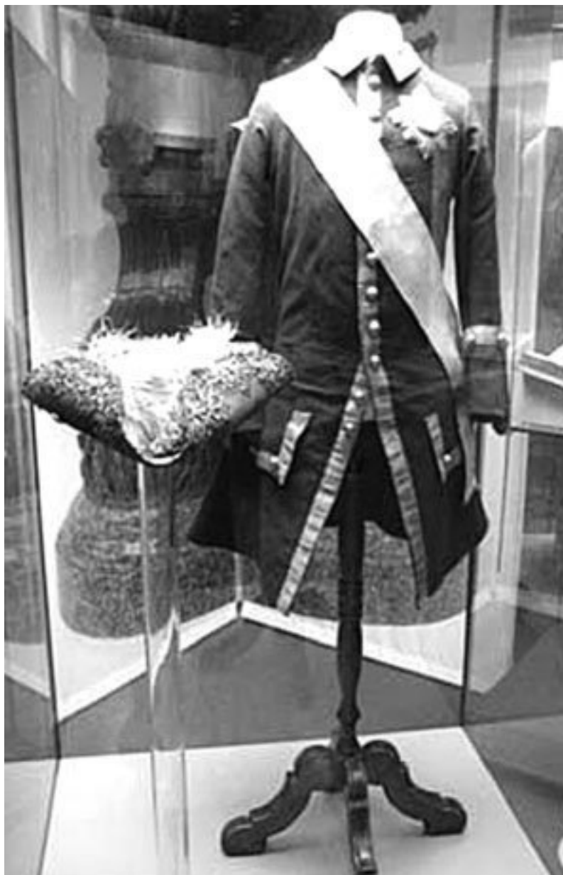
Мундир Семеновского полка, принадлежавший Петру I

В 1798–1800 гг. по Загородному проспекту и прилегающим улицам построили каменные казармы (арх. Ф. И. Волков, Ф. И. Демерцов). Казармы неоднократно перестраивались на протяжении XIX – начала XX вв., но некоторые корпуса, хотя и в измененном виде, существуют и в наши дни (например, офицерский дом, расположенный по адресу Загородный пр., 54). По общему плану, разработанному Ф. И. Волковым и Ф. И. Демерцовым, все военные здания образовывали компактное каре вокруг плац-парада.