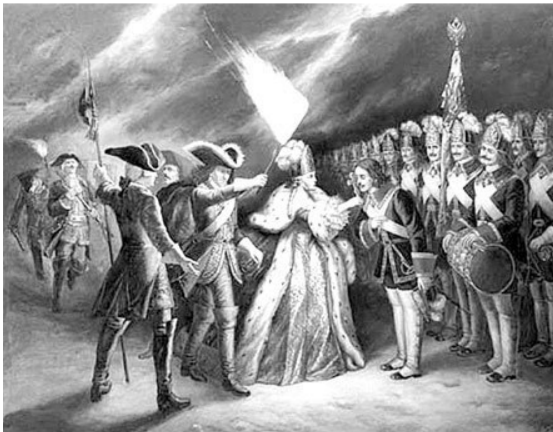
Присяга Преображенского полка Елизавете Петровне

после кончины Петра Великого 28 января 1725 г. Екатерины Алексеевны. После нее во главе государства в продолжение XVIII в. еще четырежды оказывались женщины. Женское правление в России подошло к концу только в 1796 г.