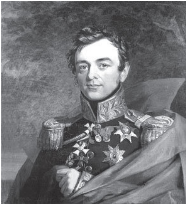
И. Ф. Паскевич

Голенищев-Кутузов-Смоленский, М. Б. Барклай-де-Толли, И. И. Дибич-Забалканский и И. Ф. Паскевич-Эриванский-Варшавский.