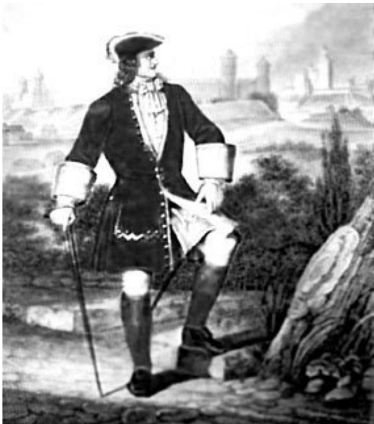
Офицер-семеновец в мундире петровских времен

В кампанию 1813, 1814 гг. в боевых действиях полка принимал участие уникальный офицер – Георгиевский кавалер