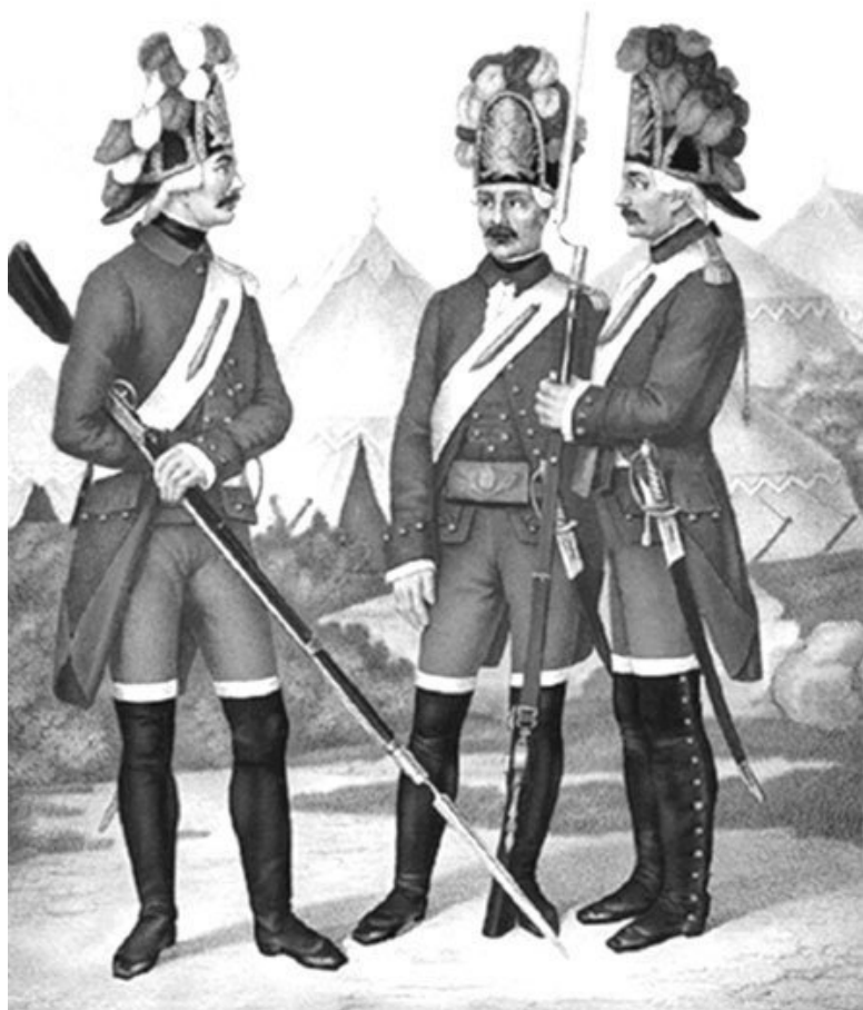
Гренадеры полков лейб-гвардии: Преображенского, Семёновского, Измайловского с 1763–1786 гг.