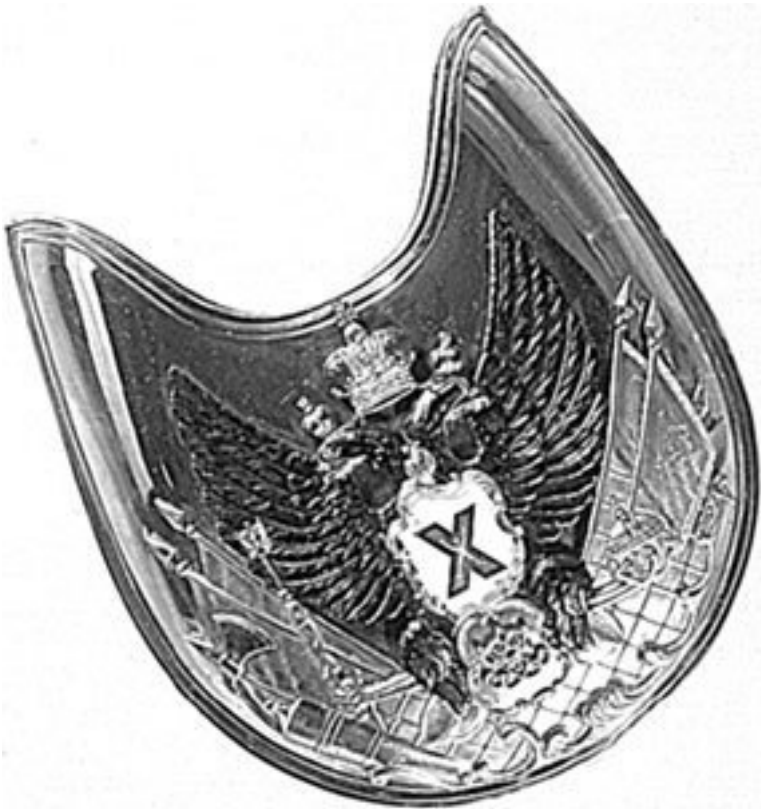
Горжет (нагрудный знак) офицера лейб-гвардии Измайловского полка об. 1912 г.

12 апреля 1877 г. Россия объявила войну Турции. 22 июля гвардия получила приказ выступить в поход. После молебна у Троицкого собора лейб-гвардии Измайловский полк по