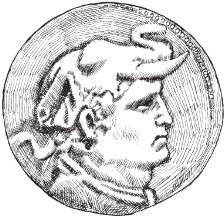
Деметрий в индийском головном уборе с изображением слона

Около середины III в. до н. э. ряд греческих колоний в Азии, входивших в империю Александра Македонского, а позже Селевка Никитора, одно за другим начали объявлять о своем выходе из империи. Одним из таких новых государств стало Греко-Бактрийское царство. Во II в. до н. э. в Индию