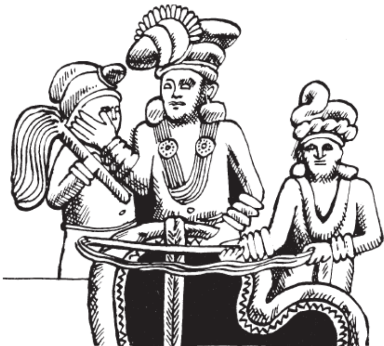
Ашока, царь из династии Маурьев

Из них мы узнаем, что спустя восемь лет после восхождения на престол Ашока и завоевал государство Калинга, расположенное на берегу Бенгальского залива, что повлекло за собой огромные человеческие жертвы и сопровождалось