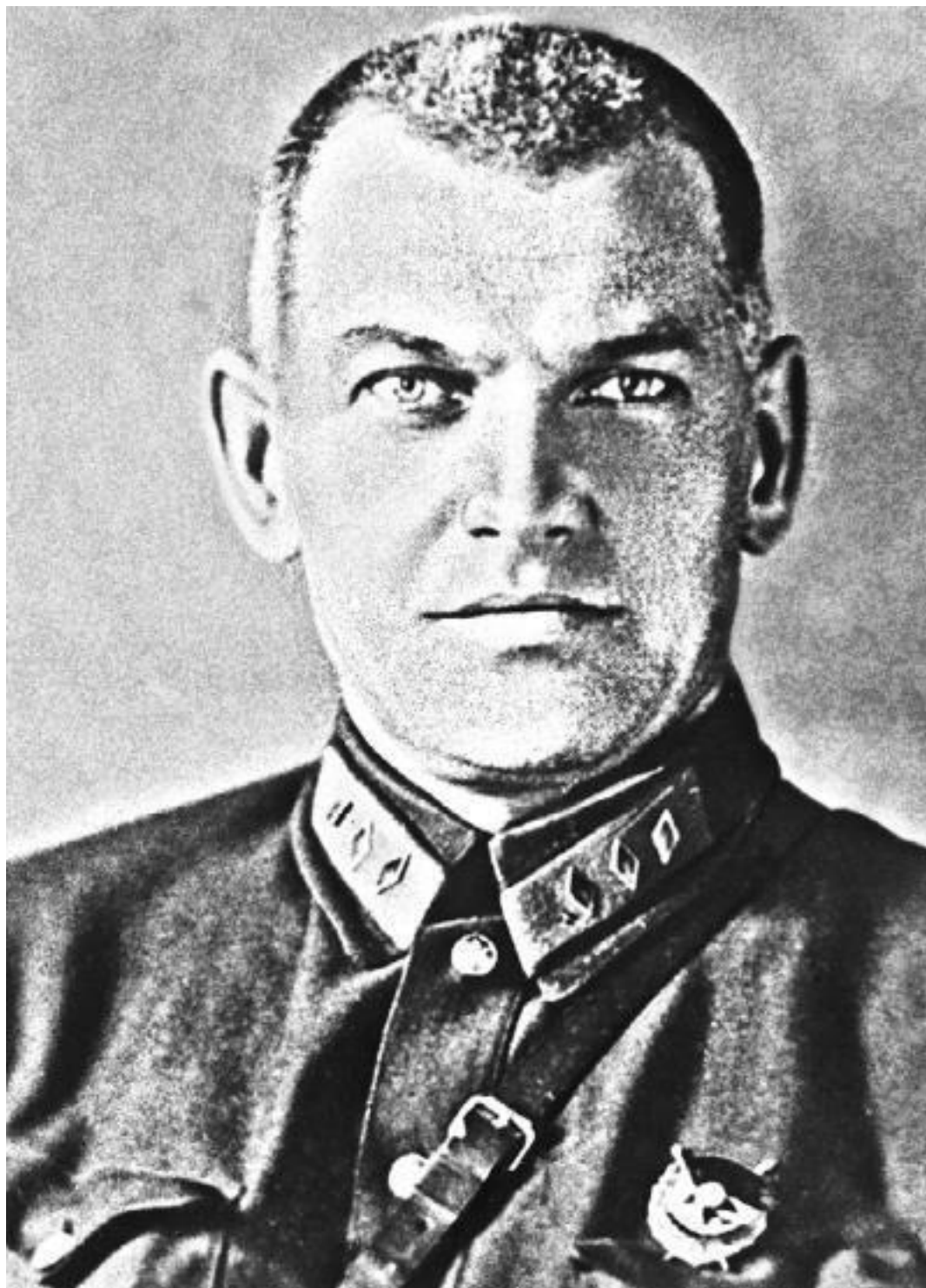
Ян Карлович Берзин (1889–1938)