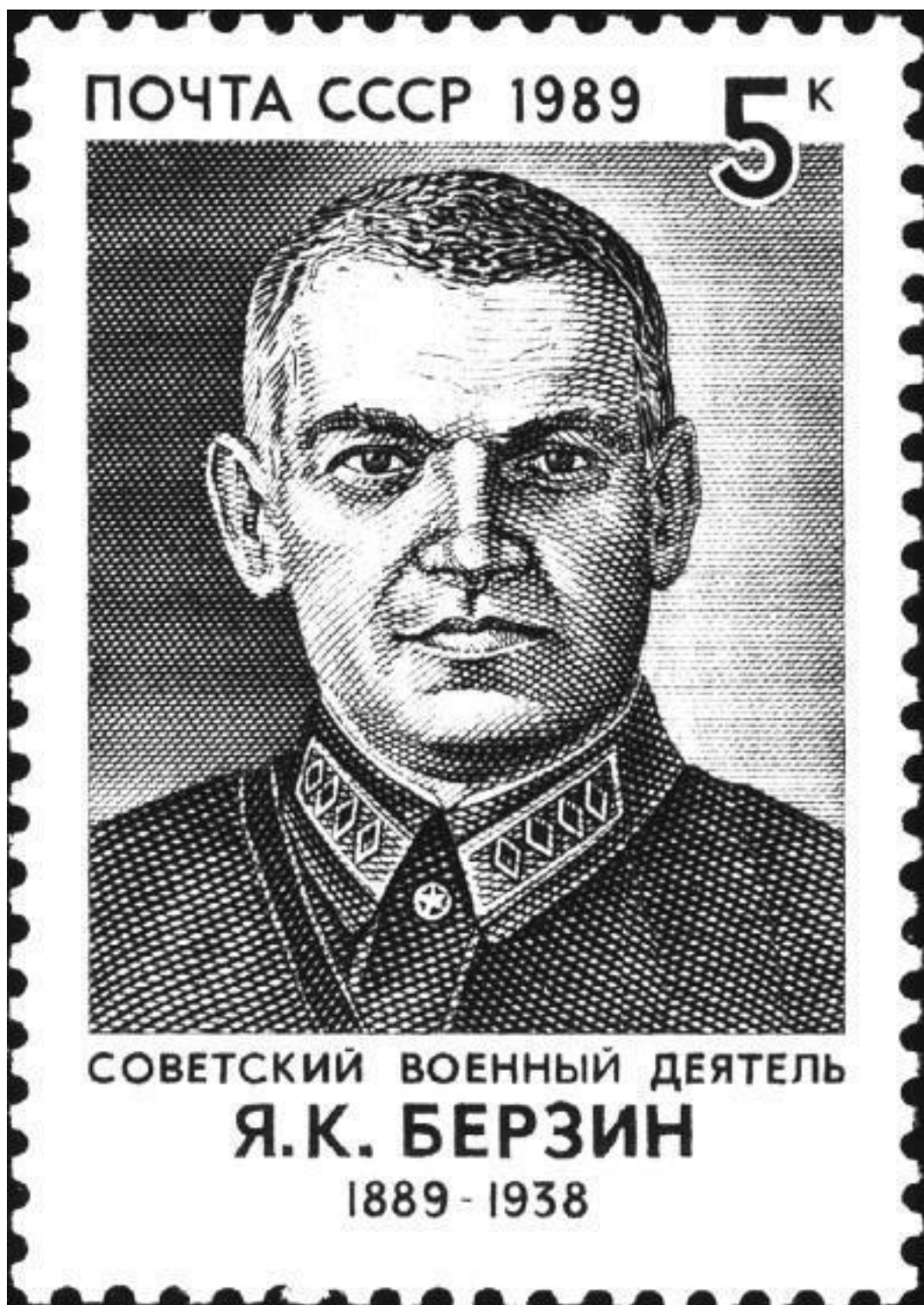
Почтовая марка выпущенная в СССР в 1989 году

С 1936 г. и на целый ряд лет кодовым словом для обозначения начальника военной разведки стало слово «Директор».