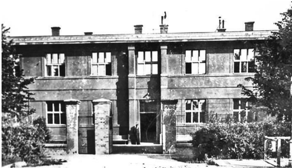
Здание Военно-телеграфных мастерских на аэродроме Кбели (Прага)

огородники – болгары, занимавшиеся сельским хозяйством. К тому же через Чехословакию проходил нелегальный партийный канал связи София – Прага – Москва.