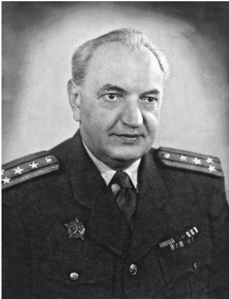
Карел Йозефович Смишек (1893–1968)