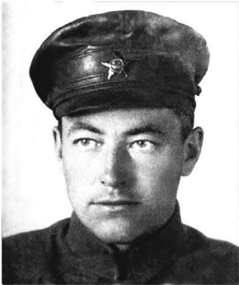
Арвид Янович Зейбот (1894–1934)

Создание военной разведки молодого Советского госу-