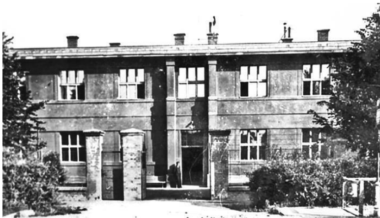
Здание Военно-телеграфных мастерских на аэродроме Кбели (Прага)