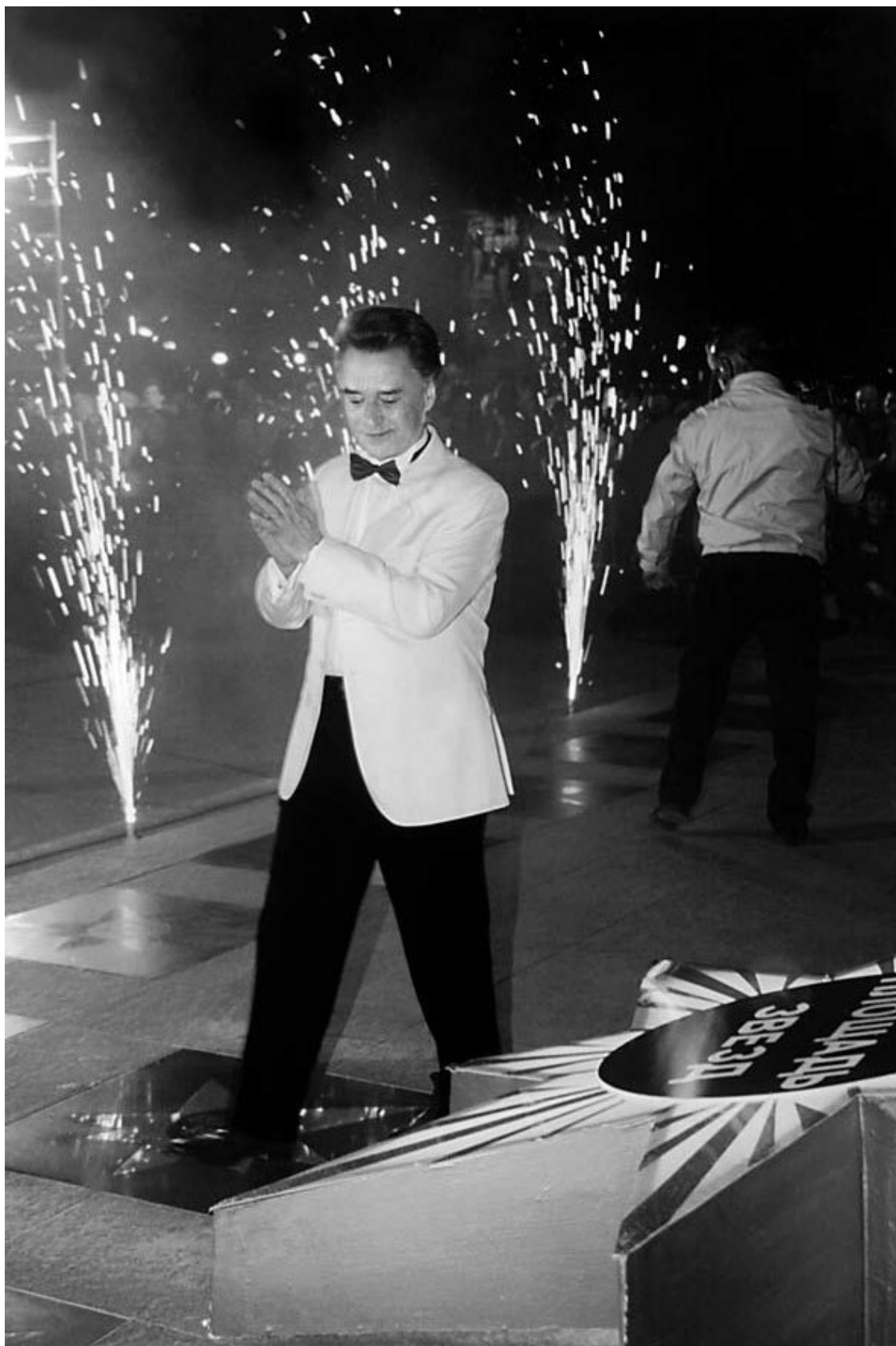
«Площадь звезд». Начало века