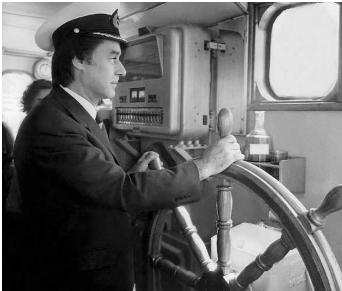
Я принял штурвал журнала «Юность». 1981 год