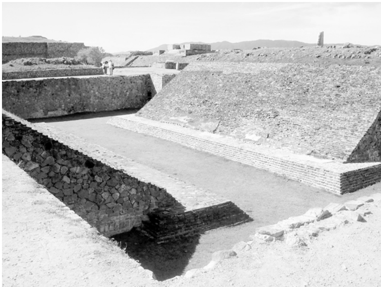
Стадион для игры в мяч (Монте-Альбан)