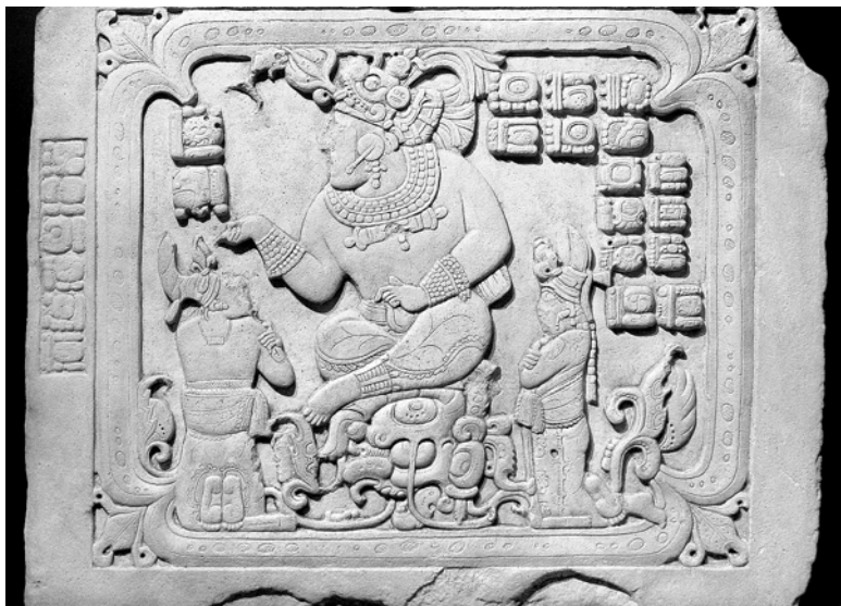
Керамическая панель из Канкуэна, изображающая правителя майя по имени Т'ах'ак' Ча'ан

Боги майя делились на добрых и злых. Среди небесных божеств главным был Владыка мира, бог дня и ночи Ицамна. Также майя очень почитали бога дождя Чака, бога Солнца Кинич-Ахау, богиню Луны Иш-Чель, бога ветра Кетцалькоатля и бога кукурузы Ах-Муна.