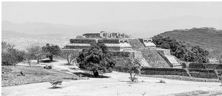
Монте-Альбан (современный вид)

тые враги или те, кого приносили в жертву. Другие утверждают, что это люди с различными физическими отклонениями, а здание, в котором были найдены барельефы, – бывший госпиталь. Но, видимо, всем приятнее было думать, что это исполняющие свои танцы древние сапотеки. На том и порешили. Хотя, скорее всего, это все-таки были изображения жертвоприношений. Известно, например, что во время солнечных затмений сапотеки приносили в жертву карликов, считавшихся детьми Солнца. Да и вся скульптура этого периода была связана с культом человеческих жертвоприношений. Так что так называемые танцоры – это все-таки изображения изувеченных пленников в разнообразных позах (поэтому-то многие исследователи и решили, что они танцуют).