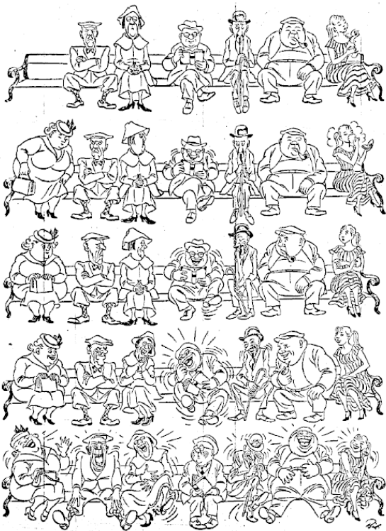
Картина X. Бидструпа «Распространение заразы».

Этот кошмарный эпизод, зафиксированный летописцами, получил отражение в художественной литературе (наиболее известна россиянам пушкинская пьеса «Пир во время чумы»), а также в современной психологической и медицинской терминологии,