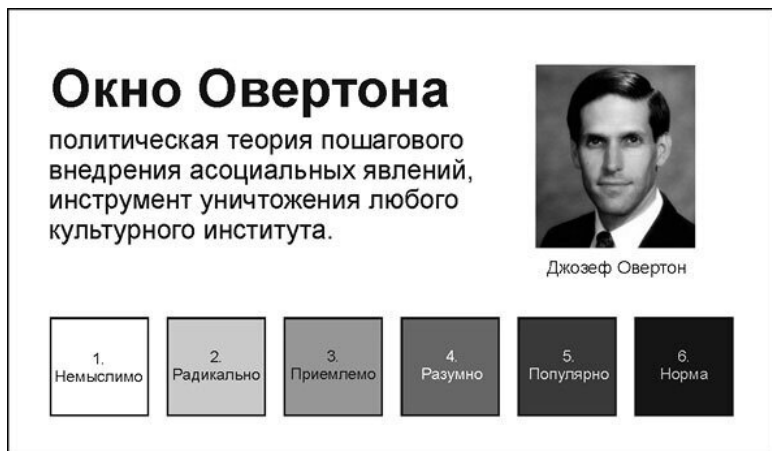
Рис. 2. Этапы перехода общественного сознания от немыслимого к нормальному

го сознания от «немыслимого» к «нормальному».