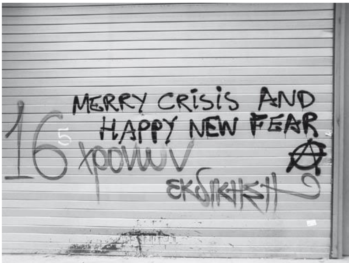
Афины, декабрь 2008