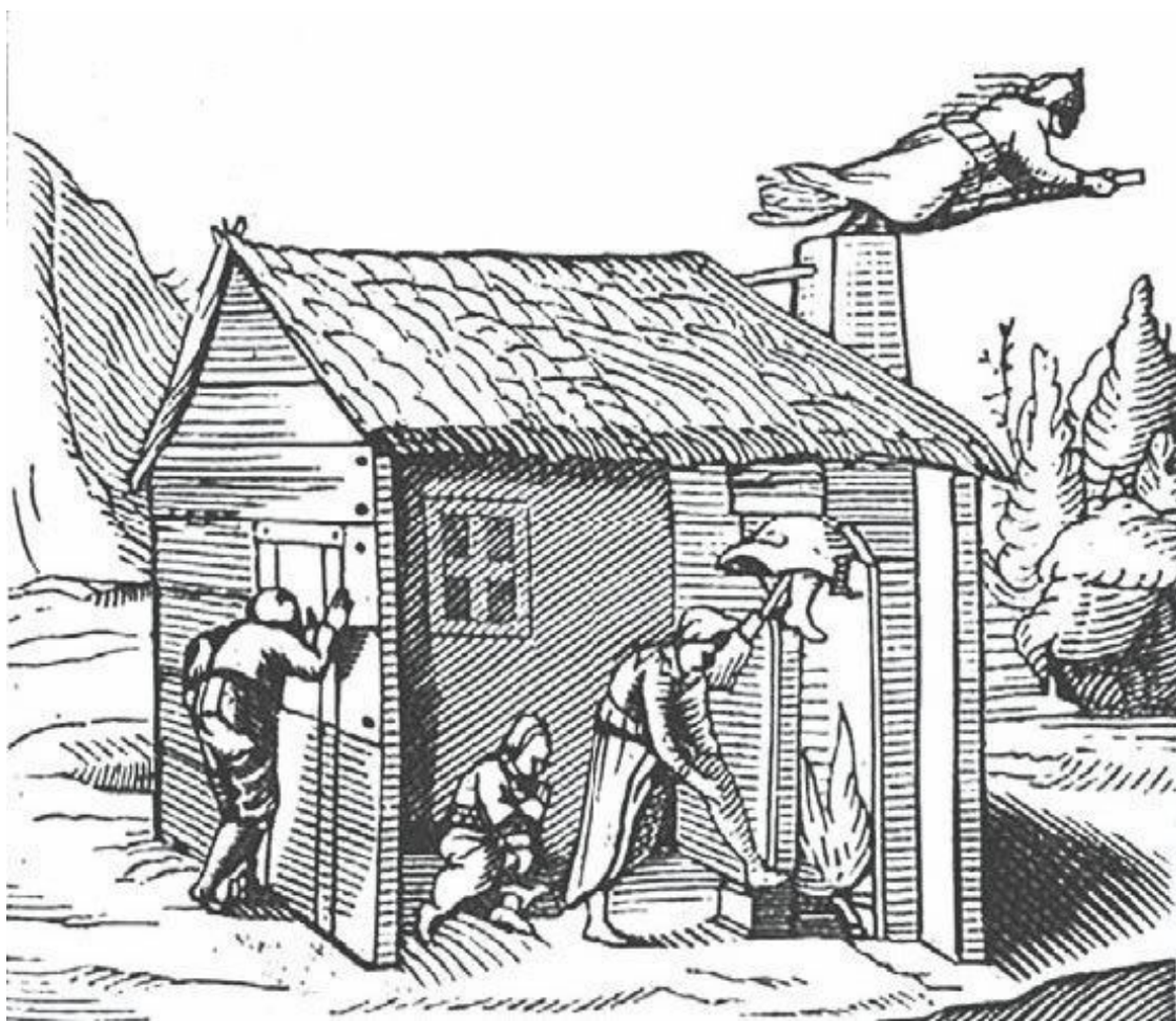
Отправление на шабаш

На шабаше все происходило наизнанку. Сатане отвечивали низкие поклоны, но только повернувшись к нему спиной, затем торжественно отрекались от Бога, Богородицы, Святых и посвящали себя Сатане. Привожу старинные гравюры XVI века, на которых изображены эти различные эпизоды. Но Сатана шел еще дальше – он крестил вновь обращенного, издеваясь над истинным таинством крещения, и принуждал каждого наступать на крест. Далее все колдуны, вооруженные факелами, образовывали круг и танцевали, повернувшись спиной друг к другу. Ровно в полночь все падали ниц перед своим повелителем. Это была минута наивысшего поклонения. После этого начиналось пиршество. Самая старая колдунья, царица шабаша, садилась рядом с Сатаной, и все собирались вокруг трапезы. Особенно много тут поедалось жаб, трупов, печенок и сердец детей, умерших некрещеными. После пира возобновлялись танцы, причем сам Сатана не прочь был принять в них участие или же исполнять роль оркестра.