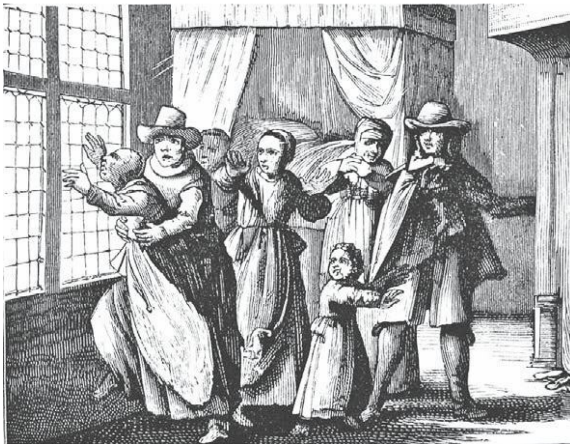
Бесноватая хочет выброситься в окно

Вот еще одна гравюра того же автора, на которой колдунья представлена в таком же состоянии, с той лишь разницей, что припадок совершается иначе, и присутствующим стоит ужасных усилий удержать несчастную, которая пытается выброситься в окно. Затем у этого же автора мы находим колдунью, которая падает на пол во время семейного совещания. Обратите внимание на то, как у нее отведены назад кисти рук. Это – характерный признак, к которому я вскоре возвращусь.