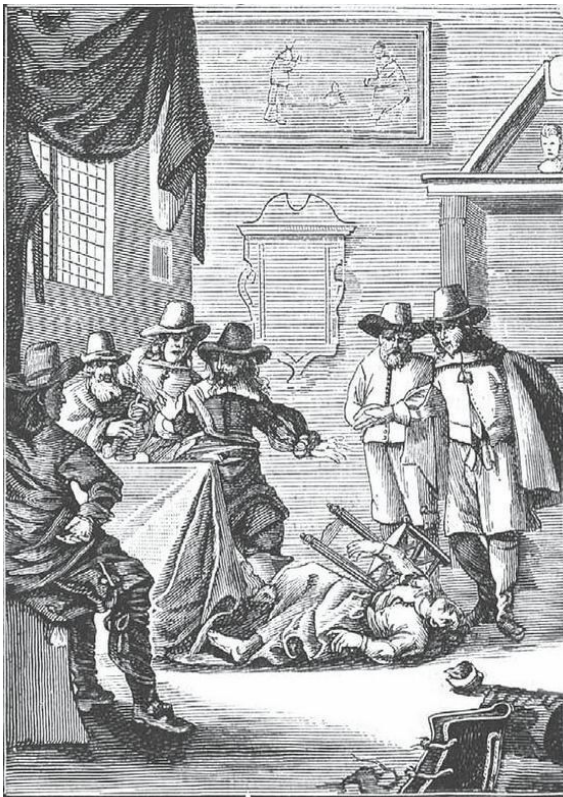
Начало припадка у колдуньи

Если колдунья постоянно наносила ущерб окружающим, то из этого не следует заключать, что ее собственная жизнь была непрерывным празднеством. Мы уже видели, как дьявол обманывал ее, превращая подаренные ей драгоценности в негодные предметы. Хуже того, при малейшей попытке неповиновения с ее стороны, демон бил и терзал свою жертву, вселился в нее и делал ее одержимой, как говорили в те времена. Он выступал от ее имени и ее