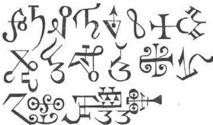
Магические знаки, встречающиеся в договорах с сатаной