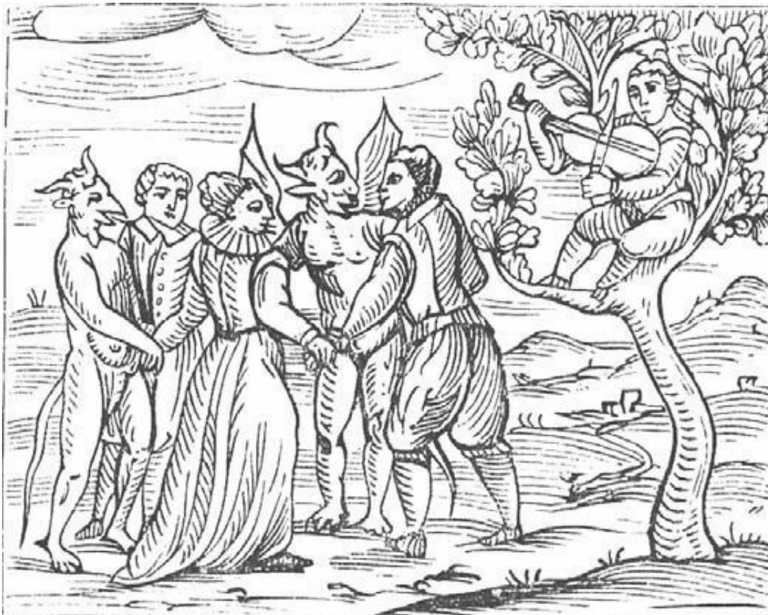
Бал на шабаше

Сообщенные мною факты могли показаться читателю странными и даже смешными — нельзя не изумляться тому, что человеческий ум мог дойти до подобных заблуждений, а эпидемическое и заразительное безумие — довести несчастных галлюцинов до признания себя виновными в тех странных преступлениях, о которых я только что говорил. Но что могло показаться еще более странным, так это приемы, которые использовали суды по отношению к колдуньям. Я бы воздержался от этих подробностей, если бы они не содержали важных с медицинской точки зрения сведений.