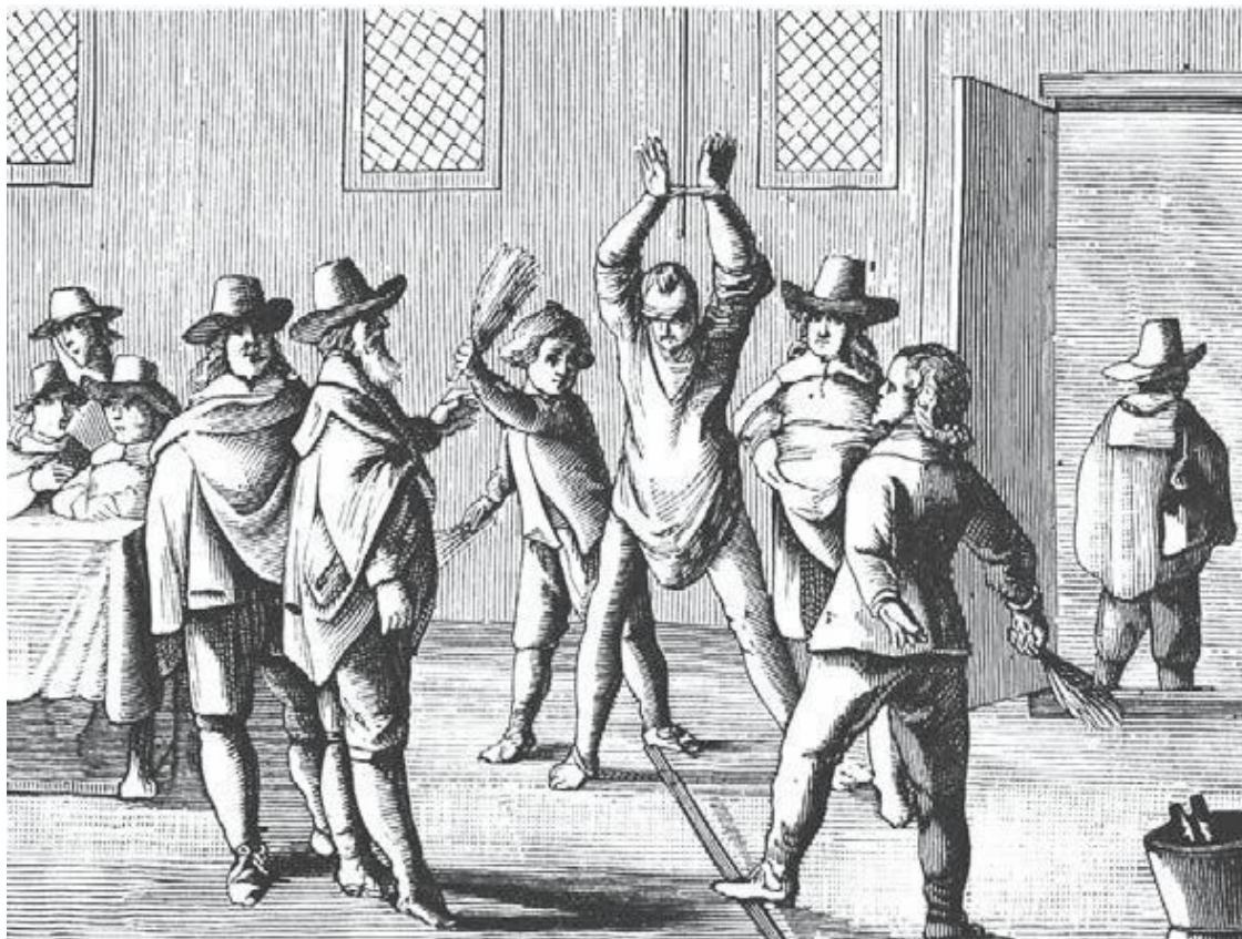
Дыба и сечение