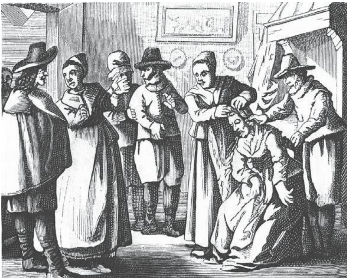
Конец припадка – рвота

устами изрекал кощунства, направленные против самого Бога. Тогда происходил целый ряд явлений, представляющих большой интерес в медицинском отношении. Обращаю на них внимание читателя, так как мы с ними встретимся вновь при изучении одной болезни, хорошо известной в наши дни. Знакомство с ними позволит нам объяснить реальный элемент в колдовстве. Борьба обыкновенно принимала этот характер в присутствии заклинателя, и дьявол, чтобы не упустить своей жертвы, вселялся в нее. Иногда он скручивал одержимую и повергал ее в страшные конвульсии: на это зрелище собиралась толпа соседей, и не трудно было предвидеть, что несчастной угрожала близость уголовного процесса.