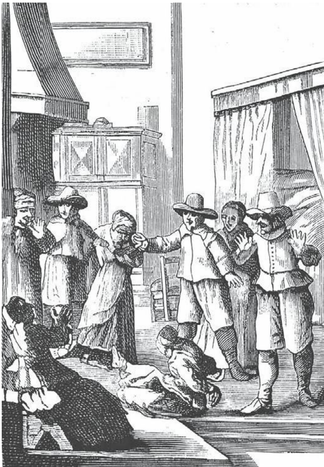
Сведение рук во время припадка

Особенно часто подобные припадки беснования случались во время проповедей и церковных обрядов. Привожу еще одну гравюру, заимствованную у Палинга, на которой изображен припадок, начавшийся в самой церкви, в то самое время как проповедник трактует о власти демона.