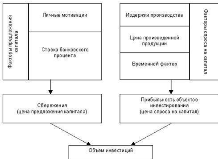
Рисунок 3. Рыночный капитал и факторы инвестирования в представлении А. Маршалла

цию в форме средств производства и потребления, производительный капитал, что является методологической ошибкой.