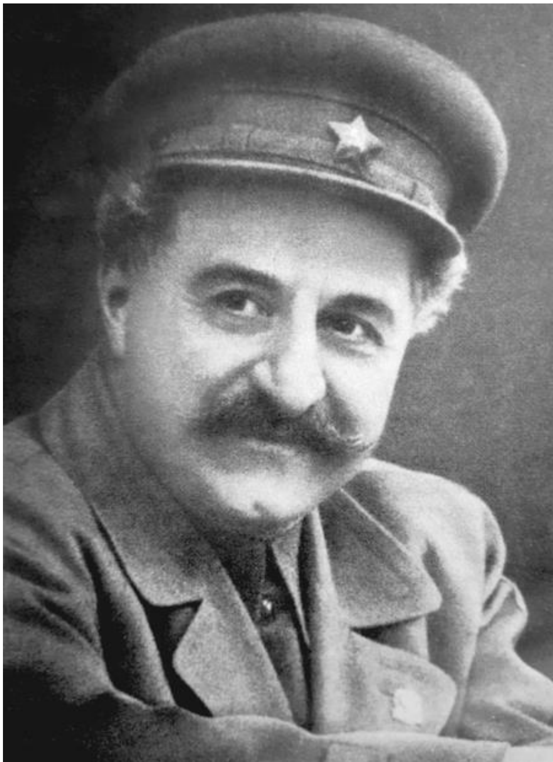
Григорий Константинович (Серго) Орджоникидзе

Серго был искренним, невероятно работоспособным, честным и наивным большевиком. Мог ворваться к Сталину и горячо требовать освобождения из-под стражи очередного арестованного своего заместителя, а мог, взобравшись на трибуну, клеймить «врагов народа и саботажников». После очередного, по-кавказски горячего (на грузинском языке) разговора с Кобой, Серго 18 февраля 1937 года выстрелил в себя из пистолета. Известно, что вождь поручил ему сделать на пленуме доклад «О вредительстве в тяжелой промышленности» и ему пред-