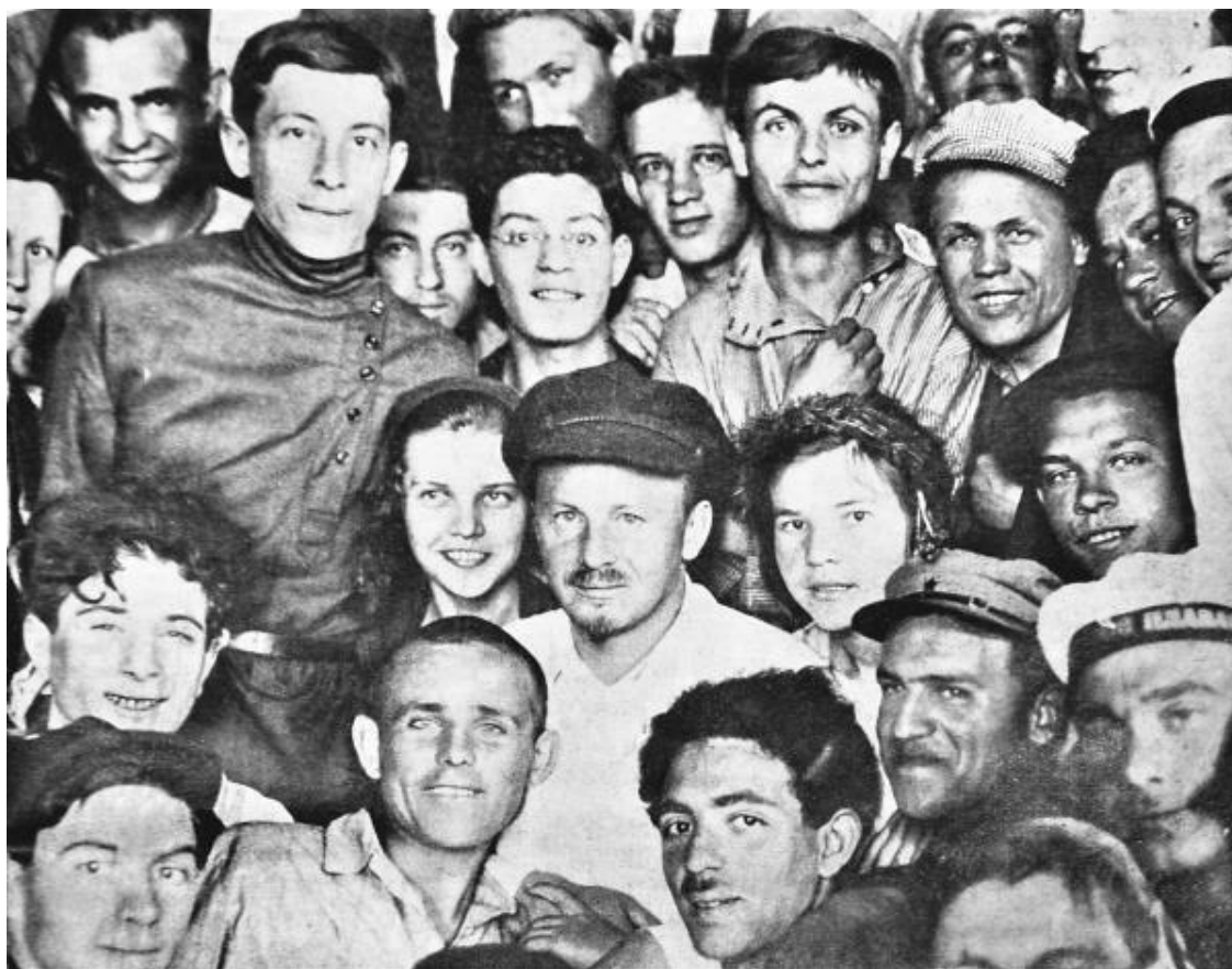
Бухарин на встрече с рабоче-крестьянскими корреспондентами

Какой была атмосфера истерии в стране, которой поддались и вроде бы неглупые старые большевики, говорит такой факт: член ЦК Иосиф Пятницкий, придя с пленума домой, сказал жене, как Бухарин «лежал среди всех, обросший бородой, в каком-то старом костюме, на полу; все уже смотрели на него как на смердящий труп». Сталин бросил в зал: «Бухарин объявил голодовку. Николай, кому ты выдвигаешь ультиматум, Центральному Комитету? Проси прощения у него».