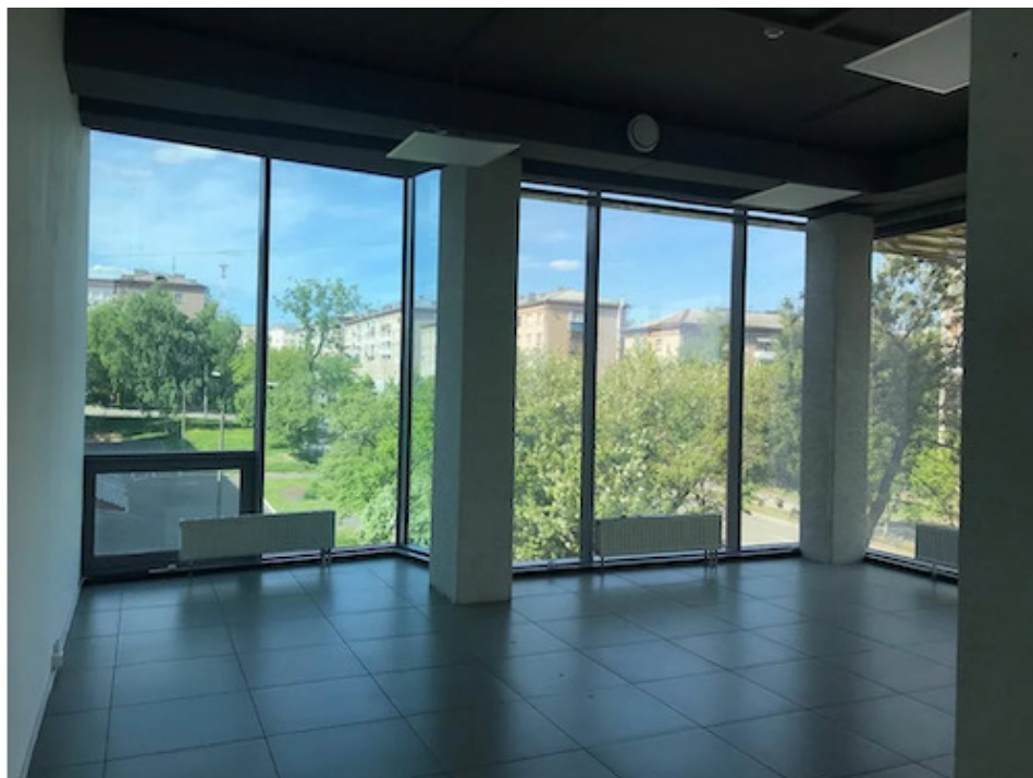
Объект сравнения 4: