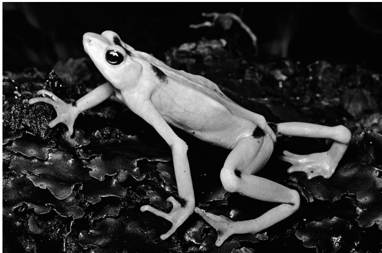
Панамская золотая лягушка ( Atelopus zeteki )

EVASS располагается примерно в центре ареала золотых лягушек, однако по задумке полностью отрезан от внешнего мира. Ничто не поступает в здание без предварительной тщательной дезинфекции. Даже лягушки, для того чтобы попасть внутрь, должны сначала пройти обработку дезинфицирующим раствором. Посетители должны надевать специальную обувь и не могут заносить внутрь никаких сумок, рюкзаков или оборудования. Вся вода, поступающая в контейнеры, фильтруется и специальным образом обрабатывается. Закрытый характер заведения создает у визитеров ощущение, будто они оказались в подводной лодке или, точнее, в