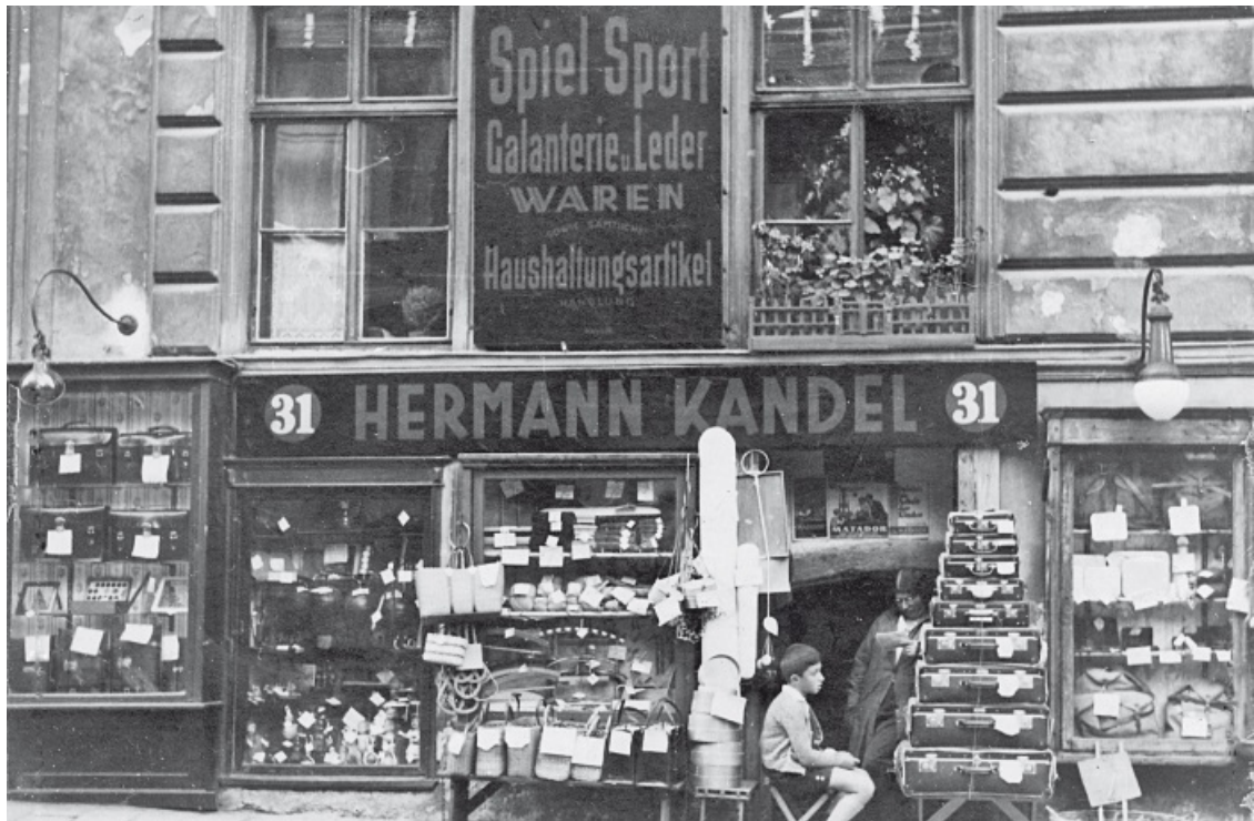
2–2. Магазин моих родителей на Кучкергассе, где продавались игрушки, чемоданы и сумки. Моя мама и я, а может быть, мой брат.

и недалеко от дома номер 19 по Берггассе, где жил Зигмунд Фрейд. Мои родители работали в магазине, и у нас сменилось несколько домработниц.