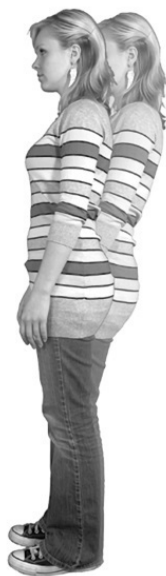
Рис. 1. Тест на раскачивание. а – отклонение вперед; б – отклонение назад

Если вы сделаете утверждение, которое окажется положительным – истинным или уместным, – ваше тело отреагирует заметным наклоном вперед (обычно это происходит в течение примерно десяти секунд). Если утверждение окажется негативным – ложным или неуместным, – ваше тело в течение этого же времени заметно отклонится назад (рис. 1, а, б).