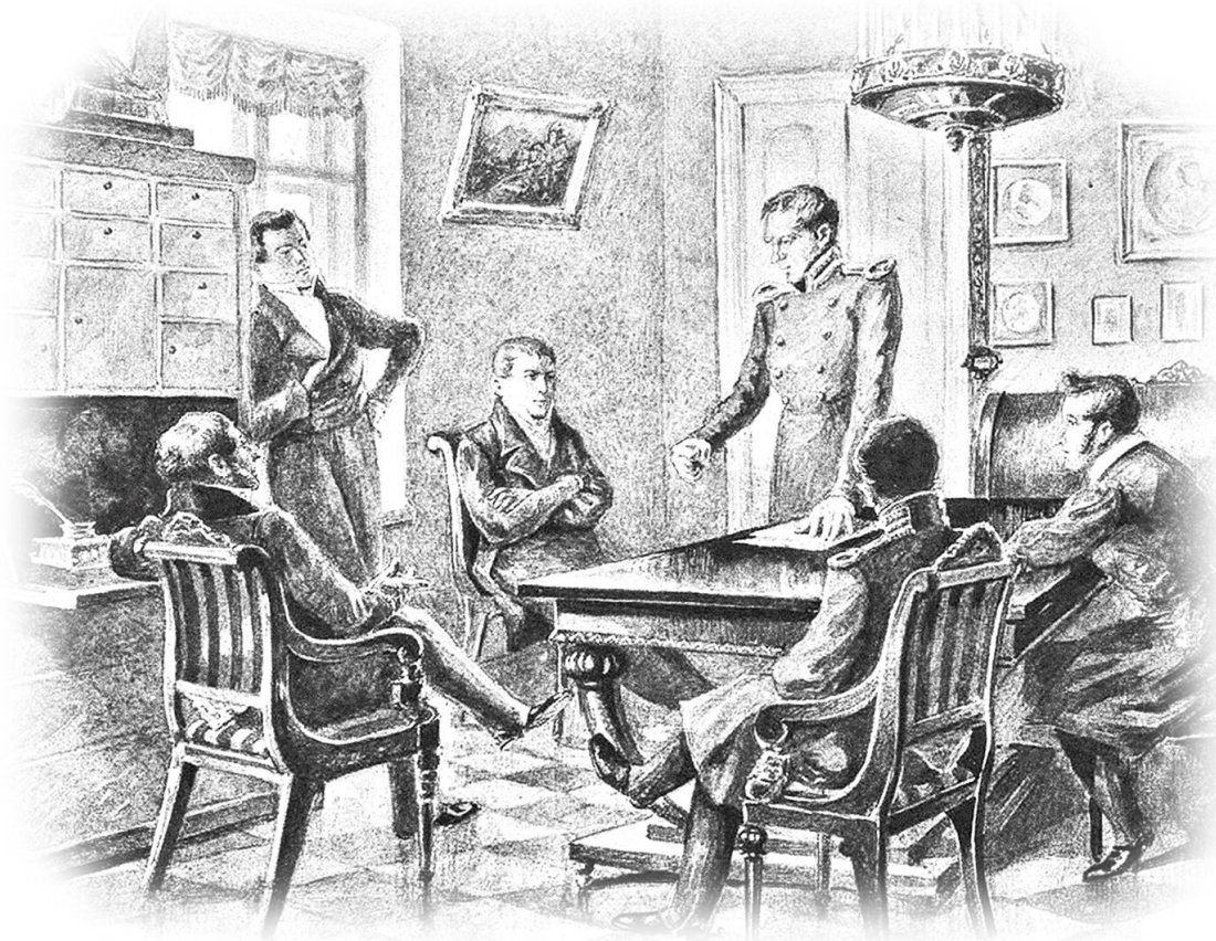
Заседание «Союза благоденствия»

В начале XIX в. Англия освоила сверхвыгодный бизнес – экспорт революций. Она являлась и мировым финансовым центром, и центром мирового масонства. А структуры «вольных каменщиков» стали удобным инструментом для подрывных операций. Борьба за сферы влияния такими методами оказалось гораздо эффективнее и дешевле, чем вести войны. Мы уже рассказывали, как в 1801 г. англичане организовали убийство Павла I. Но в то время им требовался только верхушечный переворот – силы России были нужны для борьбы с Наполеоном.