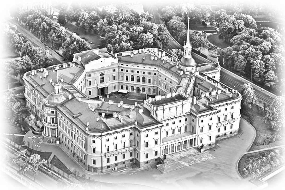
Михайловский замок в Санкт-Петербурге

– Экий богатырь! – оценила новорожденного его бабушка, императрица Екатерина. В этот день, 25 июня 1796 г., новость обсуждали и придворные, и прислуга, она полетела по Петербургу. У наследника престола Павла Петровича после двух старших сыновей одна за другой рождались девочки, шесть дочерей. И наконец, снова мальчик. Получилось так, что старшие братья уже повзрослели, женились, а младший – в пеленках. Впрочем, рождение третьего сына не считалось государственной необходимостью. Для надежного продолжения династии представлялось достаточно двоих. Второй – на случай, если что-то случится со старшим. Ну а третий – уже так, для «перестраховки».