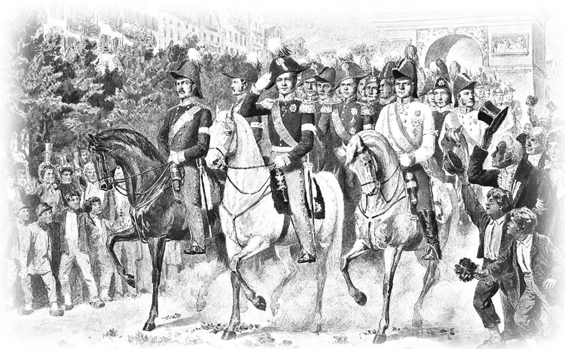
Вступление русской армии в Париж в 1814 году. Художник А. Д. Кившенко

Угадать главных заказчиков и организаторов цареубийства было совсем не трудно. Ведь непосредственные исполнители ничего не выиграли! Наоборот, сломали себе карьеру, по сути доживали в ссылках по поместьям. Зато Александр, едва взойдя на престол, сразу же подписал дружественную конвенцию с Англией. Отказался от любых претензий, в том числе и от Мальты. Снял арест с судов и активов англичан, открыл им свободную торговлю, и они завалили Россию своим импортом.