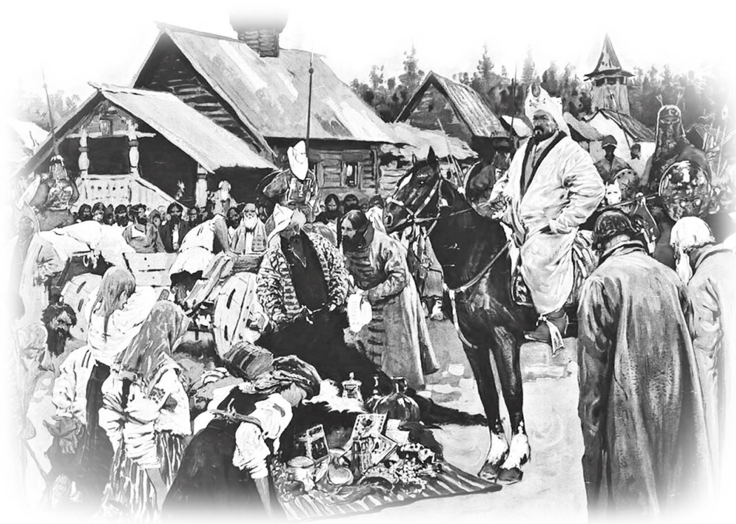
Ордынский баскак приехал в русский город. Картина С.В. Иванова

Что погубило Древнюю Русь? Эгоизм. Про саму-то Русь многие забыли! Думали только о собственных выгодах. Князья – чтобы их княжества были побольше и побогаче. И жители разных областей тоже привыкли стараться только ради своего княжества, своего города. Людей из других русских городов считали чужими или вообще врагами. Вот и развалили державу. И она досталась завоевателям.