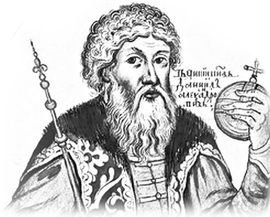
Князь Даниил Московский

И всё-таки Бог не оставил Русскую Землю. Младшего из четырёх сыновей Александра Невского звали Даниилом. Из всех братьев он получил самое бедное и маленькое наследство: городок Москву и земли вокруг неё, сплошные леса. Но Даниил не полез в разборки других князей. Он был спокойным, умным, трудолюбивым. Засучив рукава, занялся собственным хозяйством. Не ленился, сам обходил рынки, мастерские ремесленников, ездил по деревням. Узнавал, где возникли какие-то трудности, какая нужна помощь. Но для тех тяжёлых времён мир и порядок оказались очень ценными. По Руси расходились слухи – есть такое княжество, где нет войны и разорения, можно спокойно жить и трудиться. Там правит честный и справедливый князь. В Москву стали приходить беженцы из других мест.