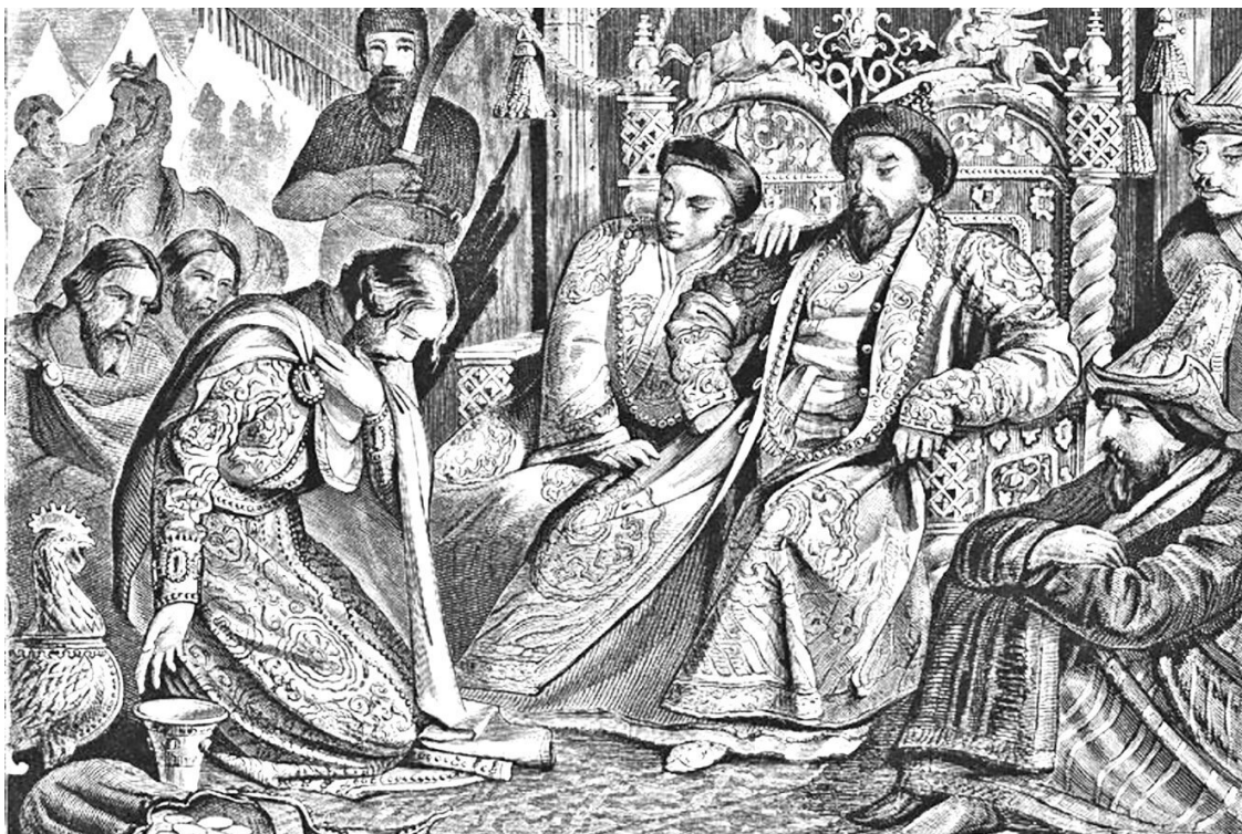
Русский князь у ордынского хана. Художник В.В. Верещагин