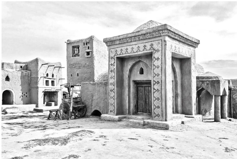
Столица Золотой Орды город Сарай