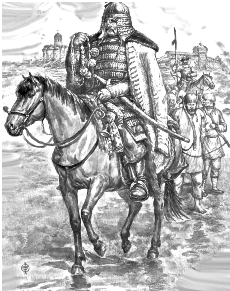
Татары угоняют русских в неволю.