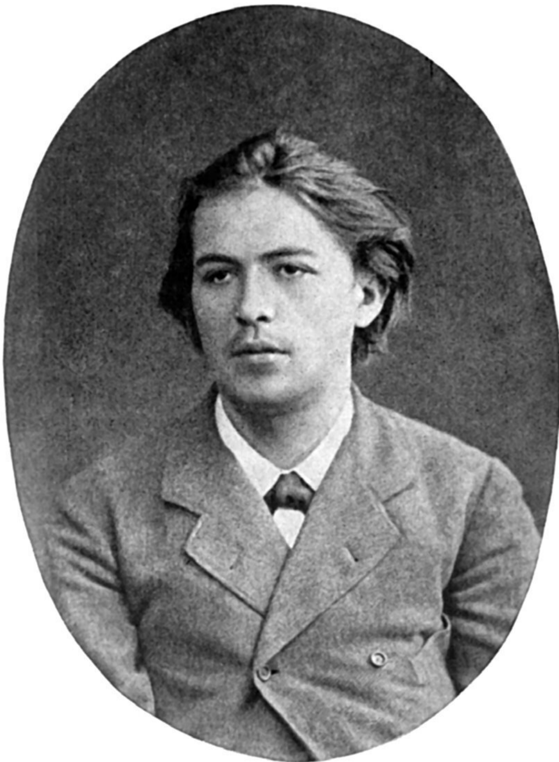
А.П. Чехов в юности.

Ну, не сечь ли после этого? Непременно высечь и приказать, во-первых, все неправильные глаголы выучить, а во-вторых, извлечь корень – 2/3 степени из самой длинной периодической дроби.