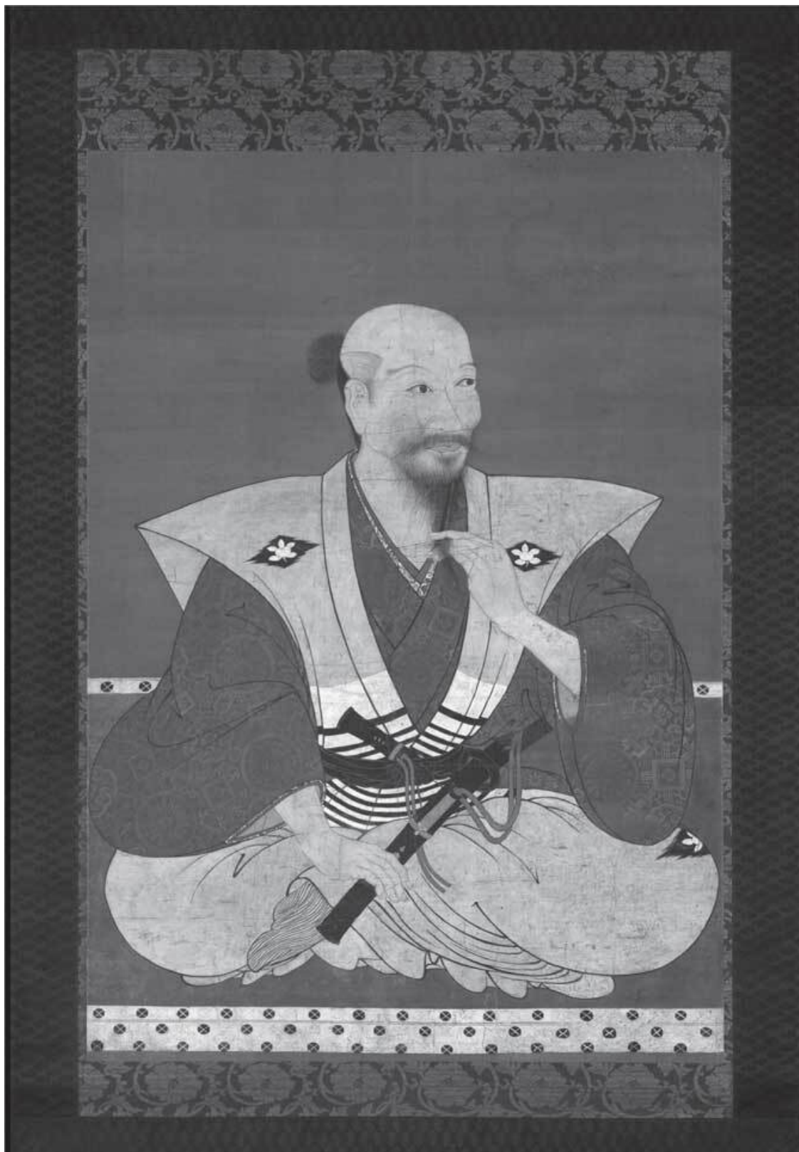
Портрет воина. Неизвестный художник XV–XVII в.

Приблизительно в это время Мусаси перестал пользоваться в поединках боевыми мечами. Никто больше не сомневался в его непобедимости. В дальнейшем Мусаси посвятил себя поиску глубинного понимания Пути меча.