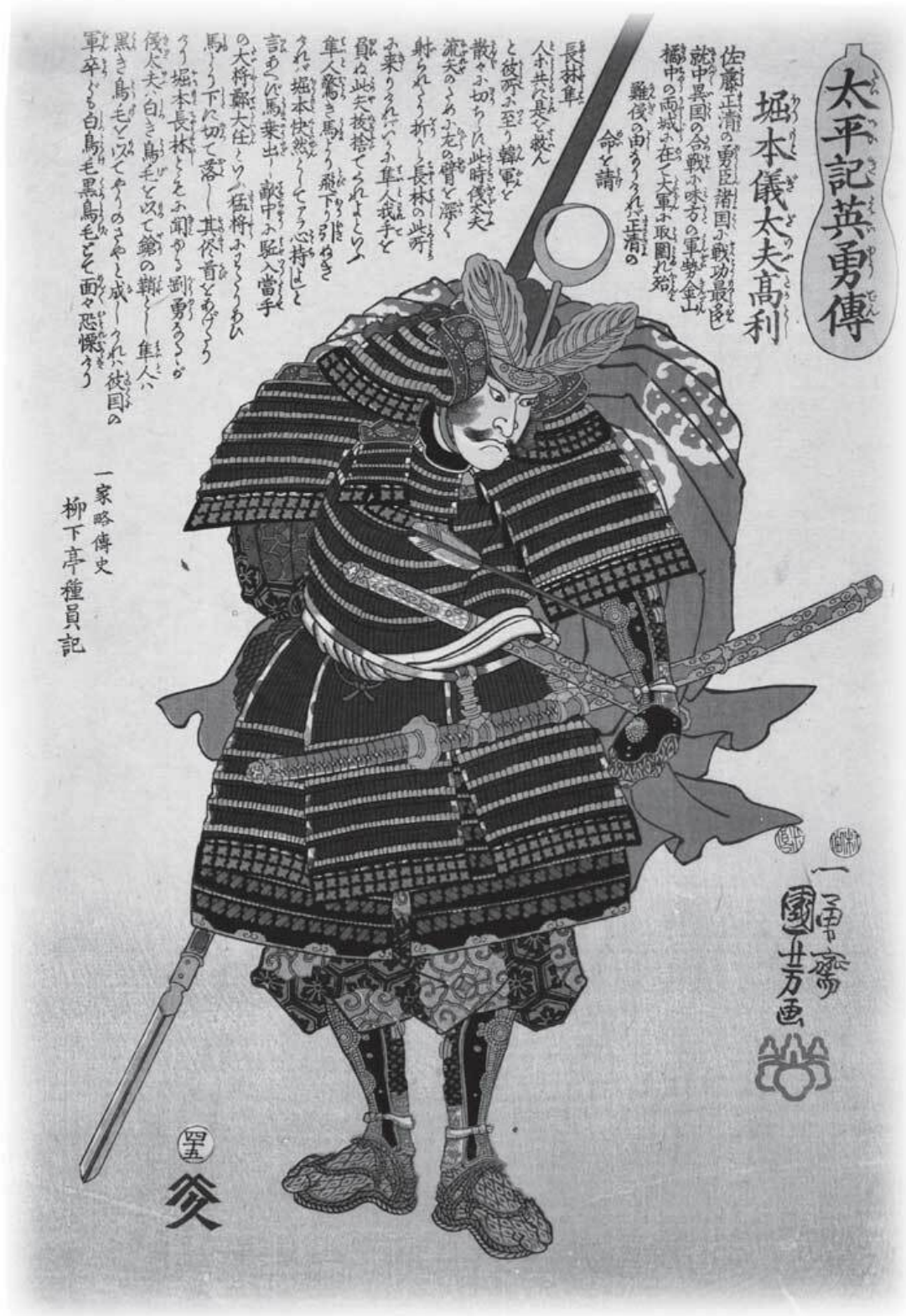
Японский воин XVI в. в соломенном плаще, вооруженный мечами и мотыгой

Возможно, именно этим обстоятельством руководствовался Мусаси, когда избрал объектом своей кровной мести Есиока Сэйдзиро, главу семейства.