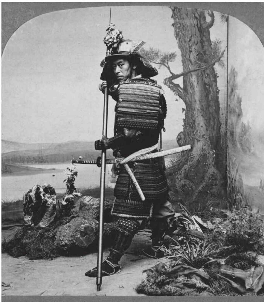
Древний костюм воина; фото 1902 г.

Однако не все встречи Мусаси с мастерами боевых искусств заканчивались поединками. Говорят, что однажды Мусаси встретил на улице известного самурая Ягю Хего, племянника не менее знаменитого Ягю Тадзима-но-ками. Хотя Мусаси и Хего до этого ни разу не виделись, они сразу же узнали друг друга и после короткого разговора стали друзьями. Хего пригласил Мусаси в свое имение, где они пили сакэ и играли в go , как старые знакомые. Мусаси гостил у Ягю Хего довольно долго, но два великих мастера ни разу не скрестили мечи. Впоследствии Мусаси так высказывался об этой встрече: «То, что я сразу узнал Хего, было таинственным действием ума, без причины и цели. Почему мы не вызвали друг друга на поединок? В этом не было необходимости, потому что мы безмолвно постигли равенство нашего мастерства». Эта встреча напоминает другую встречу равных, встречу Будды и его ученика Кашьяпы, в ходе которой Будда показал цветок, а Кашьяпа с пониманием улыбнулся.