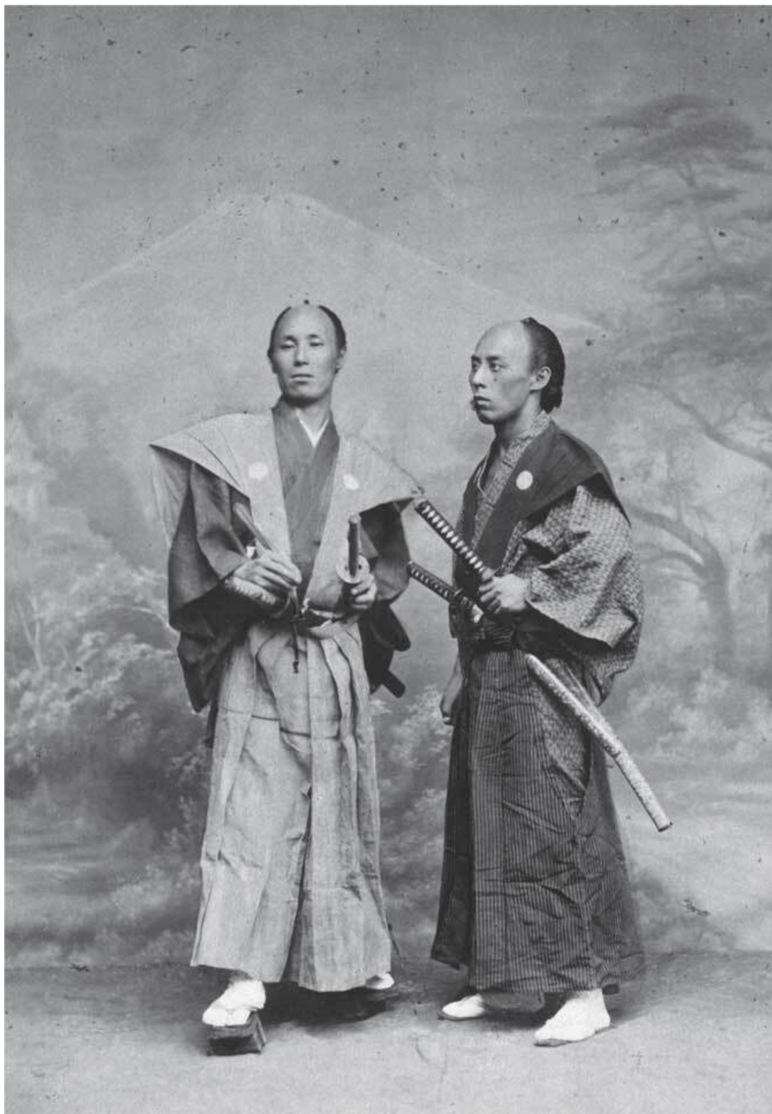
Два японца, возможно самураи. Студийный портрет. 1877 г.