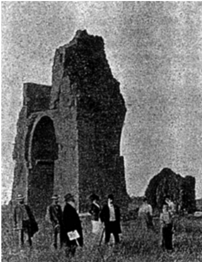
Гвидо фон Лист с членами своего Общества осматрива-