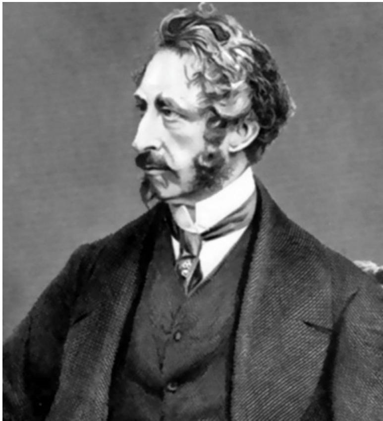
Английский писатель Эдвард Бульвер-Литтон, автор романа «Грядущая раса»

Страсти, раздирающие наше общество, совсем не знакомы Ана. Они не конфликтуют, не пытаются конкурировать