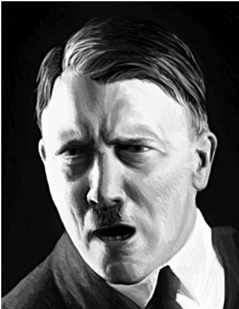
Адольф Гитлер выступает перед публикой