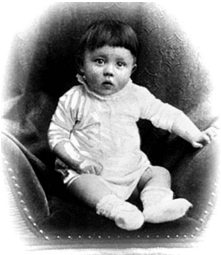
Адольф Гитлер в младенчестве

Вскоре семейство Гитлер перебралось в Леондинг, близ Линца. Возраст Адольфа уже позволял его родителям задум-