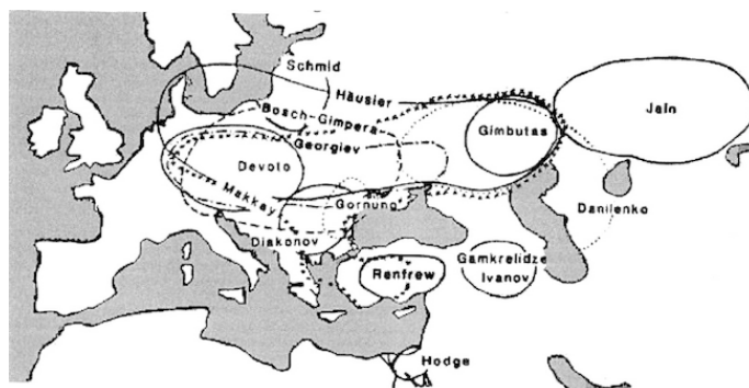
Версии локализации прародины индоевропейцев

Во второй половине столетия, в основном стараниями американского профессора Марии Гимбутас, в науке утвердилось мнение, что эта прародина располагалась в причерноморских или прикаспийских степях (собственно, эту теорию выдвинул еще в 1869 году Теодор Бенфи). Древние арии были кочевниками, воинами (в отличие от миролюбивых жителей старой Европы), именно с помощью изобретенных ими боевых колесниц они могли одерживать победы и покорять земледельческие цивилизации Старого Света. Эта т. н. курганная теория доминирует в науке и сейчас, хотя предостаточно и других версий, как «европейских», так и «азиатских».