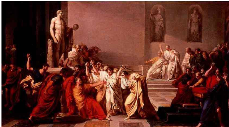
Рис. 2. Виченцо Камуччини «Убийство Цезаря», 1798

19 августа 43 г. до н. э. Рим: консулом избран волно- вой герой Октавиан Август