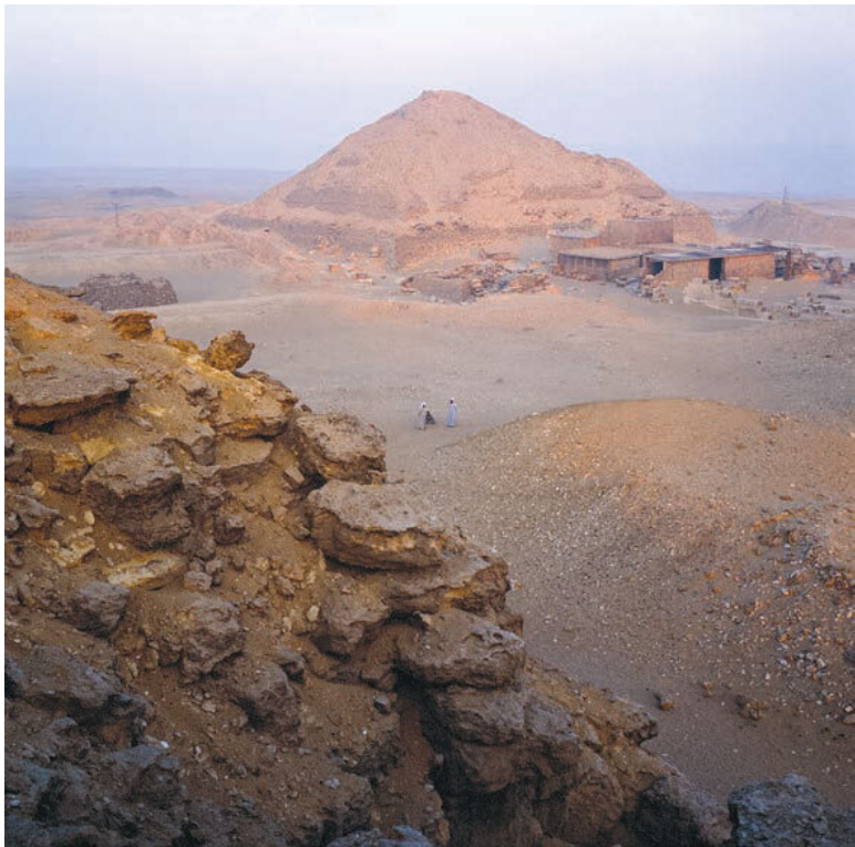
Начало дня. Южная Саккара

Титул «казначей бога», который носил Ихи, принадлежал чиновникам, которые по долгу службы много путешествовали, выполняя различные царские поручения. Среди них было много начальников древнеегипетских экспедиций за материалами, особенно в конце Древнего царства. В 2002 го-