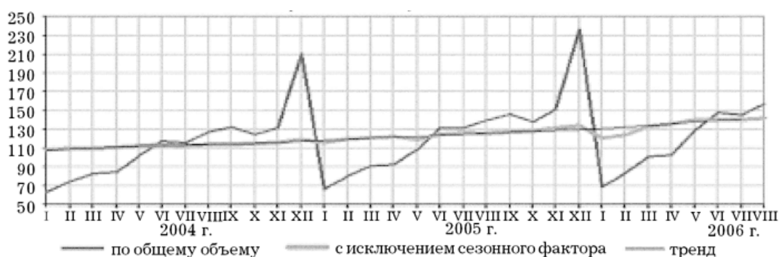
Рис. 2. Динамика инвестиций в основной капитал

Динамика инвестиций в основной капитал в период с 2004 по 2006 г. приведена на рисунке 2.