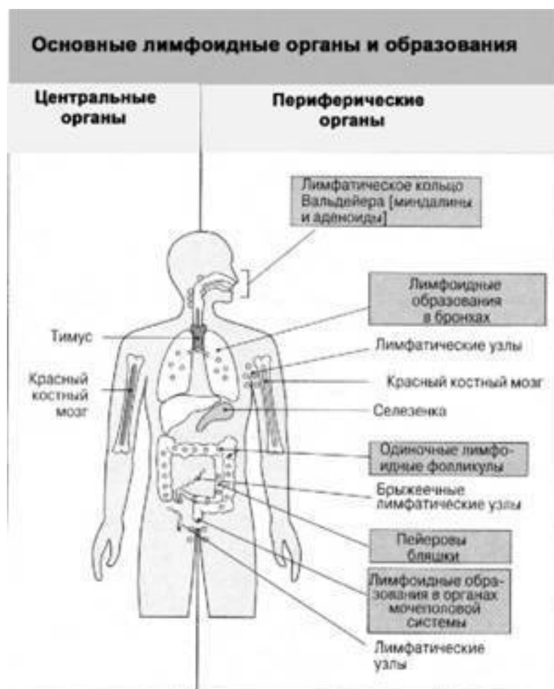
Рис. 3. В центральных лимфоидных органах человека – тимусе и костном мозге – созревают Т– и В-клетки соответственно. В гуморальный и клеточный иммунные ответы вовлечены периферические лимфоидные органы

Органы иммунной системы разбросаны по всему телу и связаны друг с другом и другими органами сетью лимфатических сосудов подобно кровеносным сосудам. В создании иммунной системы человека принимают участие как центральные органы, в которых иммунные клетки вырабатываются и созревают – костный мозг и вилочковая железа (тимус), так и периферические, где клетки дозревают и «обучаются» – селезенка, лимфатические узлы, лимфоидная ткань и др. (рис. 3). В лимфатических сосудах и лимфоузлах содержится лимфа, которая в отличие от крови представляет собой прозрачную слегка желтоватую жидкость. Греки называли словом лимфа чистую и прозрачную воду подземных ключей и источников.