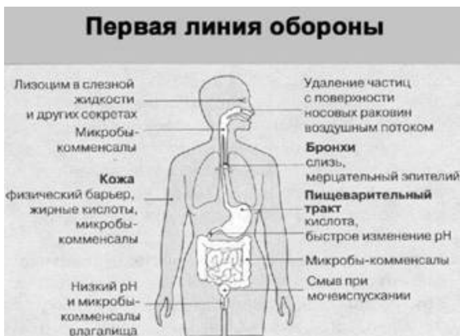
Рис. 1. Большинство возбудителей болезней человека не способны проникать во внутреннюю среду организма благодаря разнообразным физическим, биохимическим и микробным барьерам, которые представляют собой первый эшелон защиты. Размножение многих вредных

Чистая кожа лучше самостерилизуется, поскольку в ней лучше работают кожные железы. Например, возбудитель дизентерии, попав на чистую кожу, погибает через 15 минут, а на грязной коже большая часть бактерий и через 30 минут продолжает себя нормально чувствовать.