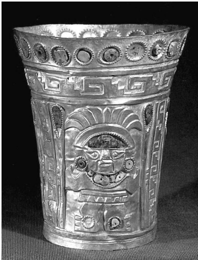
Церемониальная ваза с изображением бога Наймлапа. На-