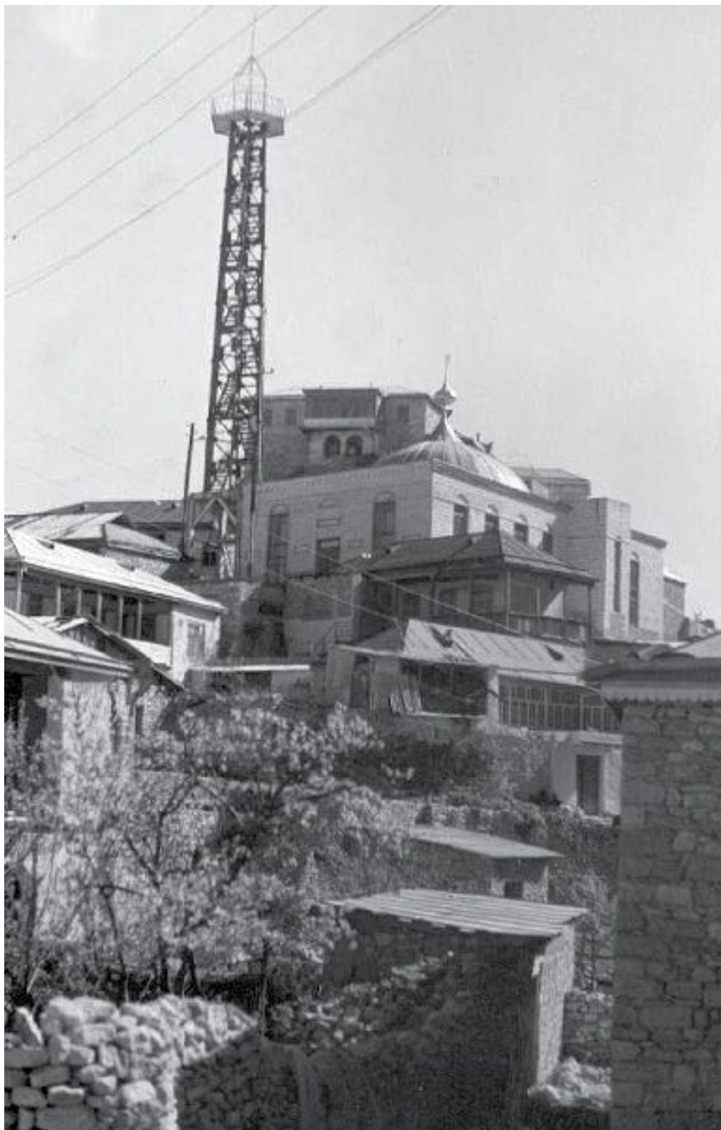
Кудали. Современный вид.