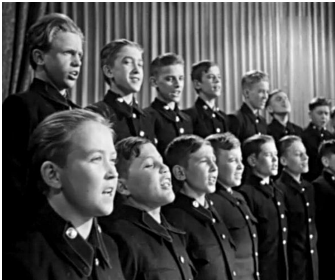
Кадр из фильма «Счастливая юность»