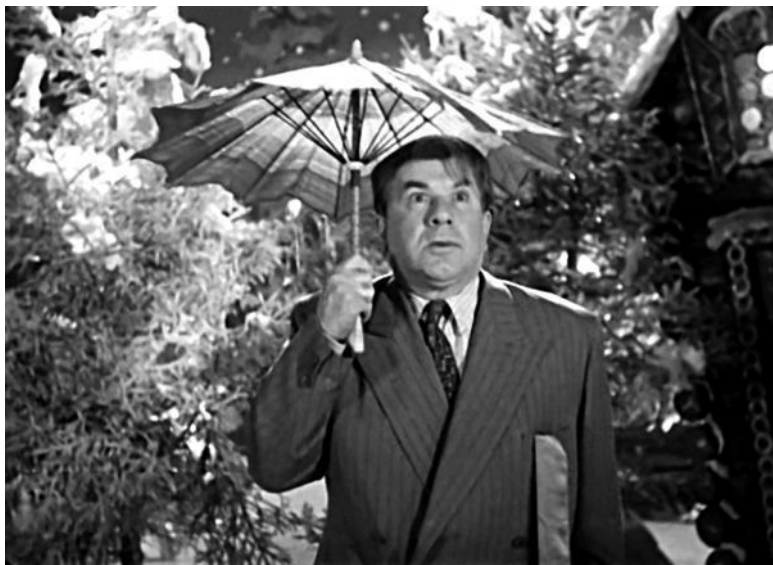
Кадр из фильма «Карнавальная ночь». 1956 г.

проведено на высоком уровне и «главное – серьезно!». Он предлагает свою программу, с докладчиком и выступлением лектора-астронома. Кроме классической музыкой и выступлением ансамбля песни и пляски, никаких других музыкальных номеров, по мнению Огурцова, быть не должно.