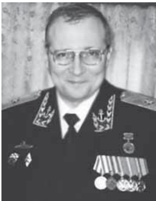
Капитан 1 ранга Касатонов Владимир Львович, 2000–2005