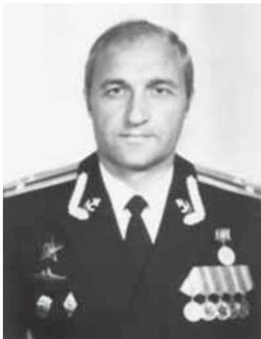
Капитан 2 ранга Нечипуренко Виктор Александрович, 1989–1991

РКР «АДМИРАЛ ЗОЗУЛЯ» – 17.10.1965 – 24.09.1994