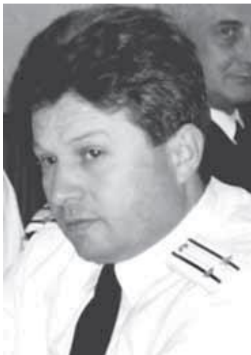
Капитан 2 ранга Хабибулаев Али Хасбулаевич, 2001–2006

ЭМ («БЕССТРАШНЫЙ») «АДМИРАЛ УШАКОВ» 28.12.1991 – н. в. Бортовые номера: 694 (1993), 678 (1995), 434 (1996).