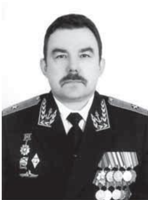
Контр-адмирал Турилин Александр Васильевич, 2000–2003