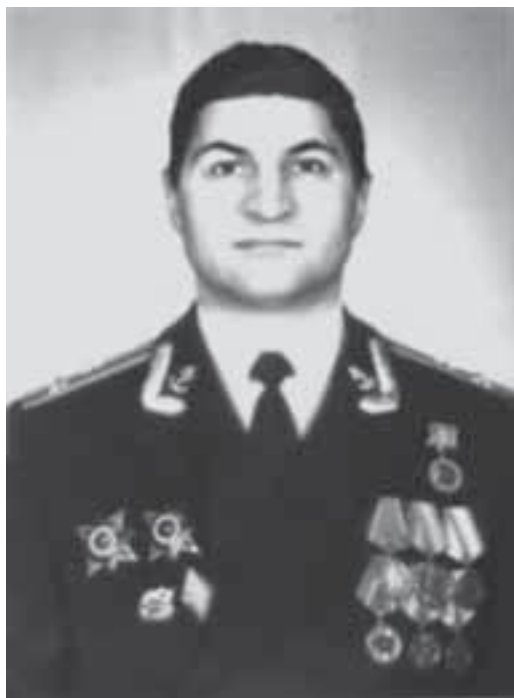
Капитан 2 ранга Святасhev Петр Григорьевич, 1978–1984