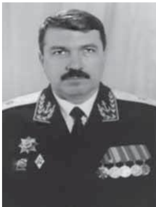
Контр-адмирал Челпанов Александр Владимирович, 1995–2000