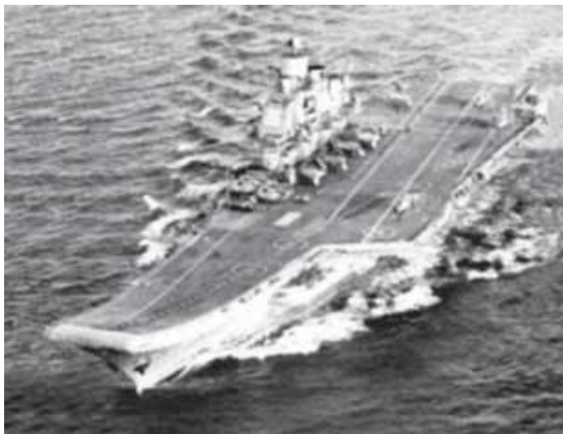
Бортовые номера: 063.