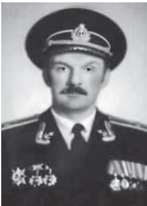
Капитан 1 ранга Авакянц Сергей Иосифович, 1991–1996