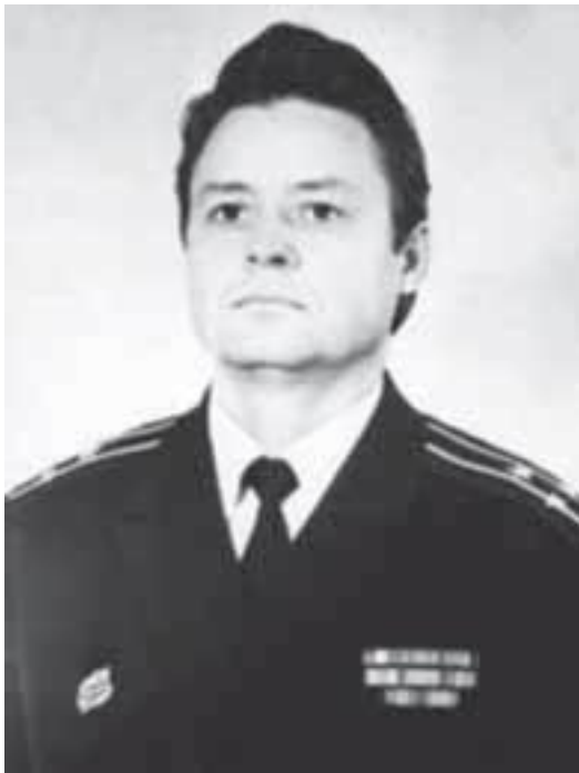
Капитан 2 ранга Виноградов Ким Семенович, 1971–1974